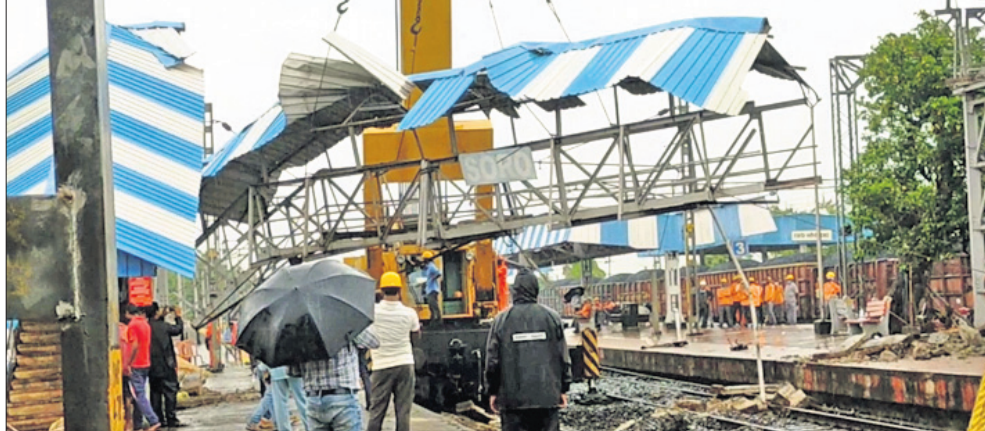
ଓଡ଼ିଶାରେ ଗୁଡ଼ିଆ ଉପରେ କରାଯାଉଥିବା କାମର ଚିତ୍ର।

୬ଦିନ ଧରି ଲଘୁଚାପଜନିତ ବର୍ଷା ଲାଗି ରହିବାରୁ ବାଲେଶ୍ୱର ଜିଲ୍ଲା ବାହାନଗା ବ୍ଲକ୍ ବରିପଦା ପଞ୍ଚାୟତ ୧୫୦ ଜଣ ମୃତ ହିତାଧିକାରୀଙ୍କ ନାମରେ ୨.୭୯ ଲକ୍ଷ ଟଙ୍କା ବାର୍ଦ୍ଧକ୍ୟ ଭରାଣୁ ଆମ୍ବୁୟା କରାଯାଇଥିବା ରିପୋର୍ଟରେ କୁହାଯାଇଛି।