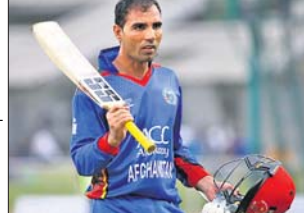
କାବୁଲ, ୨୧୧୦(ପି.ଟି.): ଆଫଗାନିସ୍ତାନ