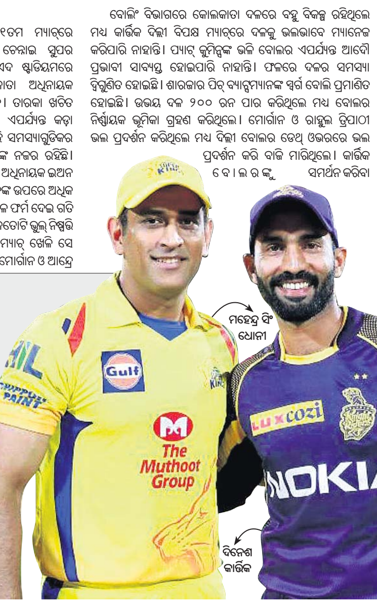
ମହେନ୍ଦ୍ର ସିଂ ଧୋନୀ

ଆକାଶ, ୨୧୧୦(ପି.ଟି.): ଇଣ୍ଡିଆନ୍ ପ୍ରିମିୟର ଲିଗ୍ (ଆଇପିଏଲ୍)ର ୨୧ତମ ମ୍ୟାଚ୍ରେ ରୁଧ୍ରବାର କୋଲକାତା ନାଇଟ୍ ରାଇଡର୍ସ ଓ ଟେକ୍ସାସ ସୁପର କିଙ୍ଗ୍ସ ମୁହାଁମୁହିଁ ହେବେ। ସ୍ଥାନୀୟ ଶେଷ ଜାଏବ୍ ସ୍ଥାପନାରେ ଖେଳାଯିବାକୁ ଥିବା ଏହି ମ୍ୟାଚ୍ରେ କୋଲକାତା ଅଧିନାୟକ ଦୀନେଶ୍ କାର୍ତ୍ତିକ କଡ଼ା ପରୀକ୍ଷା ସମ୍ମୁଖୀନ ହେବେ। ତାଙ୍କର ଖବର କୋଲକାତା ଦଳରେ ଏକାଧିକ ସମସ୍ୟା ରହିଛି। ଏପର୍ଯ୍ୟନ୍ତ କଡ଼ା ସମାଲୋଚନାର ସମ୍ମୁଖୀନ ହୋଇଥିବା କାର୍ତ୍ତିକ ଏହି ସମସ୍ୟାଗୁଡ଼ିକର କପିତା ସମାଧାନ କରୁଛନ୍ତି ତାହା ଉପରେ ସମପ୍ରକା ନଜର ରହିଛି। କୋଲକାତା ଦଳରେ ଇଂଲଣ୍ଡର ବିଶ୍ୱକପ୍ ବିଜେତା ଅଧିନାୟକ ଇଅନ ମୋଗାନ ରହିଥିଲେ ମଧ୍ୟ ଟିମ୍ ମ୍ୟାନେଜମେଣ୍ଟ କାର୍ତ୍ତିକ ଉପରେ ଅଧିକ ଭରସା କରି ତାଙ୍କୁ ନେଟ୍ରେ ପ୍ରଦାନ କରିଛି। ନିଜେ ଦୁର୍ବଳ ଫର୍ମ ଦେଇ ଗତି କରିବା ସହ ଉଇକେଟକିପର ବ୍ୟାଟ୍ସମ୍ୟାନ କାର୍ତ୍ତିକ କେତେତି ଭୁଲ୍ ନିଷ୍ପତ୍ତି ନେଇ ସମାଲୋଚନାର ଶିକାର ହୋଇଛନ୍ତି। ୪ଟି ମ୍ୟାଚ୍ ଖେଳି ସେ ଏପର୍ଯ୍ୟନ୍ତ ମାତ୍ର ୩୪ ରନ ସଂଗ୍ରହ କରିଛନ୍ତି। ଦଳରେ ମୋଗାନ ଓ ଆନ୍ଦ୍ରେ