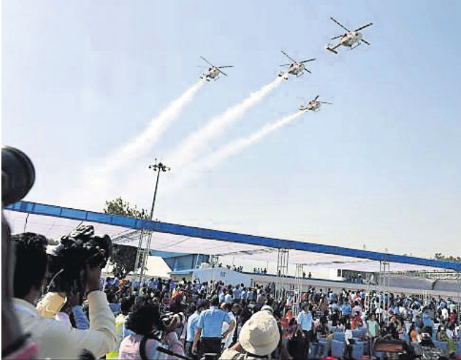
୮୮ତମ ଭାରତୀୟ ବାୟୁସେନା ଦିବସ ପୂର୍ବରୁ ମଙ୍ଗଳବାର ଗାଜିଆବାଦର ହିନ୍ଦୀ ଏୟାରବେସରେ ବାୟୁସେନା ହେଲିକପ୍ଟର ଶକ୍ତି ପ୍ରଦର୍ଶନ କରିବା ସହ ରିହସ୍ୟାଳ କରୁଛନ୍ତି ।