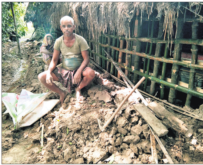
ଭୁବନେଶ୍ୱରରେ ହତ୍ୟା ହେଉଥିବା ସ୍ଥାନର ଚିତ୍ର।

ରାଜ୍ୟକୁ ବହୁ କ୍ଷତି ସହିବାକୁ ପଡ଼ିଛି। ରାଜ୍ୟର ୪ଟି ସ୍ଥାନରେ ସୌର ପ୍ରକଳ୍ପ ସ୍ଥାପନ କରିବାକୁ କେନ୍ଦ୍ର ସରକାର ୩୮.୧୦ କୋଟି ପ୍ରଦାନ କରିଥିଲେ।