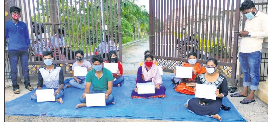
ଧାମରାରେ ବସିଥିବା ଛାତ୍ରାଛାତ୍ରୀ।

କେନ୍ଦ୍ର ନିର୍ଦ୍ଦେଶ, ଧାମରା, ଚୁଡ଼ାମଣି ଓ ପଂଚୁଟିଆ ମାଛପରା ଜେଟି ଉନ୍ନତ, ଶୋଷ୍ଟ କେନାଲ ମଞ୍ଜର ନଦୀ ଖନନ ସହ ପୁନରୁଦ୍ଧାର, ଆଭ୍ୟନ୍ତରୀଣ ନଦୀ ଜଳପଥ ପରିବହନ ସୁବିଧା, ଗନ୍ଧବଳି, ଧାମରା, ଆରଡ଼ି, ପଂଚୁଟିଆ ବାହୁଣ୍ଡା ଘାଟ ଏବଂ ମୋହନପୁର ଆଡ଼ିଆଠାରେ ପର୍ଯ୍ୟଟନସ୍ଥଳୀ ଭିତ୍ତିକ ବିକାଶ ସହ ବହୁ ପ୍ରତିଷ୍ଠାତ ଚୁଡ଼ାମଣିଠାରେ ନୂତନ ବନ୍ଦର ପ୍ରତିଷ୍ଠା ପାଇଁ ପ୍ରସ୍ତାବ ଦେଇଥିଲେ।