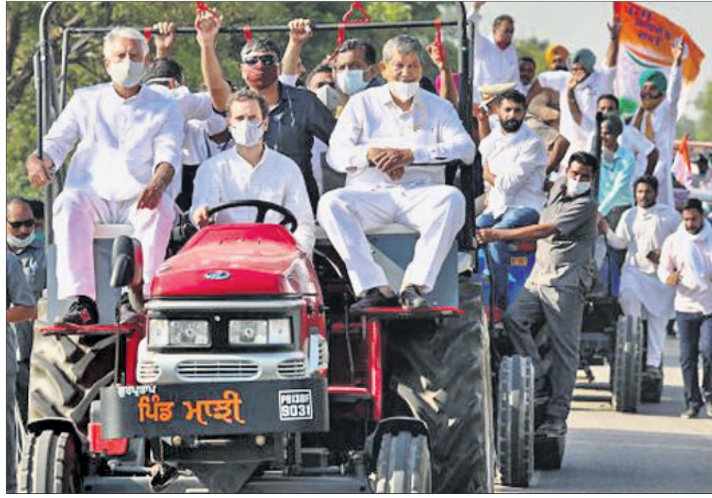
କୃଷି ବିଲକୁ ବିରୋଧ କରି ପଟିଆଲାରେ ଅନୁଷ୍ଠିତ ‘କ୍ଷେତି ବତାଓ’ ଆନ୍ଦୋଳନ ବେଳେ କଂଗ୍ରେସ ନେତା ରାହୁଲ ଗାନ୍ଧୀ ଗ୍ରାହ୍ୟ ଚଳାଇଛନ୍ତି ।

ବିଚାର କରିବ ବୋଲି ସିଜେଆଇ କହିଥିଲେ । ଏଥିସହ ଘଟଣାର ଉଚିତ ତଦନ୍ତ ହେବ ବୋଲି କୋର୍ଟ ଆବେଦନକାରୀଙ୍କୁ ପ୍ରତିଶ୍ରୁତି ଦେଇଛନ୍ତି । ଅନ୍ୟପକ୍ଷରେ ଭଉରପ୍ରଦେଶ ସରକାର ସତ୍ୟପାଠ ମାଧ୍ୟମରେ କହିଛନ୍ତି, ହିଂସାକାଣ୍ଡକୁ ରୋକିବା ଲାଗି ପାଠିତାଙ୍କ ମରଣରୀରକୁ ଅଧରାତିରେ ପୋଡ଼ିଦିଆଯାଇଥିଲା । ବାକି ମସଜିଦ୍ ରାୟ ପରଦିନ ଆଇନଶୁଣ୍ଠୀ ପରିସ୍ଥିତି ଦେଖାଦେବ ବୋଲି ଗୋଇନ୍ଦା ସୂଚନା ମିଳିଥିଲା । ଦଣ୍ଡାକୁ ଏଡ଼ାଇବା ଲାଗି ଜିଲାବ୍ୟାପୀ ହାଇଆଲର୍ଟ ଜାରି କରାଯାଇଥିଲା ବୋଲି ରାଜ୍ୟ ସରକାର କହିଛନ୍ତି । ପ୍ରକାଶପାତ୍ର କି, ହାଥୁରସ ଘଟଣାକୁ ନେଇ ବିରୋଧୀ ଦଳଗୁଡ଼ିକ ପକ୍ଷରୁ ସରକାରଙ୍କ ବିରୋଧରେ ବିରୋଧ ଜାରି ରହିଥିବାବେଳେ ଦ୍ଵିତୀୟ ନ୍ୟାୟ ଲାଗି ଦାବି କରାଯାଇଛି ।