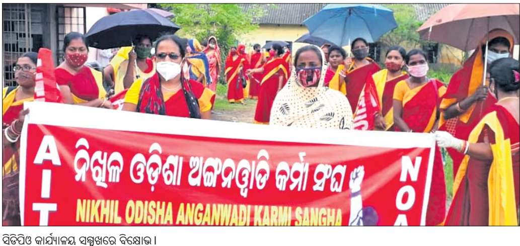
ସିପିଓ କାର୍ଯ୍ୟକ୍ରମ ସମ୍ବନ୍ଧରେ ବିରୋଧ।

ଓପିପି ବାଲେଶ୍ୱର ଜିଲ୍ଲା ଓପିପି ସଂଗଠନରେ ଅନଶନ ଜାରି କରାଯାଇଛି।