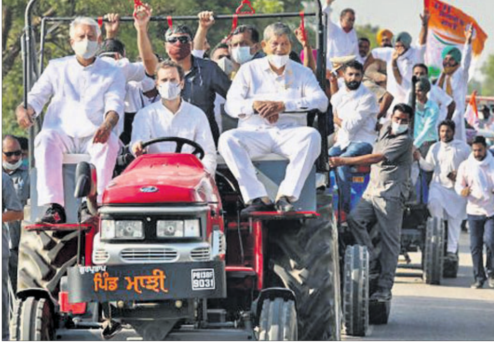
କୃଷି ବିଲୁକୁ ବିରୋଧ କରି ପଟିଆଲାରେ ଅନୁଷ୍ଠିତ 'କ୍ଷେତ ବଚାଓ' ଆନ୍ଦୋଳନ ବେଳେ କଂଗ୍ରେସ ନେତା ରାହୁଲ ଗାନ୍ଧୀ ଗ୍ରାହ୍ୟ ଚଳାଇଛନ୍ତି ।

ବିଚାର କରିବ ବୋଲି ସିଜେଆଇ କହିଥିଲେ । ଏଥିସହ ଘଟଣାର ଉଚିତ ତଦନ୍ତ ହେବ ବୋଲି କୋର୍ଟ ଆବେଦନକାରୀଙ୍କୁ ପ୍ରତିଶ୍ରୁତି ଦେଇଛନ୍ତି ।