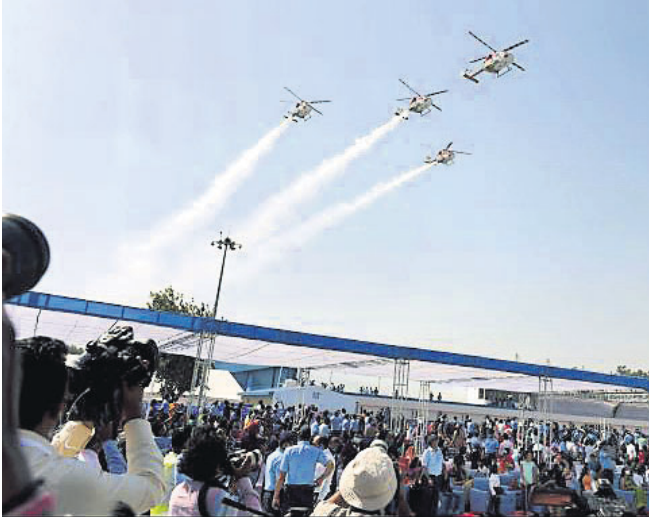
୮୮ତମ ଭାରତୀୟ ବାୟୁସେନା ଦିବସ ପୂର୍ବରୁ ମଙ୍ଗଳବାର ଗାନ୍ଧିଆବାଦର ହିନ୍ଦୀ ଏୟାରବେସ୍‌ରେ ବାୟୁସେନା ହେଲିକପ୍ଟର ଶକ୍ତି ପ୍ରଦର୍ଶନ କରିବା ସହ ରିହସ୍ୟାଳ କରୁଛନ୍ତି ।

କମ୍ପୁର, ୬।୧୦: ୨୦୧୯ ଅଲମ୍ପିକ ଗଣବଳୀକାର ମାମଲାରେ ସ୍ଥାନୀୟ କୋର୍ଟ ପକ୍ଷରୁ ୪ ଅଭିଯୁକ୍ତଙ୍କୁ ଗୋଷ୍ଠୀବାସ୍ୟପ୍ର କରାଯିବା ସହ ଆଜୀବନ କାରାଦଣ୍ଡରେ ଦଣ୍ଡିତ କରାଯାଇଛି ।