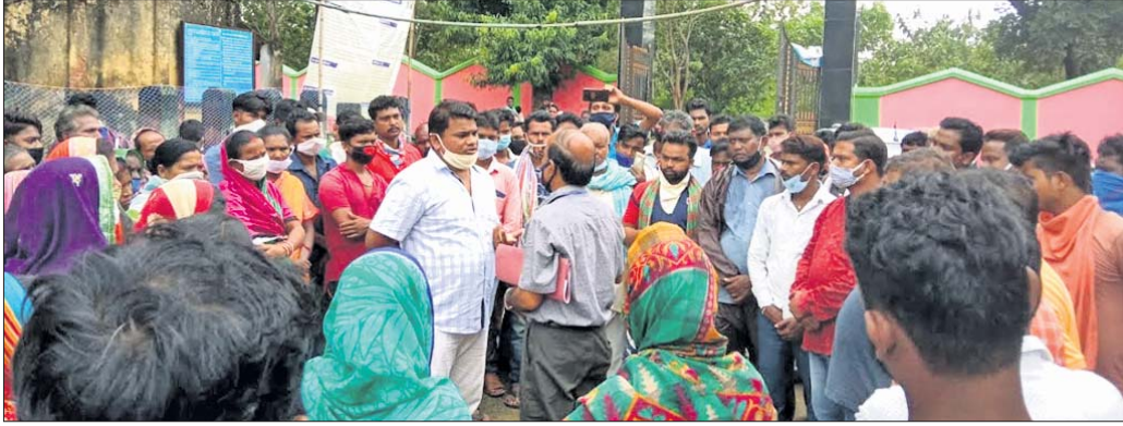
ଗ୍ରାମବାସୀ ଅଧିକାଂଶକ ସହ ଆଲୋଚନା କରୁଛନ୍ତି।

କେନ୍ଦ୍ର ସରକାରଙ୍କ ପକ୍ଷରୁ ଘୋଷଣା କରାଯାଇଥିବା ଉନ୍ନୟନ ପୂର୍ଣ୍ଣକାର୍ଯ୍ୟ ଆରମ୍ଭରେ ବିଳମ୍ବରୁ ନେଇ ଘୋଷଣା କରାଯାଇଥିବା ଶତାଧିକ ଗ୍ରାମବାସୀଙ୍କୁ ନିରାଶ କରିଛି।