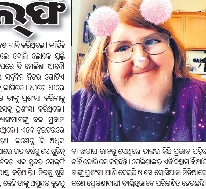
ବା ଖରାପ ଭାବରୁ ସେଥିରେ ତାଙ୍କର କିଛି ପ୍ରଭାବ ପଡ଼ିବ ନାହିଁ ବୋଲି ସେ କହିଛନ୍ତି ।

ବ୍ୟାନ୍ କରିବା ପାଇଁ ମଧ୍ୟ କେତେଜଣ ଦାବି କରିଥିଲେ । କାହିଁକି ନା ମେଲିଶା ବହୁତ ଅସୁବିଧା ଥିଲେ ବୋଲି ଲୋକେ ମୁକ୍ତି କରିଥିଲେ ।