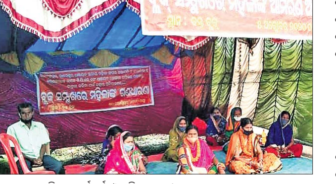
ଅନଶନରେ ବସିଥିବା କର୍ମକର୍ତ୍ତା ଓ ମହିଳାମାନେ।

କଠକା କଳା ବନ୍ଧୁ ସଂଘରେ ଅନଶନ ଜାରି କରାଯାଇଛି।