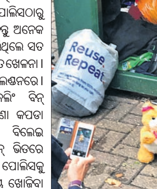
ପରେ ବିଲେଇଟିକୁ ଉଦ୍ଧାର କରିବାକୁ ସମ୍ପର୍କ ହୋଇ ପାରି ନ ଥିଲା । ତେଣୁ ଫାୟାରବ୍ରୁଗେଡ୍ ବା ଅଗ୍ନିଶମ କର୍ମଚାରୀଙ୍କୁ ବି ଏହି କାମ ନିମନ୍ତେ ଡକା ଯାଇଥିଲା ।

ନୂଆଦିଲ୍ଲୀ: ପୁନର୍ବିନିଯୋଗ ବାବୁ ଭିତରେ ଫଣି ରହିଥିବା ଏକ ବିଲେଇକୁ ଉଦ୍ଧାର କରିବା ପାଇଁ ଏକ ସମୟରେ ପୋଲିସଠାରୁ ଆରମ୍ଭ କରି ଅଗ୍ନିଶମ କର୍ମଚାରୀ ବି ସହଯୁକ୍ତ ।