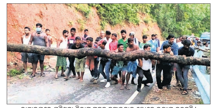
ରାସ୍ତାଉପରେ ପଡ଼ିଥିବା ବିରାଟ ଗଛକୁ ହଟାଇବାକୁ ଲୋକେ ଉଦ୍ୟମ କରୁଛନ୍ତି।