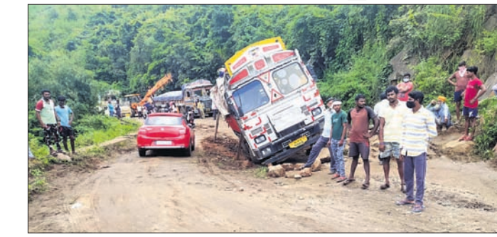
୨୬୯୦ ଜଣଙ୍କୁ ରାଜପଥରେ ଅଟକି ରହିଥିବା ଗାଡ଼ି।