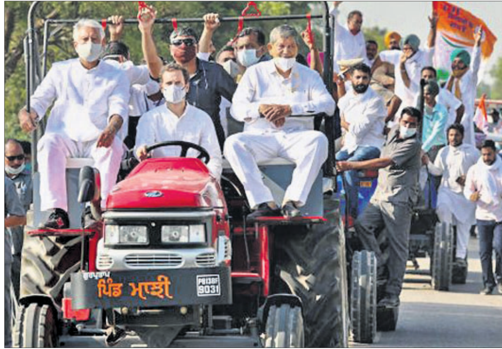
କୃଷି ବିଲକୁ ବିରୋଧ କରି ପଟିଆଲାରେ ଅନୁଷ୍ଠିତ ‘କ୍ଷେତି ବତାଓ’ ଆନ୍ଦୋଳନ ବେଳେ କଂଗ୍ରେସ ନେତା ରାହୁଲ ଗାନ୍ଧୀ ଗ୍ରାହ୍ୟ ଚଳାଇଛନ୍ତି ।

ବିଚାର କରିବ ବୋଲି ସିଜେଆଇ କହିଥିଲେ । ଏଥିସହ ଘଟଣାର ଉଚିତ ତଦନ୍ତ ହେବ ବୋଲି କୋର୍ଟ ଆବେଦନକାରୀଙ୍କୁ ପ୍ରତିଶ୍ରୁତି ଦେଇଛନ୍ତି । ଅନ୍ୟପକ୍ଷରେ ଭଉରପ୍ରଦେଶ ସରକାର ସତ୍ୟପାଠ ମାଧ୍ୟମରେ କହିଛନ୍ତି, ହିଂସାକାଣ୍ଡକୁ ରୋକିବା ଲାଗି ପାଠିତାଙ୍କ ମରଣରୀରକୁ ଅଧରାତିରେ ପୋଡ଼ିଦିଆଯାଇଥିଲା । ବାକି ମସଜିଦ୍ ରାୟ ପରଦିନ ଆଇନଶୁଖିଲା ପରିସ୍ଥିତି ଦେଖାଦେବ ବୋଲି ଗୋଇନ୍ଦା ସୂଚନା ମିଳିଥିଲା । ଦଣ୍ଡାକୁ ଏଡ଼ାଇବା ଲାଗି ଜିଲାବ୍ୟାପୀ ହାଇଆଲର୍ଟ ଜାରି କରାଯାଇଥିଲା ବୋଲି ରାଜ୍ୟ ସରକାର କହିଛନ୍ତି । ପ୍ରକାଶପାତ୍ର କି, ହାଥୁରସ ଘଟଣାକୁ ନେଇ ବିରୋଧୀ ଦଳଗୁଡ଼ିକ ପକ୍ଷରୁ ସରକାରଙ୍କ ବିରୋଧରେ ବିରୋଧ ଜାରି ରହିଥିବାବେଳେ ଦ୍ଵିତୀୟ ନ୍ୟାୟ ଲାଗି ଦାବି କରାଯାଇଛି ।