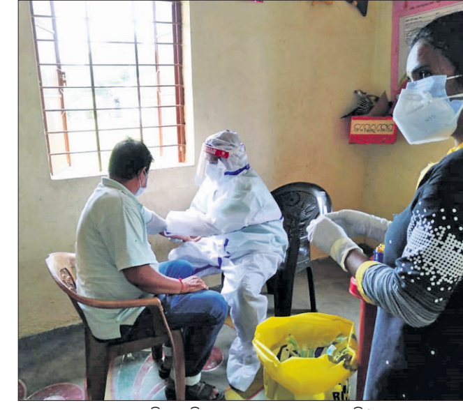
ମେଡିକାଲ ଟିମ୍ ରକ୍ତ ନମୁନା ସଂଗ୍ରହ କରୁଛନ୍ତି।