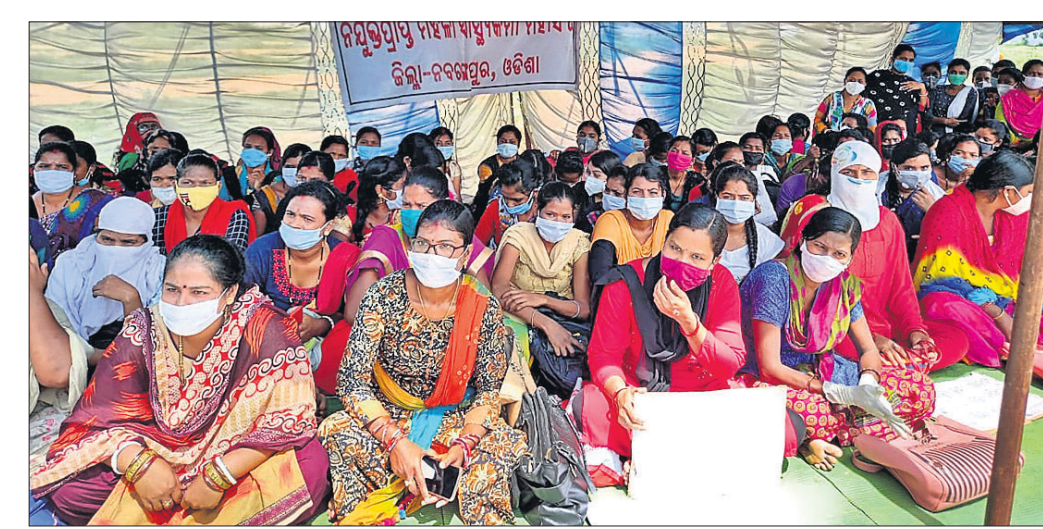
ଧାରଣାରେ ସାମିଲ ହୋଇଥିବା ସ୍ୱାସ୍ଥ୍ୟକର୍ମୀମାନେ।