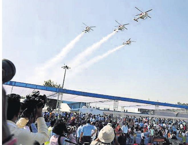
୮୮ତମ ଭାରତୀୟ ବାୟୁସେନା ଦିବସ ପୂର୍ବରୁ ମଙ୍ଗଳବାର ଗାଜିଆବାଦର ହିନ୍ଦୀ ଏୟାରବେସରେ ବାୟୁସେନା ହେଲିକପ୍ଟର ଶକ୍ତି ପ୍ରଦର୍ଶନ କରିବା ସହ ରିହସ୍ୟାଳ କରୁଛନ୍ତି ।