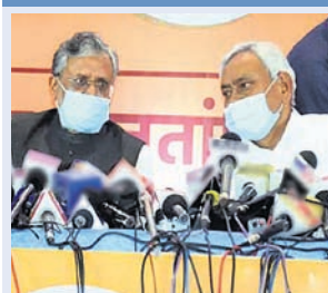
କେଡିମୁ-ଏଲ୍‌ଜେପି ସହ କୌଣସି ଭିତ୍ତିରୁ ବୁଝାମଣା ହେବନି

ପାଟଣା, ୬।୧୦ ବିହାର ବିଧାନସଭା ନିର୍ବାଚନ ପୂର୍ବରୁ ଏନ୍ଡିଏରେ ଦେଖାଦେଇଥିବା ଫାଟ କ୍ରମଶଃ ମଜିନ ପଡ଼ିଯାଇଛି । ତିରାଜ ପାଖାନ୍ତ ଲୋକ ଜନଶକ୍ତି ପାର୍ଟି(ଏଲ୍‌ଜେପି) କେଡିମୁକୁ ବିରୋଧ କରିବ ଓ ଏନ୍ଡିଏ ସହ ରହିବ ବୋଲି କହି ବୃନ୍ଦ ସୃଷ୍ଟି କରିଥିବାବେଳେ ଭାଙ୍ଗିପା ଅକଳରେ ପଡ଼ିଥିଲା । ଏବେ ଏହା ଦୂର ହୋଇଛି । ପ୍ରଦେଶ ଭାଙ୍ଗିପା ମୁଖ୍ୟ ସଞ୍ଜୟ ଜିଶିଠାଲ ପକ୍ଷରୁ ନିଜର ନୀତିଗତ ସ୍ଵପ୍ନ କରାଯିବା ସହ ଏଲ୍‌ଜେପି ସହ କୌଣସି ଭିତ୍ତିରୁ ବୁଝାମଣା କରାଯିବ ବୋଲି ମଙ୍ଗଳବାର ସ୍ଵପ୍ନ କରିଛି । ଏଥିସହ ପାଳନ କରିବା ଲାଗି କୁହାଯାଇଛି ।