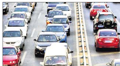
ଟ୍ରାକ୍ଟର ଫେରୁଛି ଅଟୋମୋବାଇଲ୍ ବଜାର

କରୋନା ପାଇଁ ରାଜ୍ୟର ଅଟୋମୋବାଇଲ୍ ବଜାରରେ ବିକ୍ରି ହ୍ରାସ ଧାରା ଲାଗି ରହିଛି।