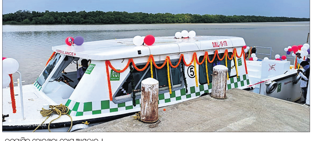
ଉଦ୍‌ଘାଟିତ ହୋଇଥିବା ବୋର୍ଡ୍ ଆୟୁଲାର୍ ।

ରାଜନଗର, ୮।୧୦(ଡି.ଏନ୍.ଏ.) କେନ୍ଦ୍ରପଡ଼ା ଜିଲାର ରାଜନଗର ବୁଦ୍ଧ ଉପକରଣ ଆଞ୍ଚଳିକ ବୋର୍ଡ୍ ପାଇଁ ଗୁରୁବାରକୁ ଜଳପଥରେ ବୋର୍ଡ୍ ଆୟୁଲାର୍ ସେବା ଆରମ୍ଭ ହୋଇଛି।