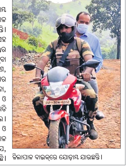
ଜିଲ୍ଲାପାଳ ବାଇକ୍ରେ ଯୋଡ଼ାମ୍ବ ଯାଉଛନ୍ତି ।