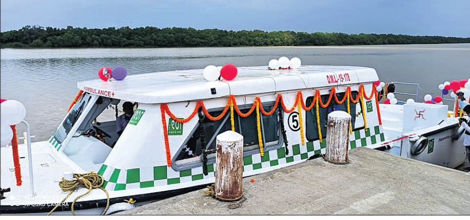
ଉଦ୍‌ଘାଟିତ ହୋଇଥିବା ବୋର୍ଡ୍ ଆୟୁଲ୍ଲାସ୍ ।

ରାଜନଗର, ୮୧୦(ଡି.ଏନ୍.ଏ.) କେନ୍ଦ୍ରାପଡ଼ା ଜିଲ୍ଲା ରାଜନଗର ବ୍ଲକ୍ ଉପତ୍ୟକା ଅଞ୍ଚଳରେ ବୋର୍ଡ୍ ଆୟୁଲ୍ଲାସ୍ ସେବା ଆରମ୍ଭ ହୋଇଛି।