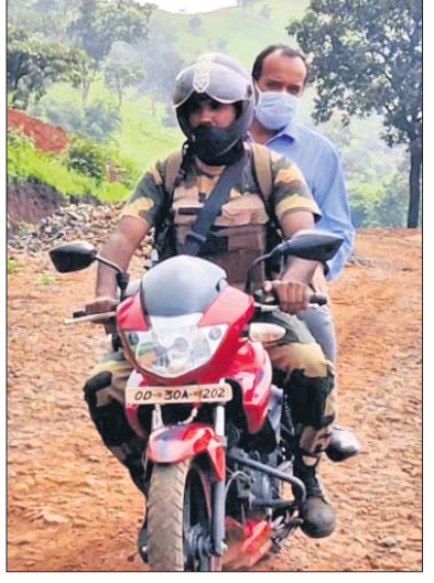
ଜିଲ୍ଲାପାଳ ବାଇକ୍ରେ ଯୋଡ଼ାୟ ଯାଉଛନ୍ତି ।