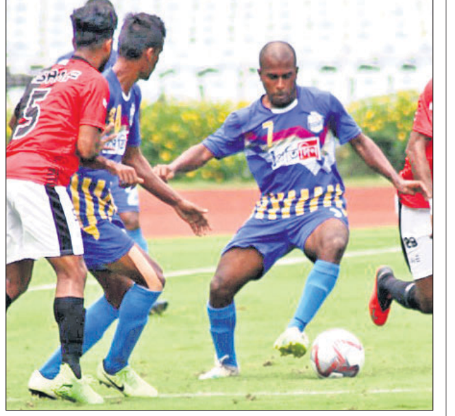
ବେଙ୍ଗାଲୁରୁ ସୁନାଲଚେତ ଓ ଭବାନୀପୁର ଏଫ୍ସି ମଧ୍ୟରେ ଅନୁଷ୍ଠିତ ମ୍ୟାଚ୍ରେ ଏକ ସଂଘର୍ଷପୂର୍ଣ୍ଣ ମୁହୂର୍ତ୍ତ।

କୋଲକାତା, ୮।୧୦ (ପି.ଟି.) ଆଇ-ଲିଗ୍ କ୍ୱାଲିଫାୟର୍ସ କରୋନା ଯୋଗୁ ଦେଶରେ ୭ ମାସ ହେବ କ୍ରୀଡ଼ା କାର୍ଯ୍ୟକଳାପ ସ୍ଥାଗ୍ନ ହୋଇଯାଇଥିଲା। ରୁକୁନାଚାରୁ ଆରମ୍ଭ ହୋଇଛି ଫୁଟ୍ବଲ ପ୍ରତିଯୋଗିତା। ବିନା ଦର୍ଶକରେ ଅନୁଷ୍ଠିତ ଆଇ-ଲିଗ୍ କ୍ୱାଲିଫାୟର୍ସ ଓପିନିଂ ମ୍ୟାଚ୍ରେ ସହରର ଅନ୍ୟତମ କ୍ଲବ ଭବାନୀପୁର ଏଫ୍ସି ୨-୦ ବେଙ୍ଗାଲୁରୁ ସୁନାଲଚେତକୁ ହରାଇ ଦେଇଛି। ସଲ୍ଲୁଲେକ୍ ଷ୍ଟାଡିୟମରେ ଖେଳାଳିମାନଙ୍କ ଲାଗି ସାମାଜିକ ଦୂରତା ରଖିବାକୁ ଚେନେଲର ବ୍ୟବସ୍ଥା କରାଯାଇଥିଲା। ସାମାଜିକ ଦୂରତା, ବନ୍ଦା, ଉପରେ ଧ୍ୟାନ ଦିଆଯାଇଥିଲା। ମାର୍ଚ୍ଚ ୧୨ରେ ଇଣ୍ଡିଆନ ପ୍ରିମିୟର ଲିଗ୍ ପାଇନାଲ ପରେ ଫୁଟ୍ବଲ ରୁନାମେଣ୍ଟ ବନ୍ଦ ରହିଥିଲା। ୫ଟି ଦଳକୁ ନେଇ ଆଇ-ଲିଗ୍ କ୍ୱାଲିଫାୟର୍ସ ରାଉଣ୍ଡ ରବିନ ଭିତରେ