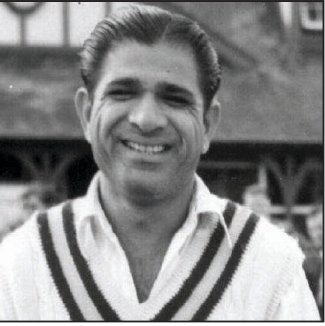
କିମ୍ବଦନ୍ତୀ ଭାରତୀୟ ଅଲରାଉଣ୍ଡର ଭିନ୍ନ ମଲଟିଟାଲ କରିବାର ସୁଯୋଗ ପାଇଥିଲେ। ତେବେ ସେ ଫିନ୍ଲ୍ୟାନ୍ ଆଉଟ ନ କରି ଚେତାବନୀ ଦେଇ ଛାଡି ଦେଇଥିଲେ। ଫଳରେ ମଲଟିଟାଲ ପୁଣି ଥରେ

(ଆଇପିଏଲ୍)ରେ ପୁଣି ଥରେ ମଲଟିଟାଲ ନେଇ ଆଲୋଚନା ଆରମ୍ଭ ହୋଇଛି। ଆଇପିଏଲ୍ରେ ଏକ ମ୍ୟାଚ୍ରେ ରୟାଲ ବ୍ୟାଲେଉଟ୍ସ ବାଙ୍ଗାଲୋର ବ୍ୟାଟ୍ସମ୍ୟାନ ଆରୋନ ଫିନ୍ଲ୍ୟାନ୍ ଦିଲ୍ଲୀ କ୍ୟାପିଟାଲ୍ସ ସ୍କିନର ରବିଚନ୍ଦ୍ରନ ଅଶ୍ୱିନ ମଲଟିଟାଲ ଦ୍ୱାରା