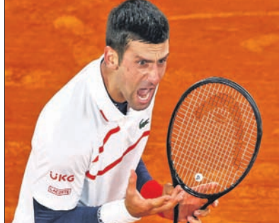
ମ୍ୟାଚ୍ ଚିତ୍ତବା ପରେ ନୋଭାକ୍ ଜୋକୋଭିଚ୍।

ସୁଏସ ଓପନର ରିମ୍ୟାଚ୍ ଥିଲା। ସେତେବେଳେ ଅକାଶରେ ଜଣେ ଲାଇଟ୍‌ହାଉସ୍ ବଲ୍ରେ ଆୟାତ ଦେଇଥିବାକୁ ଜୋକୋଭିଚ୍ଙ୍କୁ ଅଧିକ ମ୍ୟାଚ୍ ଛାଡ଼ିବାକୁ ପଡ଼ିଥିଲା। ତେବେ ତାହା ଏବେ ଅତୀତ ହୋଇ ଯାଇଛି। ଇତିମଧ୍ୟରେ ସେ ଖେଳିଥିବା ୧୦ଟି ଯାକ ମ୍ୟାଚ୍ରେ ବିଜୟ ହାସଲ କରିଛନ୍ତି। ଏହାକୁ ନିଶ୍ଚଳ ଜୋକୋଭିଚ୍ ୧୦ମ ଥରପାଇଁ ଫ୍ରେଞ୍ଚ୍ ଓପନ ସେମିଫରେ ପ୍ରବେଶ କରିଛନ୍ତି। ସେମିଫାଇନାଲରେ ସେ ୫ମ ସିଡ୍ ସ୍ଵିଟୋସୋସ ସିଡ୍‌ସିପାଙ୍କୁ ଭେଟିବେ। କ୍ଵାର୍ଟର ଫାଇନାଲରେ ସିଡ୍‌ସିପା ୬-୫, ୬-୨, ୬-୩ ସେଟ୍ରେ ୧୩ତମ ସିଡ୍ ଆସେ ଚଳିତ ଓପନରୁ ପରାସ୍ତ କରିଥିଲେ। ସିଡ୍‌ସିପାଙ୍କ ପାଇଁ ଏହା ପ୍ରଥମ ଫ୍ରେଞ୍ଚ୍ ଓପନ ସେମିଫାଇନାଲ ପ୍ରବେଶ। ଅନ୍ୟ ସେମିଫରେ ରାଫାଲ ନାଡାଲ ଓ ଡିଏଗୋ ସ୍ଵାର୍ଟଜମାନଙ୍କ ମଧ୍ୟରେ ମୁକାବିଲା ହେବ। ସ୍ଵାର୍ଟଜମାନ ପୂର୍ବରୁ ବଡ଼ ପ୍ରତିଯୋଗିତାର ସେମିଫାଇନାଲ ଖେଳିବା ଅଭିଳାଷ ରଖି ନ ଥିବାବେଳେ ନାଡାଲ କ୍ୟାରିୟରରେ ୧୩ତମ ଫ୍ରେଞ୍ଚ୍ ଓପନ ଚାଲଚଳ ଚିତ୍ତବା ଲକ୍ଷ୍ୟରେ ଅଛନ୍ତି।