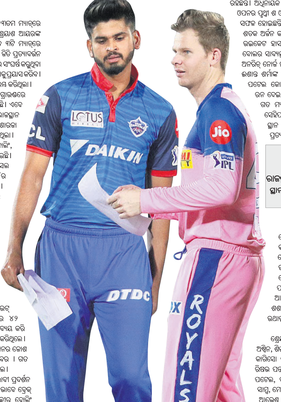
ଶ୍ରେୟାସ ଆୟର ଓ ଷ୍ଟିଭ୍ ସ୍ମିଥ।

ରହିଛନ୍ତି। ଅଧିନାୟକ ଆୟର ଭଲ ଫର୍ମରେ ରହିଛନ୍ତି। ସେହିପରି ଓପନର ପୃଥ୍ୱୀ ଶ ଓ ରିଷଭ ପଟ୍ଟ ମଧ୍ୟ ନିଜ ଦାୟିତ୍ୱ ତୁଲାଇବାରେ ସଫଳ ହୋଇଛନ୍ତି। ମାର୍କସ୍ ସ୍ଟୋକ୍ସ ମଧ୍ୟ ଦୁଇଟି ବିଶ୍ୱାସନୀୟ ଶତକ ଅର୍ଜନ କରିଛନ୍ତି। ବୋଲିଂରେ କାରିଯୋ ରାବାଡ଼ା ୧୨ ଉଇକେଟ ହାସଲ କରି ଆଇପିଏଲ୍ରେ ଏପର୍ଯ୍ୟନ୍ତ ଶ୍ରେଷ୍ଠ ବୋଲର ସାବ୍ୟସ୍ତ ହୋଇଛନ୍ତି। ଦକ୍ଷିଣ ଆଫ୍ରିକା ଦୁଇ ବୋଲର ଅନରିଚ୍ ନୋର୍ଡ ମଧ୍ୟ ଆବଶ୍ୟକ ସହଯୋଗ ପ୍ରଦାନ କରିଛନ୍ତି। ଇଶାନ୍ତ ଶର୍ମାଙ୍କ ବଦଳରେ ଦଳରେ ସ୍ଥାନ ପାଇଥିବା ହର୍ଷାଣ୍ଡ ପଟେଲ କୋଲକାତା ନାଭର୍ ରାଉତର୍ସ ବିପକ୍ଷରେ ୩୪ ରନ ଦେଇ ୨ ଉଇକେଟ ଅଭିଆର କରିଥିଲେ। ତେବେ ଗତ ମ୍ୟାଚ୍ରେ ସେ ୪୩ ରନ ବ୍ୟୟ କରିଥିଲେ। ସେହିପରି ଆହତ ଅଧିନି ମିଶ୍ରାଙ୍କ ବଦଳରେ ଦଳରେ ସ୍ଥାନ ପାଇଥିବା ଅଭିଜ୍ଞ ସ୍କିନର ରବିଚନ୍ଦ୍ରନ ଅଶ୍ୱିନ ପ୍ରତ୍ୟାବର୍ତ୍ତନ କରି ଭଲ ପ୍ରଦର୍ଶନ କରିଛନ୍ତି।