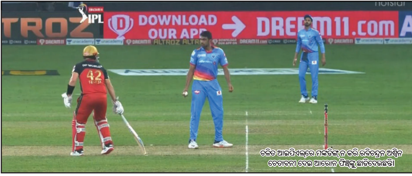
ଚଳିତ ଆଇପିଏଲ୍ରେ ମଲଟିଟାଲ କରି ରବିଚନ୍ଦ୍ରନ ଅଶ୍ୱିନ ଚେତାବନୀ ଦେଇ ଆରୋନ ଫିନ୍ଲ୍ୟାନ୍ ଛାଡିଦେଇଛନ୍ତି।

ରାଣମାଧ୍ୟମଗୁଡ଼ିକରେ ଚର୍ଚ୍ଚା ସୃଷ୍ଟି କରିଛି। ମଲଟିଟାଲ ଅର୍ଥ ପ୍ରଥମେ ମଲଟିଟାଲ ଅର୍ଥ ସମସ୍ତେ ବୁଝିବା ଆବଶ୍ୟକ। ବୋଲି କରାଯାଏ ଅବସରରେ ବଲ୍ ପକାଇବା ପୂର୍ବରୁ ନନ୍ ଷ୍ଟାଇକର ଏଣ୍ଡରେ ଯଦି ବ୍ୟାଟ୍ସମ୍ୟାନ