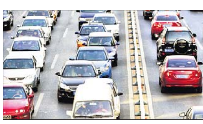
ଟ୍ରାକ୍ଟର ଫେରୁଛି ଅଟୋମୋବାଇଲ୍ ବଜାର

କରୋନା ପାଇଁ ରାଜ୍ୟର ଅଟୋମୋବାଇଲ୍ ବଜାରରେ ବିକ୍ରି ହ୍ରାସ ଧାରା ଲାଗି ରହିଛି। ବରତ ଦିନଗୁଡ଼ିକରେ ମୋଟ ଯାନ ବିକ୍ରି ରଖାଯାଇ ରହି ଆସିଛି।