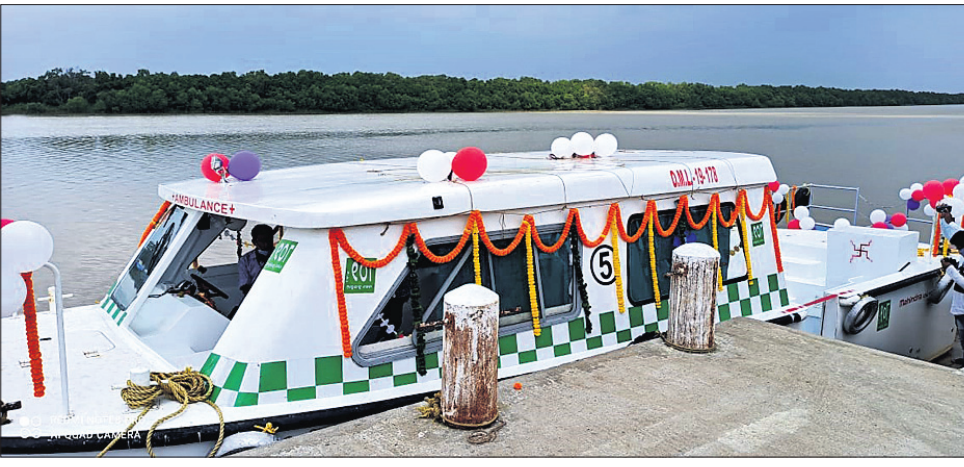
ଉଦ୍‌ଘାଟିତ ହୋଇଥିବା ବୋର୍ ଆୟୁଲାସ୍ ।

ରାଜନଗର, ୮୧୦(ଡି.ଏନ୍.ଏ.) କେନ୍ଦ୍ରପଡ଼ା ଜିଲାର ରାଜନଗର ବ୍ଲକ୍ ଉପତା ଅଞ୍ଚଳରେ ବୋର୍ ଆୟୁଲାସ୍ ସେବା ଆରମ୍ଭ ହୋଇଛି।