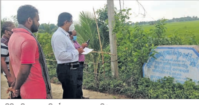
ଅତିରିକ୍ତ ଜିଲା ପ୍ରକଳ୍ପ ନିର୍ଦ୍ଦେଶକ ତଦନୁକ୍ରମେ

ଆୟୋଜିତ ହୋଇ ଆସୁଛି। ଏହାକୁ ବନ୍ଦ କରାଗଲେ ଅଗଣିତ ଶ୍ରଦ୍ଧାଳୁଙ୍କ ଭାବାବେଗ ପ୍ରତି ଆଞ୍ଚ ଆଦି ବୋଲି ସେବାୟତ ପରିଷଦ ପକ୍ଷରୁ କୁହାଯାଇଥିଲା।