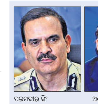
ପରମ୍ପରା ବିଂ ଶର୍ତ୍ତବ ଗୋଷାମୀ

ମୁୟାଲ, ୮୧୦ ମୁୟାଲ ପୋଲିସ ଗୁରୁବାର ଏକ ବଡ଼ଧରଣର ରାଧାକେତର ପର୍ଦ୍ଦାଫାଶ କରିଛି।