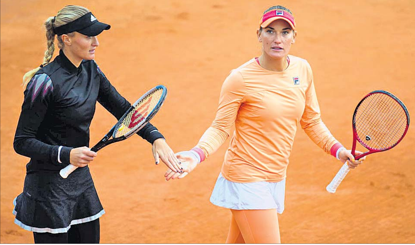
ଫ୍ରେଣ୍ଡ୍ସ୍ ଓପନ୍ ଟେନିସ୍ ମହିଳା ଡବଲ୍ ଫାଇନାଲରେ ପ୍ରବେଶ କରିବା ପରେ କ୍ରିଷ୍ଣିନା ମୁଡେନୋଭିଚ୍ ଓ ଟିମିଆ ବାବୋସା।