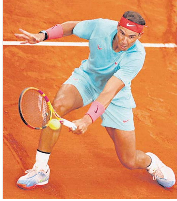
ଫ୍ରେଣ୍ଡ୍ସ୍ ଓପନ୍ ଟେନିସ୍ ପୁରୁଷ ସିଙ୍ଗଲ୍ସ ସେମିଫାଇନାଲ ମ୍ୟାଚ୍ ଅବସରରେ ଶର୍ତ୍ତ ଖେଳୁଥିବା ନାଡାଲ।

କ୍ରିଷ୍ଣିନା ମୁଡେନୋଭିଚ୍ ଓ ଟିମିଆ ବାବୋସା ଫାଇନାଲରେ ପହଞ୍ଚିଛନ୍ତି। ଏହି ଯୋଡ଼ି ପ୍ରଥମ ସେମିଫାଇନାଲରେ ବାର୍ବରା କେକିକୋଭା ଓ କାର୍ଡିନା ସିନିଆକୋଭା ଯୋଡ଼ିକୁ ୬-୨, ୪-୬, ୬-୫ ସେଟ୍ରେ ହରାଇ ଦେଇଛନ୍ତି।