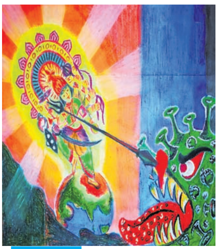
ଭାସ୍ୱତୀ ବିଶୋଇ କ୍ଲାସ-୫, କେନ୍ଦ୍ରୀୟ ବିଦ୍ୟାଳୟ ନଂ ୩, ଭୁବନେଶ୍ୱର