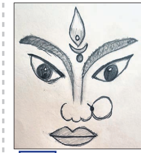
ଅଳିତା ଦାସ କ୍ଲାସ-୯, ଖୁଆର୍ଟ ସ୍କୁଲ, ଭୁବନେଶ୍ୱର