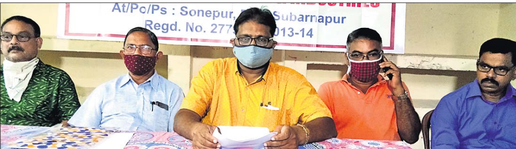
ସୁବକ୍ଷ୍ମଙ୍କୁ ଜିଲ୍ଲା ବ୍ୟବସାୟୀ ସଂଘର କର୍ମକର୍ମୀମାନେ ସୂଚନା ଦେଉଛନ୍ତି।

କିମ୍ପା ଆପଡିଜନକ ସାମଗ୍ରୀ ବିକ୍ରି କରିବେ ସେମାନେ ହିଁ ବାଣିଜ୍ୟ କର ଦେବେ। ତେଣୁ ବ୍ୟବସାୟୀମାନେ ଏ ସମ୍ପର୍କରେ ପୌର ପରିଷଦର ନିର୍ବାହୀ ଅଧିକାରୀଙ୍କ ସହ ଆଲୋଚନା କରିବା ପରେ ସେତେବେଳେ ବାଣିଜ୍ୟ କର ଆଦାୟ ସ୍ଥିତି ରହିଥିଲା। ପରବର୍ତ୍ତୀ ସମୟରେ ଓଡ଼ିଶା ସରକାର ଅଧ୍ୟାଦେଶ ୨୬।୮।୨୦୨୦ ଅନୁସାରେ ୨୯୦