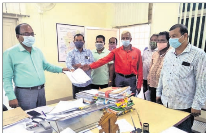
ଅତିରିକ୍ତ କିଲୋପାଳ ଦାସପତ୍ର ଗ୍ରହଣ କରୁଛନ୍ତି।

କିଲୋପାଳ ପୁଲକାଶୀରେ ଥିବା କୋଭିଡ୍ ହସ୍ପିଟାଲରେ ରୋଗୀଙ୍କୁ ଉପଯୁକ୍ତ ସେବା ମିଳୁନାହିଁ। ଅବ୍ୟବସ୍ଥା ଯୋଗୁ କୋଭିଡ୍ ଆକ୍ରାନ୍ତଙ୍କୁ ଅକାଳ ମୃତ୍ୟୁ ଘଟୁଛି।