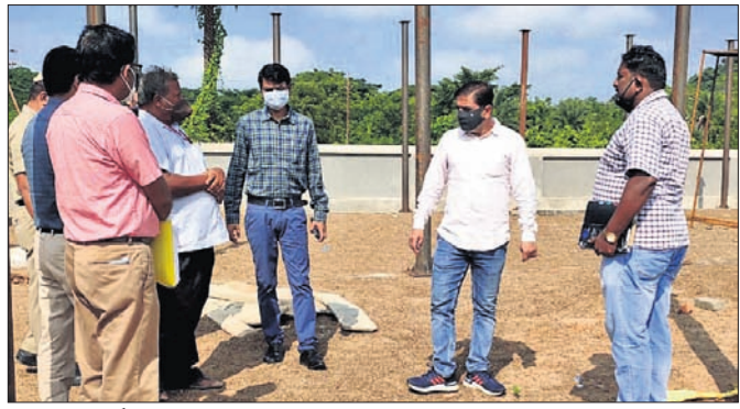
କିଲୋପାଳ ବର୍ଣ୍ଣବସ୍ତୁ ପରିବାରକା ମାଧ୍ୟମରେ କୁଳି ଦେଖିଛନ୍ତି।

ପରିବାରକୁ ଅଭିଯାନ ପାଇଁ କାଗା ଡିସ୍କ କରି କୁହ ନିର୍ମାଣ ପାଇଁ କାର୍ଯ୍ୟାଦେଶ ମଧ୍ୟ ଦିଆଯାଇଥିଲା।