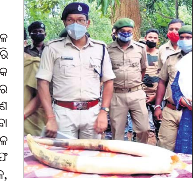
ଅଭିଯୁକ୍ତମାନେ କାଟି ନେଇଥିବା ଦୁଇଟି ହାତୀ ଦାନ୍ତ ଜବତ କରାଯାଇଛି। ଉଦ୍ଧେଶ୍ୟରେ ଜଙ୍ଗଲରେ ବିଦ୍ୟୁତ୍ ତାର ବିଛାୟା ହେବା ପରେ ପଶୁ ଆସିଥିବା ଉକ୍ତ ଦନ୍ତା ହାତୀ ସେହି ବିଦ୍ୟୁତ୍ ତାର ସଂସ୍ପର୍ଶରେ ଆସି ଘଟଣାସ୍ଥଳରେ ପ୍ରାଣ ହରାଇଥିଲା।