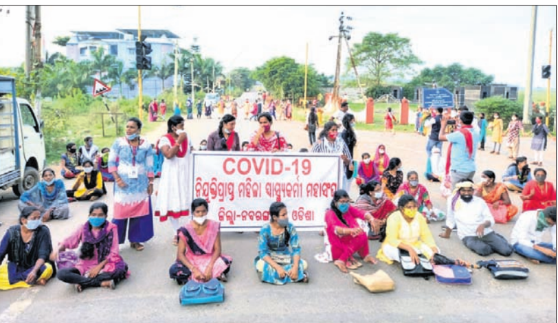
ଆଶାକର୍ମୀମାନେ ରାସ୍ତାବନ୍ଦୀ କରି ବସିଛନ୍ତି ।

ପୁନଃ ନିଯୁକ୍ତି ଦାବିରେ ସ୍ୱାସ୍ଥ୍ୟକର୍ମୀଙ୍କ ରାଜପଥ ଅବରୋଧ