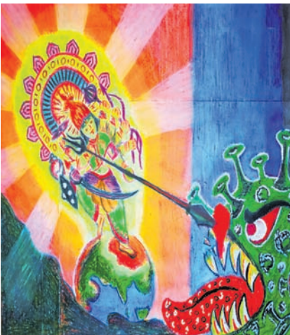
ଭାସ୍ୱତୀ ବିଶୋଇ କ୍ଲାସ-୫, କେନ୍ଦ୍ରୀୟ ବିଦ୍ୟାଳୟ ନଂ ୩, ଭୁବନେଶ୍ୱର