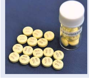
୧୧୨୦ରୁ ବୃଦ୍ଧି କରାଯାଇଛି। ଏନେଇ ଓଡ଼ିଶା ଡ୍ରଗ୍ସ କମିଶନ ନିର୍ଦ୍ଦେଶାଳକ

ପକ୍ଷରୁ ସୂଚନା ଦିଆଯିବା ସହ ନୂଆ ନିର୍ଦ୍ଦେଶନା ମଧ୍ୟ ଜାରି ହୋଇଛି। ତେବେ କେଉଁ ସ୍ଥାନରେ କେତେ ସଂଖ୍ୟକ ଔଷଧ ଦୋକାନରେ ଏହା ଉପଲବ୍ଧ ହେବ ତାହା ନିର୍ଦ୍ଦେଶାଳକ ପକ୍ଷରୁ ଧାର୍ଯ୍ୟ କରାଯାଇଛି। ଭୁବନେଶ୍ୱର, କଟକ, ବ୍ରହ୍ମପୁର, ସମ୍ବଲପୁର ଓ ରାଉରକେଲା ମହାନଗର ନିଗମ ଅଞ୍ଚଳରେ ଅତି ବେଶିରେ ୪୦ଟି ଲେଖାଏଁ ଔଷଧ ଦୋକାନରେ ଫାବିଫିରାଭିର ଉପଲବ୍ଧ ହେବ। ସେହିପରି ଅନୁଗୋଳ, ମୟୂରଭଞ୍ଜ ଓ ସମ୍ବଲପୁର ଜିଲ୍ଲାର ସର୍ବାଧିକ ୬୦ଟି ଲେଖାଏଁ ଦୋକାନରେ ଏହି ଔଷଧ ବିକ୍ରି ପାଇଁ ଅନୁମତି ମିଳିଥିବାବେଳେ ସୂରସର, ବଲାଙ୍ଗୀର ଓ ଜେଜିନାଳରେ ୫୦ ଲେଖାଏଁ, ବାଲେଶ୍ୱର, କଳାହାଣ୍ଡି