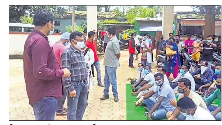
ଜିଲ୍ଲାପାଳଙ୍କ କାର୍ଯ୍ୟାଳୟ ସମ୍ମୁଖରେ ଚାଲିଥିବା ଧାରଣା ।

ନବରଙ୍ଗପୁର ଜିଲ୍ଲା ରାଜପୁର ବ୍ଲକ୍ ସଦର ପ୍ରାଥମିକ ସ୍ୱାସ୍ଥ୍ୟକେନ୍ଦ୍ରରେ ଦୀର୍ଘ ଦିନ ଧରି ଡାକ୍ତରଙ୍କ ଅଭାବ ରହିଛି । ଏ ନେଇ ବାରମ୍ବାର ଅଭିଯୋଗ ପରେ ମଧ୍ୟ ପ୍ରଶାସନ ପକ୍ଷରୁ କୌଣସି ପଦକ୍ଷେପ ନିଆଯାଇନାହିଁ ।