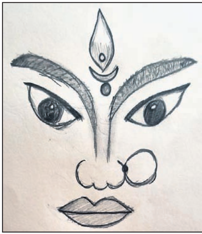
ଅଳିତା ଦାସ କ୍ଲାସ-୯, ଖୁଆର୍ଟ ସ୍କୁଲ, ଭୁବନେଶ୍ୱର