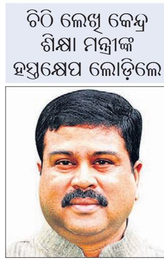
ଠିକ୍ ଲେଖି କେନ୍ଦ୍ର ଶିକ୍ଷା ମନ୍ତ୍ରୀ ଧର୍ମେନ୍ଦ୍ର ପ୍ରଧାନ

ସରକାରଙ୍କ ପ୍ରତିନିଧି ରଖିବା ସହ ଏହି ଚୟନ କମିଟିକୁ ଅଣ ବ୍ୟକ୍ତିଗତ ପୁସ୍ତକ୍ତରୀ ବ୍ୟକ୍ତି ପ୍ରାଧାନ୍ୟ ଦେଉଥିବା ଶିକ୍ଷକ ନିୟୁତ୍ତି ଅଧିକାରକୁ ବିଶ୍ୱବିଦ୍ୟାଳୟ କର୍ତ୍ତୃପକ୍ଷକୁ ସଞ୍ଚିତ କରି ଏହି କାମକୁ ଓଡ଼ିଶା ପଞ୍ଜିକ ସଭାରେ କମିଶନ (ଓପିଏସ୍‌ସ୍‌ସ୍‌)କୁ ପ୍ରଦାନ କରିବା ଦ୍ୱାରା ରାଜ୍ୟ ସରକାର ଉଦ୍ଦେଶ୍ୟ ବ୍ୟବସ୍ଥାକୁ ରିମୋଡ୍ କରୁଛନ୍ତି। ବ୍ୟବସ୍ଥାରେ ରଖିବାକୁ ଚାହୁଁଛନ୍ତି। ଏଥିସହ ବିଶ୍ୱବିଦ୍ୟାଳୟର ଆୟ ବ୍ୟୟ ବିବରଣୀ ସାମ୍ବିଧାନିକ ବ୍ୟବସ୍ଥା ରାଜ୍ୟ ବିଧାନସଭାରେ ଉପସ୍ଥାପନ କରାଯିବାର ବ୍ୟବସ୍ଥାକୁ ନୂଆ ବିଧେୟକରେ ବଦଳାଇବା ପାଇଁ ସମାକ୍ଷୀ ହୋଇପାରିବ ନାହିଁ ବୋଲି ପ୍ରଧାନ ଉଲ୍ଲେଖ କରିଛନ୍ତି। ଏଥିସହ ଭାରତୀୟ ସାମ୍ବିଧାନରେ ଶିକ୍ଷା ସ୍ତର ତାଲିକାରେ ଥିବା କାରଣରୁ ଉଚ୍ଚଶିକ୍ଷା ଓ ଗବେଷଣା ପ୍ରସଙ୍ଗରେ ଆଇନ ପ୍ରଣୟନ କରିବାର ସମ୍ପୂର୍ଣ୍ଣ ଅଧିକାର ପାଇଁ ଦେଶରେ ରହିଛି। ଯୁକ୍ତିଯୁକ୍ତ ଆଇନ-୧୯୫୬ ଓ ଯୁକ୍ତିଯୁକ୍ତ ନିୟମ ଆଧାରରେ ଓଡ଼ିଶା ବିଶ୍ୱବିଦ୍ୟାଳୟଗୁଡ଼ିକ