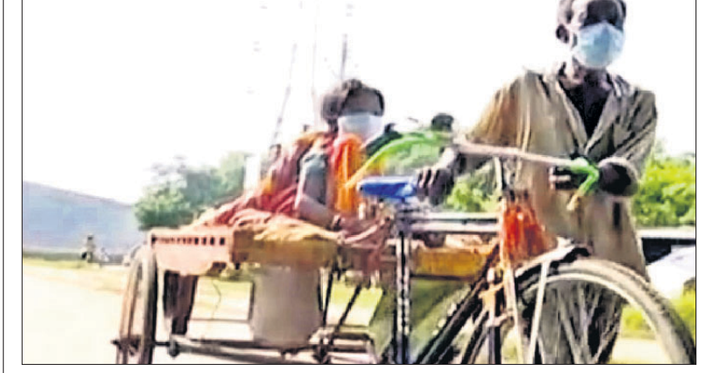
ସ୍ତ୍ରୀଙ୍କୁ ଟ୍ରଲିରେ ବୋହି ନେଉଛନ୍ତି ସ୍ତ୍ରୀମାନଙ୍କର ଭୋଜ।

ହେଲେ କିଛି ଘଟଣାକୁ ଅନୁଧ୍ୟାନ କଲେ ଏହି ସବୁ ଯୋଜନା ଫୋଲ୍ ମାରିବା ଭଳି ମନେହେଉଛି। ଅର୍ଥାଭାବରୁ ଜଣେ ବ୍ୟକ୍ତି ଅସୁସ୍ଥ ସ୍ତ୍ରୀଙ୍କୁ ଏକ ଟ୍ରଲିରେ ପୁରୀ ଜିଲା ସତ୍ୟବାଦୀ ବୁକ୍ସ ଦାଓ ଲଠି.ମି ଦୂର କଟକ ବଡ଼ ଡାକ୍ତରଖାନାକୁ ବୋହି ଆଣୁଥିବା ଦୃଶ୍ୟ ସମସ୍ତଙ୍କୁ ଚକିତ କରିଛି। କଟକ ଓ ଏମ୍‌ପି ଛକ ନିକଟରେ କେତେଜଣ ସାମାଜିକ କର୍ମୀ ଏହା ଦେଖିବା ପରେ ଅତୀତରେ ଅସୁସ୍ଥ ମହିଳାଙ୍କୁ ନେଇ କେନ୍ଦ୍ରୀୟ-୯