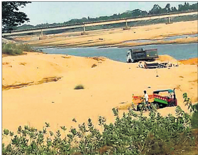
ବୈତରଣୀ ନଦୀ ଘାଟରୁ ବାଲି ଉଠାଯାଉଛି।