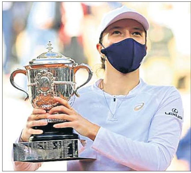
ଫ୍ରେଞ୍ଚ୍ ଓପନ ଚେମ୍ପିୟନ୍ ମହିଳା ସିଗ୍ନାଲ୍ ଟ୍ରଫି ସହ ଇଗା ସ୍ମିଥେଟ୍ ।