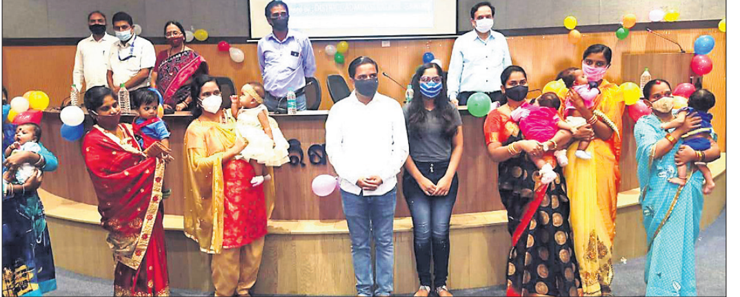
କାର୍ଯ୍ୟକ୍ରମରେ ଉପସ୍ଥିତ ଲିଙ୍ଗାପାଳ ଓ ଅନ୍ୟମାନେ ।