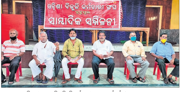
ଖବରଦାତା ସମ୍ମିଳନୀରେ ଉପସ୍ଥିତ ବିଭିନ୍ନ କର୍ମଚାରୀ ସଂଘର କର୍ମକର୍ତ୍ତା ।

ସାଉଥକୋ ଆଧାନରେ କାର୍ଯ୍ୟକାରୀ ଆଉଟସୋର୍ସିଂ କର୍ମଚାରୀଙ୍କୁ ଅଣଦେଖା କରାଯାଇଛି। ଆଉଟସୋର୍ସିଂ କର୍ମଚାରୀଙ୍କୁ ସ୍ଥାୟୀ ନିଯୁକ୍ତି ପ୍ରଦାନ ନିମନ୍ତେ ମିଳିଥିବା ପ୍ରତିଷ୍ଠିତ ରୁକ୍ଷଣୋଲ ବିଭାଗରେ ଏହା ପ୍ରତିଷ୍ଠିତ ହୋଇଛି।