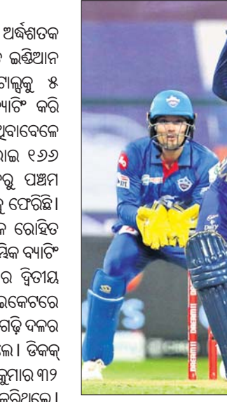
ମ୍ୟାଚ୍ ଅର୍ଦ୍ଧେ ମ୍ୟାଚ୍ କ୍ୱିଣ୍ଟନ ଡିକକ୍।

କ୍ୱିଣ୍ଟନ ଡିକକ୍ ଓ ସୂର୍ଯ୍ୟକୃମାର ଯାଦବଙ୍କ ଅର୍ଦ୍ଧଶତକ ବଳରେ ମୁମ୍ବାଇ ଇଣ୍ଡିଆନ୍ ରବିବାର ଅନୁଷ୍ଠିତ ଇଣ୍ଡିଆନ ପ୍ରିମିୟର ଲିଗ୍ ମ୍ୟାଚ୍‌ରେ ଦିଲ୍ଲୀ କ୍ୟାପିଟାଲ୍‌କୁ ୫ ଉଇକେଟରେ ପରାସ୍ତ କରିଛି। ପ୍ରଥମେ ବ୍ୟାଟିଂ କରି ଦିଲ୍ଲୀ ୪ ଉଇକେଟ ହରାଇ ୧୬୨ ରନ କରିଥିବାବେଳେ ମୁମ୍ବାଇ ୧୯୪ ଓଭରରେ ୫ ଉଇକେଟ ହରାଇ ୧୬୬ ରନ ସଂଗ୍ରହ କରି ନେଇଥିଲା। ୭ ମ୍ୟାଚ୍‌ରୁ ପଞ୍ଚମ ବିଜୟ ସହ ମୁମ୍ବାଇ ପଦ୍ମ ଟେକ୍ନିକାଲ ଶୀର୍ଷକ୍ ପୋଡ଼ିଛି। ଗର୍ଗେଟ୍ ବଡ଼ ନ ଥିଲେ ହେଁ ଅଧିନାୟକ ରୋହିତ ଶର୍ମାଙ୍କ ଉଇକେଟ ଶୀଘ୍ର ହରାଇ ମୁମ୍ବାଇ ପ୍ରାରମ୍ଭିକ ବ୍ୟାଟିଂ ବିପର୍ଯ୍ୟୟରେ ପଡ଼ିଥିଲା। ତେବେ ସୂର୍ଯ୍ୟକୃମାର ଦ୍ୱିତୀୟ ଉଇକେଟରେ ଡିକକ୍‌ଙ୍କ ସହ ୪୬ ଓ ତୃତୀୟ ଉଇକେଟରେ ଇଶାନ କିଶନଙ୍କ ସହ ୫୩ ରନର ଭାଗାଦାରି ଗଢ଼ି ଦଳର ବିଜୟରେ ଗୁରୁତ୍ୱପୂର୍ଣ୍ଣ ଭୂମିକା ନିର୍ବାହ କରିଥିଲେ। ଡିକକ୍ ୩୬ ବଲ୍‌କୁ ୫୩ (୪ ଟୋକା, ୩ ଛକା) ଓ ସୂର୍ଯ୍ୟକୃମାର ୩୨ ବଲ୍‌କୁ ୫୩ (୨ ଟୋକା, ୧ ଛକା) ରନ ଖୋର କରିଥିଲେ। ହାଡିକ ପାଣ୍ଡା ଖାତାଖୋଲିପାରି ନ ଥିବାବେଳେ କିଶନ ୨୮ (୧୫ ବଲ୍, ୨ ଟୋକା, ୨ ଛକା) ରନର ଯୋଗଦାନ ଦେଇଥିଲେ। କିଶନ ପୋଲାର୍ଡ ୧୧ ଓ କୁନାଲ ପାଣ୍ଡା ୧୨