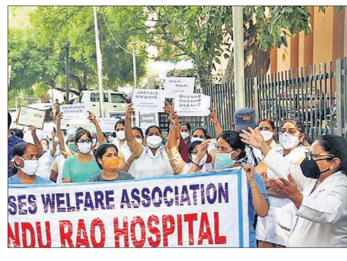
SES WELFARE ASSOCIATION NDU RAO HOSPITAL

ନୂଆଦିଲ୍ଲୀ, ୧୧।୧୦ ୪ ମାସ ହେଲା ଦରମା ନ ପାଇ କାମ କରୁଥିଲେ ୩୦୦ ନର୍ସ୍ ଷ୍ଟାଫ୍ କାମ ବନ୍ଦ କରିଥିଲେ। ଉତ୍ତର ଦିଲ୍ଲୀ ପୁନର୍ନିର୍ମାଣ କର୍ମରେ ଶନି ଦ୍ୱାରା ପରିଚାଳିତ ଏହି ହସ୍ପିଟାଲ ଗତ କୁନ୍ ମାସକୁ କରୋନା ରୋଗୀଙ୍କ ଲାଗି କାମ କରିଆସୁଛି। ଆନ୍ଦୋଳନ ଭାବେ ପରେ ଦିଲ୍ଲୀ ସରକାର କେତେକ ରୋଗୀଙ୍କୁ ଅନ୍ୟତ୍ର ସ୍ଥାନାନ୍ତର କରିଥିବା ଜଣାପଡ଼ିଛି। ଏଭଳି ବିଳମ୍ବିତ ନେଇ ଜନସାଧାରଣ ଦିଲ୍ଲୀର ଆର୍ଥ ଆନ୍ଦୋଳନ ସରକାରଙ୍କ କାର୍ଯ୍ୟଧାରାକୁ ସମାଲୋଚନା କରିଛନ୍ତି।