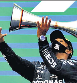
ଟ୍ରପି ସହ ଲୁଇସ ହାମିଲଟନ।

ମସିଡିକ୍‌ର ଲୁଇସ ହାମିଲଟନ ଏଠାରେ ରବିବାର ଅନୁଷ୍ଠିତ ଇଫୋଲ୍ ଫର୍ମୁଲା ଓନ ଗ୍ରାଁ ପ୍ରି ମୋଟରରେ ରେକର୍ଡ କରିଛନ୍ତି। ଏହାଦ୍ୱାରା ଫର୍ମୁଲା ଓନରେ ସବୁଠାରୁ ଅଧିକ ରେକର୍ଡ ଲିଟ୍ ମାଲକେଲ ସୁମାକର କରିଥିବା ରେକର୍ଡର ସେ ସମକକ୍ଷ ହୋଇ ପାରିଛନ୍ତି। ଇଫୋଲ୍ ଫର୍ମୁଲା ଓନ ଗ୍ରାଁ ପ୍ରିରେ ହାମିଲଟନ ତାଙ୍କ କ୍ୟାରିୟରର ୯୧୦୮୯ ବିଜୟ ହାସଲ କରିଛନ୍ତି। ଟାପିୟନସ୍ ଟେକ୍ନିକ୍ସ ପ୍ରଥମ ଗ୍ଲାନରେ ସେ ତାଙ୍କ ଛିଟିକୁ ଆହୁରି ସୁଦୂର କରିପାରିଛନ୍ତି। ଦ୍ୱିତୀୟ ଗ୍ଲାନରେ ରହିଥିବା ଟିମ୍‌ମେନ୍ ଭାଲଗୋରୀ ବୋଟାସ୍‌ଠାରୁ ପଦ୍ମ ବ୍ୟତୀତ ୧୯୯୬ ବୁକି କରିପାରିଛନ୍ତି। ରେକର୍ଡରେ ସମସ୍ୟା ଦେଖାଦେବାକୁ ଫିନ୍କାଣ୍ଡ ଡ୍ରାଇଭର ବୋଗାସ୍ ରେକ୍