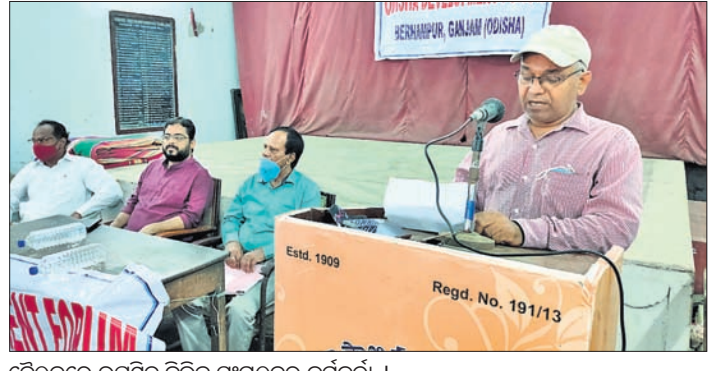
ବୈଠକରେ ଉପସ୍ଥିତ ବିଭିନ୍ନ ସଂଗଠନର କର୍ମକର୍ତ୍ତା ।

ବ୍ରହ୍ମପୁରରେ ବିମାନ ବନ୍ଦର ପ୍ରତିଷ୍ଠା ଦାରି ନେଇ ଓଡ଼ିଶା ଡେଭଲପମେଣ୍ଟ କର୍ମସୂଚୀ ପଞ୍ଚମ ଉଦ୍ଦେଶ୍ୟରେ ଏକ ମିଳିତ ବୈଠକ ଅନୁଷ୍ଠିତ ହୋଇଯାଇଛି।