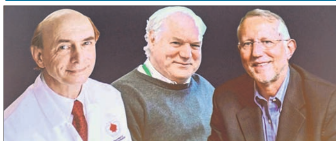
(ବାମକୁ) ହାର୍ଡେ ଜେ. ଅଲଟର, ମାଇକେଲ ହଫଟନ୍, ଚାର୍ଲସ ଏମ. ରାଇସ୍

ଅଫ ହେଲଥରେ ରହି ରକ୍ତ ନେଇସାରି ହେପାଟାଇଟିସ୍‌ରେ ଆକ୍ରାନ୍ତ ହୋଇପଡ଼ିଥିବା ରୋଗୀମାନଙ୍କ ଉପରେ ଗବେଷଣା କରିଥିଲେ। ସେ ଓ ତାଙ୍କର ସହ-ଗବେଷକମାନେ ଲକ୍ଷ୍ୟ କଲେ ଯେ ଏହି ରୋଗୀମାନଙ୍କଠାରୁ ରକ୍ତ ନେଇ ସିପାଞ୍ଜିଲ୍ ଇଞ୍ଜେକସନ ଦେଇଦେଲେ ସିପାଞ୍ଜିମାନେ ହେପାଟାଇଟିସ୍‌ରେ ଆକ୍ରାନ୍ତ ହୋଇପଡ଼ୁଛନ୍ତି। ସେମାନେ ସହେୟ କରୁଥିଲେ, ରୋଗୀଟି ହେପାଟାଇଟିସ୍ 'ଏ' ରୁହେଁ କି 'ବି' ରୁହେଁ। ତେଣୁ ସେମାନେ ଏହାକୁ 'ନନ୍-ଏ' ଏବଂ 'ନନ୍-ବି' ହେପାଟାଇଟିସ୍ ବୋଲି କହିଲେ। ମାଇକେଲ ହଫଟନ୍ ସେତେବେଳେ ଗବେଷଣା କରୁଥିବା ଚିରନ୍ ଦୀର୍ଘାସିଦ୍ଧିଚିକାଳ ଫାର୍ମରେ। ସେ ଓ