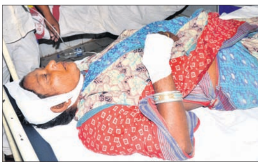
ପୁରୀ ଜିଲ୍ଲା ସଦର ମୁଖ୍ୟ ଚିକିତ୍ସାଳୟରେ ଚିକିତ୍ସିତ ହେଉଥିବା ଆହତ ବ୍ୟକ୍ତିମାନେ।