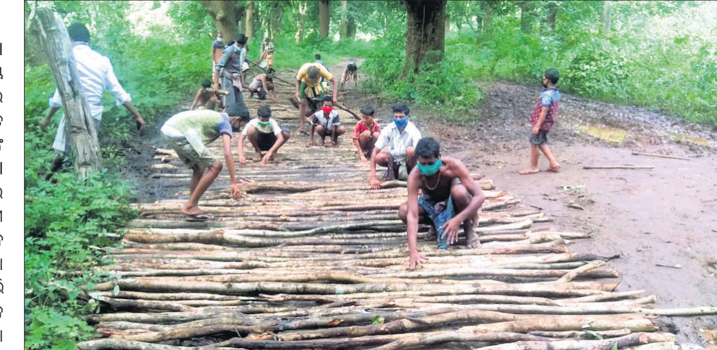
ସଂକ୍ରମଣ ଗ୍ରାମବାସୀ ରାସ୍ତାରେ କାଠ ବିଛାଉଛନ୍ତି।

ଶିଳ୍ପାୟନରେ ଆଗୁଆ ଅନୁଗୋଳ। ରାଜ୍ୟର ସର୍ବାଧିକ ରାଜସ୍ୱ ମଧ୍ୟ ଆଦାୟ ହେଉଛି ଏହି ଜିଲ୍ଲାରୁ। ହେଲେ ଜିଲ୍ଲାରେ ଏମିତି ବି ଗାଁ ଅଛି ଯେଉଁଠି ଯାତାୟାତ ପାଇଁ ଲୋକଙ୍କୁ ଜଙ୍ଗଲରୁ କାଠ କାଟି ପକ୍ କାଟୁଥିବା ରାସ୍ତା ଉପରେ ବିଛାଉଣୀକୁ ପଡ଼ୁଛି। ବର୍ଷ ବର୍ଷ ଧରି ସରକାରୀ ଯୋଜନାରେ ସଡ଼କଟିଏ ପାଇଁ ଦାବି କରି ନିରାଶ ହେବା ପରେ ନିଜ ସମସ୍ୟାର ସମାଧାନ ନିମନ୍ତେ ଲୋକଙ୍କୁ ଏପରି ଭିନ୍ନ ପଦ୍ଧତି ଆପଣାଇବାକୁ ପଡ଼ିଛି। ରବିବାର ଏପରି ଦୃଶ୍ୟ ଦେଖିବାକୁ ମିଳିଛି ଅନୁଗୋଳ ବ୍ଲକ୍ ସାତକୋଶିଆ ଅଭୟାରଣ୍ୟ ମଧ୍ୟରେ ଥିବା କୋଠୁଲୁ ପଞ୍ଚାୟତର ସଂକ୍ରମଣ ଗ୍ରାମରେ। ଜଙ୍ଗଲ ଅଧିକାରୀ ଗ୍ରାମ ସଂକ୍ରମଣ ଲୋକ ସଂଖ୍ୟା ପ୍ରାୟ ୩୫୦ ହେଲେ ଯାତାୟାତ ପାଇଁ ଭଲ ରାସ୍ତାଟିଏ ନାହିଁ। ଫଳରେ ବର୍ଷବର୍ଷ ହେଲେ ହଜସହ ହେଉଛନ୍ତି ଗ୍ରାମବାସୀ। ବିଶେଷକରି ବର୍ଷଦିନେ ଦୁର୍ଭାଗ୍ୟଜନକ। ସରକାର ସାଧାରଣ ଗରିବ ଲୋକଙ୍କୁ ଆୟୁର୍ବିଦ୍ୟୁତ୍ ସେବା ଦେବା ବିପଦ ହେଉଛନ୍ତି। ବାରମ୍ବାର ଏଭଳି ଚିତ୍ର ଦେଖିବାକୁ ମିଳୁଛି। ଆଗାମୀ ଦିନରେ ସରକାର ଏ ଦିନରେ ଅଧିକ ଯତ୍ନବାନ ଜଳଜଳ ହୋଇ ଦିଶୁଛି। ଆୟୁର୍ବିଦ୍ୟୁତ୍ ତାଙ୍କୁ ଯୋଗାଯାଇ ପାରିଲା ନାହିଁ।