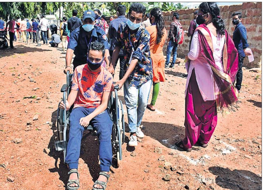
ଭୁବନେଶ୍ୱରର ଏକ ପରୀକ୍ଷା କେନ୍ଦ୍ରରୁ ଛାତ୍ର ଛାତ୍ରୀଙ୍କୁ ଅଣାଯାଇଛି ।

ପ୍ରଥମ ଦିନରେ ୭୧% ଛାତ୍ରାଛାତ୍ରୀ ପରୀକ୍ଷା ଦେଲେ