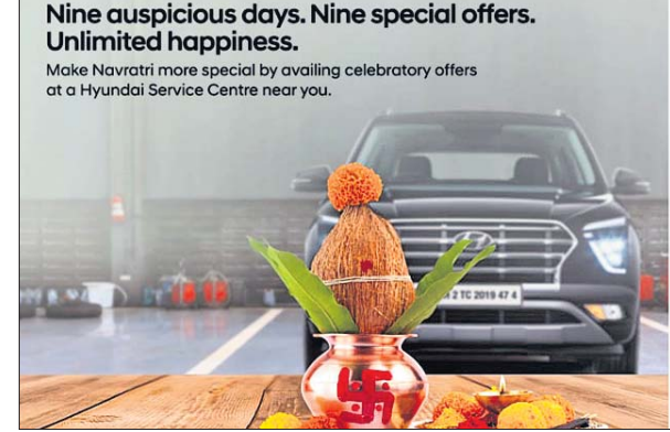
Nine auspicious days. Nine special offers. Unlimited happiness.

ପରିସ୍ପର୍ଶ ସର୍ବିସ ଏବଂ ରିମ୍ ରିପେୟର କ୍ଷେତ୍ରରେ ମେକାନିକାଲ ଲେବର ଉପରେ ୧୫% ରିହାତି ମିଳିବ।