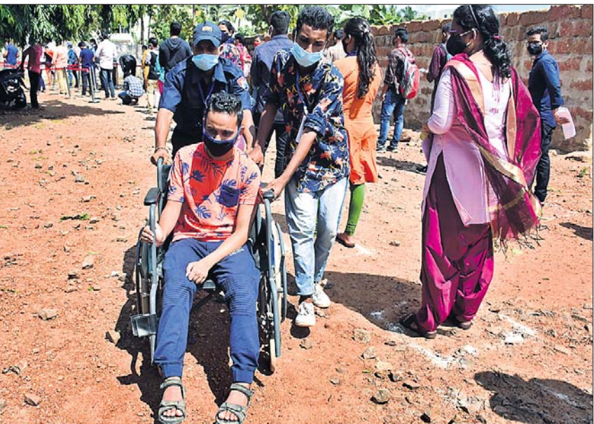
ଭୁବନେଶ୍ୱରର ଏକ ପରୀକ୍ଷା କେନ୍ଦ୍ରରୁ ଛାତ୍ର ଛାତ୍ରୀଙ୍କୁ ଅଣାଯାଇଛି ।

ପ୍ରଥମ ଦିନରେ ୭୧% ଛାତ୍ରାଛାତ୍ରୀ ପରୀକ୍ଷା ଦେଲେ