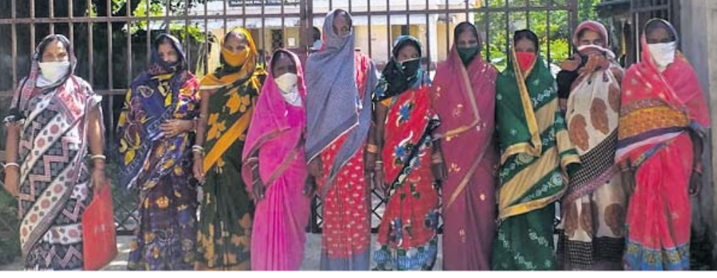
ନ୍ୟାୟ ପାଇଁ ଥାନାକୁ ଆସିଥିବା ସ୍ୱୟଂସହାୟକ ଗୋଷ୍ଠୀ ସଦସ୍ୟା।