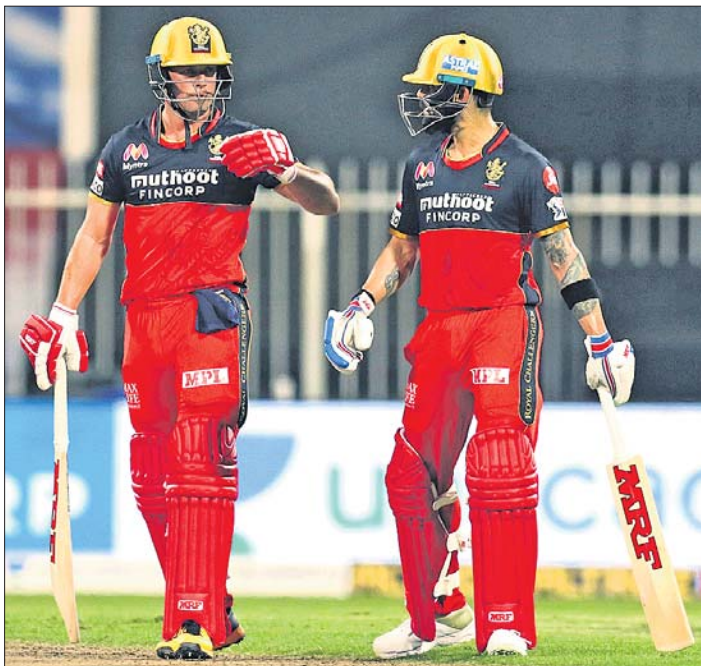
ଶତକୀୟ ଭାଗାଦାରି ଅବସରରେ ଏବି ଡିଭିଜନ୍ ଓ ବିରାଟ କୋହଲି।

ବିରାଟ କୋହଲିଙ୍କ ଦଳ ୮୨ ରନରେ ବିଜୟ ହୋଇଥିଲା। ଚଳିତ ଲିଗ୍ରେ ୬ ମ୍ୟାଚରୁ ୫ମ ବିଜୟ ସହ ଆରସିବି ପାଖରେ ଚାଲିକାର ତୃତୀୟ ଗ୍ଲାନରୁ ଉତ୍ତୀର୍ଣ୍ଣ ହୋଇଛି। ଅନୁପକ୍ଷରେ କୋଲକାତା ସମାନ ମ୍ୟାଚରୁ ୩ୟ ପରାଜୟ ବରଣ କରିଛି। ଚତୁର୍ଥ ପ୍ରଥମେ ବ୍ୟାଟିଂ ନେଇଥିଲା ଆରସିବି। ଦୁଇ ଓପନର ଦେବଦତ୍ତ ପତିକାଳ ଓ ଆରୋନ ଫିଣ୍ଡ୍‌ସ୍ ହାରରେ ରନ ସଂଗ୍ରହ କରି ପାଞ୍ଜର ଚୋ ୬ ଓଭରରେ କୌଣସି ଉଇକେଟ ନ ହରାଇ ୪୭ ରନ ସଂଗ୍ରହ କରି ନେଇଥିଲେ। ୬.୨ ଓଭରରେ ଦଳ ୪୦ ରନ ପୂରଣ ହୋଇଥିଲା। ଓପନିଂ ଯୋଡ଼ିରେ ୪୬ ବଲ୍ରେ ୬୭ ରନ ଯୋଗ ହେବାପରେ ଆନ୍ଦ୍ର ରସେଲଙ୍କ ବଲ୍ରେ ବଡ଼ ଶତ୍ ମାରିବାକୁ ଯାଇ ପତିକାଳ କୁଁ ବୋଲୁ ହୋଇ ଯାଇଥିଲେ। ସେ ୨୩ ବଲ୍ରେ ୩୨(୪ ଟୋକା, ୧ ଛକା) ରନ କରିଥିଲେ। ଅଧିନାୟକ ବିରାଟ କୋହଲି କ୍ରିକେଟ ଯୋଗଦେବାପରେ ରନହାର ଧୂମପାଇ ଯାଇଥିଲା। ସେ ଅତ୍ୟନ୍ତ ଧୂମା ଆରମ୍ଭ କରିଥିବାବେଳେ ୧୩ତମ ଓଭରରେ ଫିଣ୍ଡ୍ ଆଉଟ ହୋଇଥିଲେ। ସେ ୩୭ ବଲ୍ରେ ୪ ଟୋକା ଓ ୧ ଛକା ସହାୟତାରେ ୪୭ ରନ