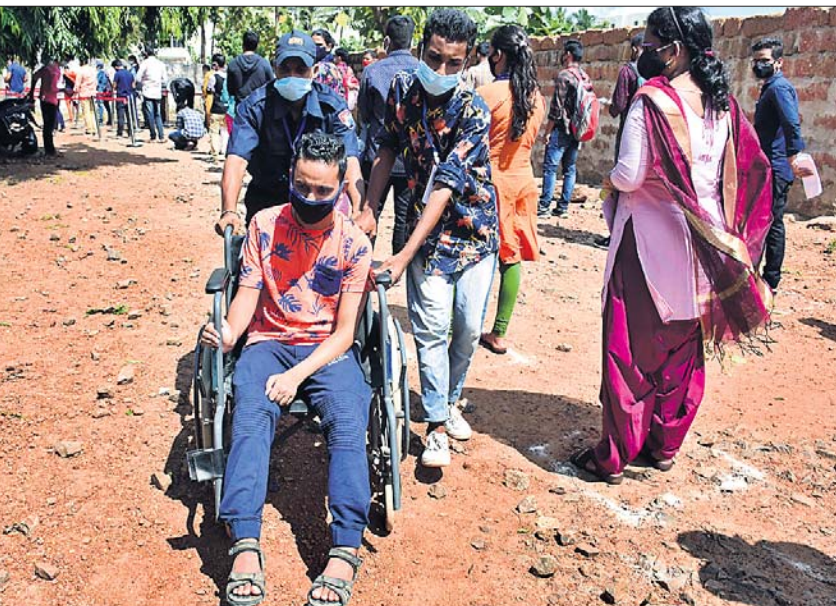
ଭୁବନେଶ୍ୱରର ଏକ ପରୀକ୍ଷା କେନ୍ଦ୍ରରୁ ଛାତ୍ର ଛାତ୍ରୀଙ୍କୁ ଅଣାଯାଇଛି ।