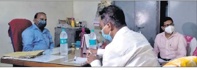
କଲେଜରେ ଡ଼ାକ୍ତକାରୀ ଚିମ୍ ।