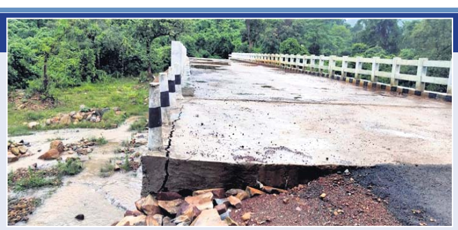
ମହିଷପହରା ନାଳ ଉପରେ ନିର୍ମିତ ପୋଲ କାନ୍ଦ ଫାଟି ଯାଇଛି।

ଦୀର୍ଘବର୍ଷ ଧରି ମୌଳିକ ସୁବିଧାରୁ ବଞ୍ଚିତ ରହିଥିବା ବ୍ଲକ୍ ଅଧୀନ ଚିଲୁଡ଼ିପାଳ ପଞ୍ଚାୟତର ବହୁ ଚଳିତ ନଗଡ଼ା ଆଦିବାସୀ ପରିବାରକୁ ପୁଖ୍ୟପ୍ରୋତରେ ସାମିଲ କରିବାକୁ ସରକାର ବିଭିନ୍ନ ଯୋଜନା ଆରମ୍ଭ କରିଥିଲେ।