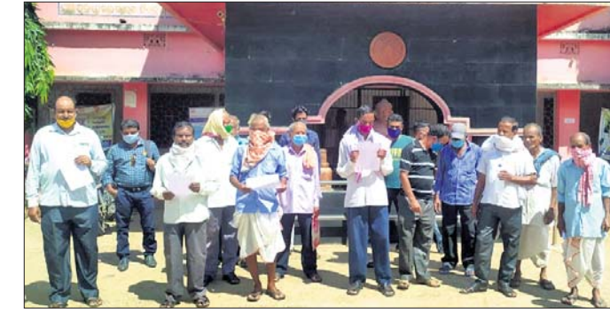
ପଞ୍ଚାୟତ ସମିତି କାର୍ଯ୍ୟକ୍ରମ ଆଗରେ ଅଭିଯୋଗକାରୀମାନେ।

ବରା ବ୍ଲକ୍ ଅଞ୍ଚଳରେ ବନ୍ୟା ବିପଦକୁ ରିଲିଫ ଯୋଗାଣରେ ଅନିୟମିତତା ନେଇ ଗତ କିଛିଦିନ ହେବ ଅନେକ ଅଭିଯୋଗ ହୋଇଆସୁଛି।