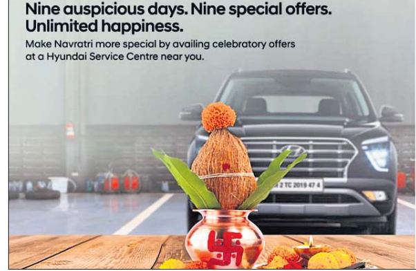
Nine auspicious days. Nine special offers. Unlimited happiness.