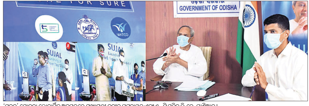
'ସୁଜଳ' ଯୋଜନା ଲୋକାର୍ପିତ ଅବସରରେ ମୁଖ୍ୟମନ୍ତ୍ରୀ ନବୀନ ପଟ୍ଟନାୟକ ଏବଂ ୪-ଟି ସଚିବ ଭି.କେ. ପାଣ୍ଡେଆନ।

ଲୋକାର୍ପିତ ହେଲା 'ସୁଜଳ' ଯୋଜନା ୨୦୨୨ ସୁଦ୍ଧା ସମସ୍ତ ସହରର ସବୁ ଘରକୁ ପାଇପ ପାଣି: ମୁଖ୍ୟମନ୍ତ୍ରୀ