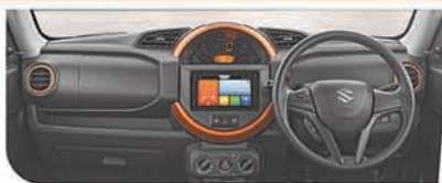
Dynamic Centre Console