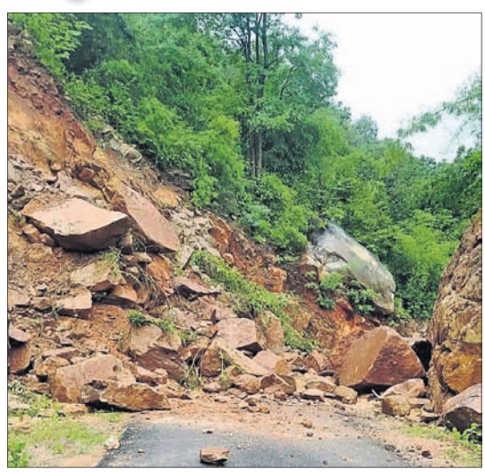
ଗଞ୍ଜାମ ଜିଲ୍ଲାର ଚାହୁଁବାସି ଓ ଚିରିଆବାଡ଼ ମଧ୍ୟସ୍ଥଳରେ ପାହାଡ଼ ଧସିପଡ଼ିଛି।

ପରେ ଆଉ କେତେକ ମଧ୍ୟ ସୁରକ୍ଷିତ ସ୍ଥାନକୁ ନିଆଯାଇଛି। ସୋମବାର ରକ୍ଷା ଖାତ୍ୟ ପ୍ରଦାନ କରାଯାଇଛି। ବୁଲୁ ଜିଲ୍ଲାର ବିଭିନ୍ନ ନଦୀରେ ବନ୍ୟାଜଳ ପ୍ରବାହ ହେଉଛି। ପାହାଡ଼ରୁ ବୁଲୁ ପାହାଡ଼ ଉପରେ ଥିବା ଆକୂଳି, ବୁରାଗାଳ, ବୁଝା ପଞ୍ଚାୟତର ଅଧିକାଂଶ ଗ୍ରାମରେ ବାଦଲଫଟା ବର୍ଷା ହୋଇଛି। ଏଲଗଲ, ବଣିଆବସା, ବେହେରାପୁର, ମାଡୁଆପୁର, ଉପରବୁରାଗାଳ, ବାଦୁଆ, କୁରଗଡ଼, ଯୋବାଲିକି, ଅଣ୍ଡାଆଳି ଆଦି ଗ୍ରାମରେ ବର୍ଷା ପାଣି ପଶି ଆଦିବାସୀଙ୍କୁ ଆତଙ୍କିତ କରିଛି।