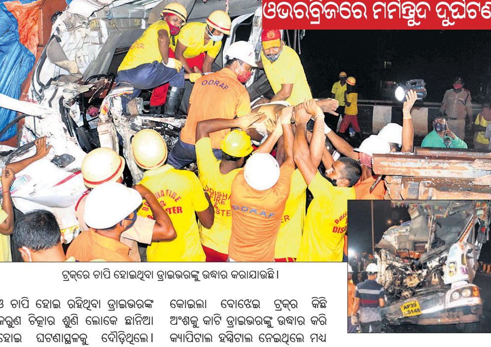
ଡ୍ରକ୍ରେ ଚାପି ହୋଇଥିବା ଟ୍ରକ୍ ଉଦ୍ଧାର କରାଯାଇଛି ।

ଭୁବନେଶ୍ୱର, ୧୫ ଅକ୍ଟୋବର (ସ୍ୱାଭାବ): ପୀୟାଙ୍କୁ ଛେଦନ କରି ନିକଟ ୧୨ ନମ୍ବର ଜାତୀୟ ରାଜପଥ ଉତ୍ତରକୁ ଉପରେ ରୁଧିବା ପାଇଁ ନିର୍ମାଣ କର୍ମଜୀବୀମାନେ ଠିକ୍ କରିବା ପାଇଁ ଯତ୍ନ କରିବା ପାଇଁ ଉଭୟ ପକ୍ଷ ମଧ୍ୟରେ ଯୁକ୍ତିତର୍କ ହୋଇଥିଲା । ଏବେ ମୃତଦେହ ଉଦ୍ଧାର କାର୍ଯ୍ୟ ପାଇଁ ଉଭୟ ପକ୍ଷ ମଧ୍ୟରେ ଯୁକ୍ତିତର୍କ ହୋଇଥିଲା । ଏବେ ମୃତଦେହ ଉଦ୍ଧାର କାର୍ଯ୍ୟ ପାଇଁ ଉଭୟ ପକ୍ଷ ମଧ୍ୟରେ ଯୁକ୍ତିତର୍କ ହୋଇଥିଲା ।