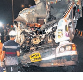
ଡ୍ରକ୍ରେ ଚାପି ହୋଇଥିବା ଟ୍ରକ୍ ଉଦ୍ଧାର କରାଯାଇଛି ।