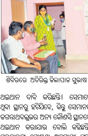
ଶିବିରରେ ଅତିରିକ୍ତ ଜିଲାପାଳଙ୍କୁ ସମ୍ମାନ ଜଣାଇବା ପାଇଁ ପ୍ରଶଂସା ପତ୍ର ପ୍ରଦାନ କରାଯାଇଛି ।

ଭୁବନେଶ୍ୱର, ୧୫ ଅକ୍ଟୋବର (ସ୍ୱାଭାବ): ୪ ମୌଜାବାସୀଙ୍କୁ ପ୍ରକଳ୍ପ ପ୍ରଭାବିତ ରଖିଲେ ମତ ଦେବାକୁ ନିର୍ଦ୍ଦେଶ ଦିଆଯାଇଛି ।