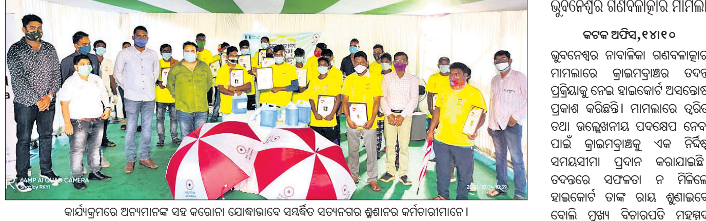
କାର୍ଯ୍ୟକ୍ରମରେ ଅନୁମାନକ ସହ କରୋନା ଯୋଦ୍ଧା ଭାବେ ସମ୍ମାନିତ କର୍ମଚାରୀମାନେ ।

ଭୁବନେଶ୍ୱର, ୧୫ ଅକ୍ଟୋବର (ସ୍ୱାଭାବ): କରୋନା ମୁକାବିଳା ପାଇଁ କର୍ମଚାରୀମାନଙ୍କୁ ସମ୍ମାନିତ କରାଯାଇଛି । ଏହି ସମ୍ମାନ ପ୍ରଦାନ କାର୍ଯ୍ୟରେ ଅନୁମାନକ ସହ କରୋନା ଯୋଦ୍ଧା ଭାବେ ସମ୍ମାନିତ କରାଯାଇଛି ।