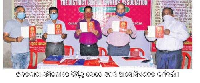
ଖବରଦାତା ସମ୍ମିଳନୀରେ ଡିଷ୍ଟ୍ରିକ୍ଟ ସେକ୍ଟର ଓଜର୍ସ ଆସୋସିଏସନର କର୍ମଚାରୀ ।

ଭୁବନେଶ୍ୱର, ୧୫ ଅକ୍ଟୋବର (ସ୍ୱାଭାବ): ଶ୍ଯାସ୍ତ୍ର ପାଇଁ ସର୍ବିକା ଜନଶୁଣାଣୀ କାର୍ଯ୍ୟକ୍ରମ ଆରମ୍ଭ ହେବ । ଏହି କାର୍ଯ୍ୟକ୍ରମରେ ଅଧିକାରୀମାନେ ପରିବାର ସମ୍ପର୍କରେ ସଚ୍ଚିତ୍ତ ହେବେ ।