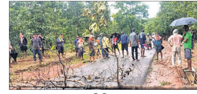
ଉଦ୍ଧାର ଲୋକେ ରାସ୍ତା ଅବରୋଧ କରିଛନ୍ତି।

କରୋନାରେ ମୃତକଙ୍କ ଅଧିକ ସଂଖ୍ୟା ପାଇଁ ପିରିଲିଆ ବ୍ଲକ ପ୍ରଶାସନ ପକ୍ଷରୁ ମାଝିପଡା ଘାଟି ନିକଟରେ ଚିହ୍ନଟ ହୋଇଥିବା ଅସ୍ଥାୟୀ ପ୍ରକାଶ ପାଇଛି। ସ୍ଥାନୀୟ ଲୋକେ ଜଣେ ମୃତକଙ୍କ ଶବଦାହକୁ ବିରୋଧ କରି ରାସ୍ତାରୋକ କରିଥିଲେ। ଫଳରେ ୬ ଘଣ୍ଟା ଧରି ମୃତଦେହ ରାସ୍ତା କଡ଼ରେ ପଡ଼ି ରହିଥିଲା। ପରେ ତହସିଲଦାର ଯାଇ ଲୋକଙ୍କୁ ବୁଝାଶୁଣି କରିବା ପରେ ପରିସ୍ଥିତି ଶାନ୍ତ ପଡିଥିଲା। ଲୋକଙ୍କ ଦାବି ଅନୁସାରେ ଅନ୍ୟ ସ୍ଥାନରେ ମୃତଦେହ ସହାର କରାଯାଇଥିଲା।