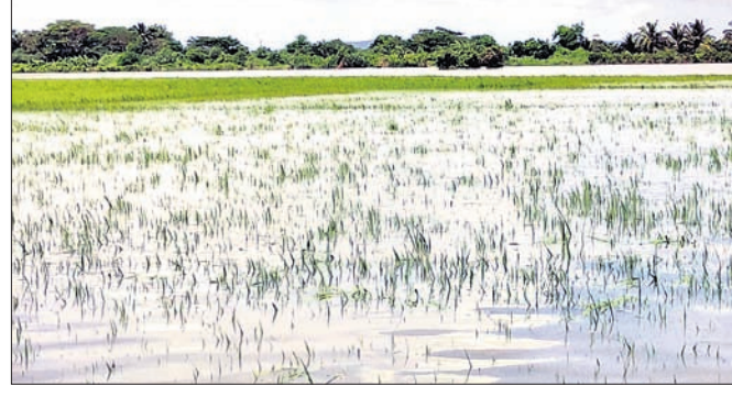
ପାଣିରେ ବୁଡ଼ି ଧାନ ଫସଲ।

ଗଞ୍ଜାମ ଜିଲ୍ଲାରେ ପ୍ରତିବର୍ଷ ବିଭିନ୍ନ ପ୍ରାକୃତିକ ବିପର୍ଯ୍ୟୟ ଆଦି ଚାଷୀଙ୍କ ଆର୍ଥିକ ମେରୁଦଣ୍ଡକୁ ଭାଙ୍ଗି ଦେଇଛି। ଏଥିପାଇଁ ଅନେକ ଚାଷୀ ଜିଲ୍ଲା ଛାଡ଼ି ଦାଦନ ଖିରବାକୁ ବାହାର ରାଜ୍ୟକୁ ଯାଉଛନ୍ତି। ଚଳିତବର୍ଷ ମାର୍ଚ୍ଚରୁ କରୋନା ମହାମାରୀ ଯୋଗୁଁ ଲକଡାଉନ୍ ଓ ଶିବଡାଉନ କଟକଣା ହୋଇଥିଲା। ଧାନର ଅଭାବ ଟ୍ରେଡି ପରିସ୍ଥିତି ହୋଇଥିଲା। ୫୦ ହଜାର ଚାଷୀ ଧାନ ବିକ୍ରି କରି ନ ପାରି ଲକ୍ଷାଧିକ ଟଙ୍କା କ୍ଷତି ସହିଛନ୍ତି। ପରିବା ଚାଷୀମାନେ ମଧ୍ୟ ବଜେଟପାସରରେ ଦୁଷ୍ଟ ହୋଇଥିବା ବାହାରକୁ ପନିପରିବା ପଠାଇ ପାରିନେଇ ନି। ପରିବା କମ ଦରରେ ବିକି କ୍ଷତି ସହିଲେ। ଅନୁଲକ୍ଷରେ ଜିବାକା ବଞ୍ଚାଇବା ପାଇଁ ସଂଘର୍ଷ ଚାଲିଛି। ଏହି ସମୟରେ ଗୋଟିଏ ପରେ ଗୋଟିଏ ଆୟୁଧ ଲଢୁଚାପ ଯୋଗୁଁ ଚାଷୀ ହତାଶ ହୋଇପାରୁଛି।