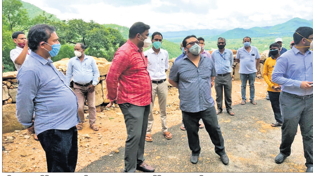
ସମ୍ପାଦକ ଆର୍ଡିସି, ବ୍ରହ୍ମପୁର ଉପଜିଲାପାଳ ଓ ଅନ୍ୟ ଅଧିକାରୀ ସ୍ଥିତି ଅନୁଧ୍ୟାନ କରୁଛନ୍ତି।