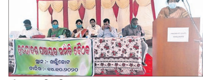
ବୈଠକରେ ଉପସ୍ଥିତ ଅଧିକାରୀ।