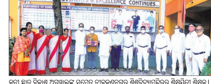
କୃତୀ ଛାତ୍ର ବିକାଶ ଅଗ୍ରାଣୀକ ସମେତ ନାଳକଣ୍ଠନଗର ଶିଶୁବିଦ୍ୟାଳୟର ଶିକ୍ଷୟିତ୍ରୀ ଶିକ୍ଷକ।