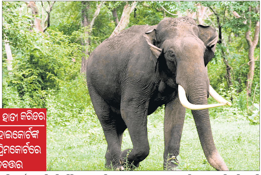
ନିଲ୍ଗିରିସ୍ ହାତୀ କବିତର ମାଡ୍ରାସ୍ ହାଇକୋର୍ଟଙ୍କ ରାୟ ସୁପ୍ରିମକୋର୍ଟରେ ରାଜପତ୍ତିର

ହାତୀ ଏକ କେଶଳମୟାନ୍ତ। ମଣିଷ ହାତୀକୁ ବାଟ ଛାଡ଼ିଦେବା ଉଚିତ। ହାତୀ ଏକ ବିଶାଳକାୟ ଜୀବ ହେଲେ ମଧ୍ୟ ଭଲଭାବେ ପାଳିବାକୁ ହେବ। ହାତୀର ପ୍ରକୃତ ଘର ହେଉଛି ଉଦ୍ୟାନ। ହାତୀର ପ୍ରକୃତ ଘର ହେଉଛି ଉଦ୍ୟାନ। ହାତୀର ପ୍ରକୃତ ଘର ହେଉଛି ଉଦ୍ୟାନ।