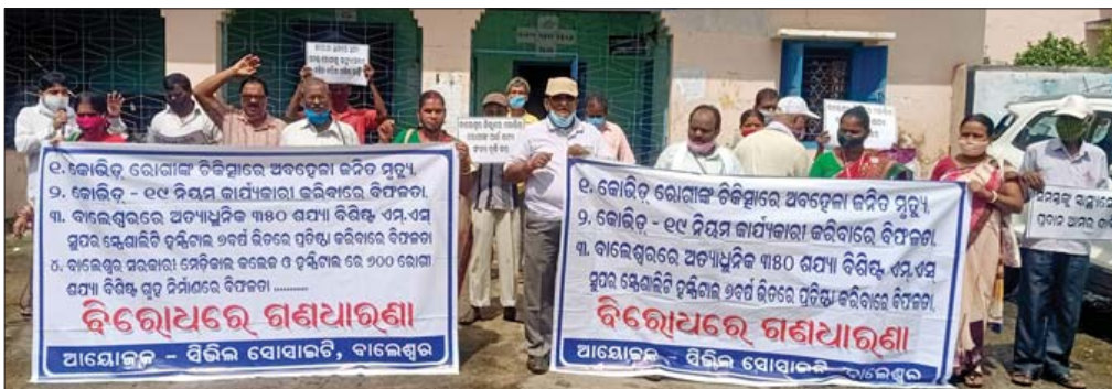
ବିଭିନ୍ନ ସୋସାଇଟି କର୍ମକର୍ତ୍ତା ବିକ୍ଷୋଭ ପ୍ରଦର୍ଶନ କରୁଛନ୍ତି।