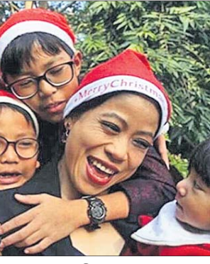
ସପ୍ତାହ ଲାଭରେ ଏମ୍‌ସି ମେରାକର୍।