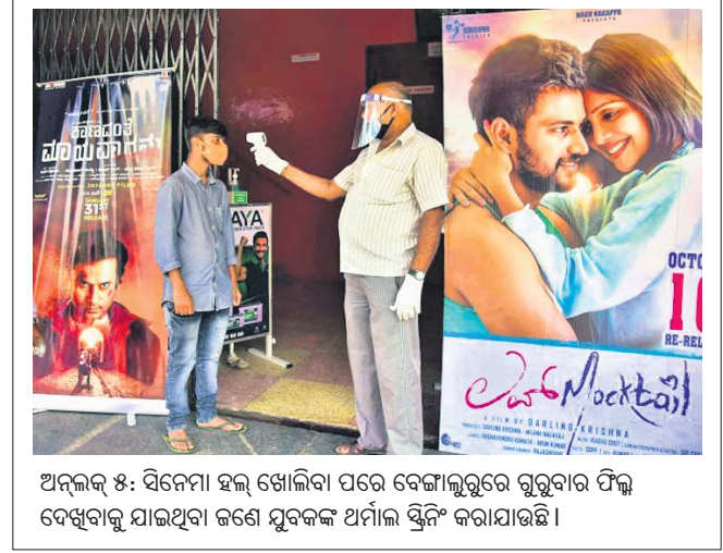
ଅଲ୍‌ହାଜ୍ ୫: ସିନେମା ହଲ୍ ଖୋଲିବା ପରେ ବେଙ୍ଗାଳୁରୁରେ ଗୁରୁବାର ପିକ୍ସି ଦେଖିବାକୁ ଯାଇଥିବା ଜଣେ ଯୁବକଙ୍କ ଅର୍ମାଲ ଷ୍ଟିଲ୍ କରାଯାଇଛି।