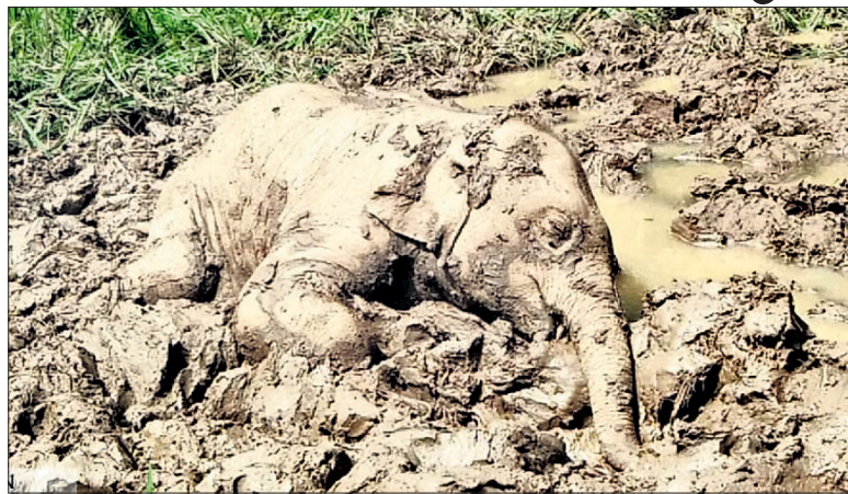
କାଦୁଅ ଦଳରେ ମରି ପଡ଼ିଥିବା ହାତୀ ଶାବକ।

କେନ୍ଦୁଝର ଜିଲ୍ଲା ଭୂୟାଁ ଲୁଆଙ୍ଗ ପାହାଡ଼ରେ ଖୁଣ୍ଟିକା ନଦୀର ଅଧୀନ ନଦୀପାଣି ଗ୍ରାମର କାଦୁଅ ଦଳରେ ଫସି ଏକ ହାତୀ ଶାବକର ମୃତ୍ୟୁ ଘଟିଛି। ଏହି ଦଳ ଦେଇ ହାତୀପଲ ଯାଉଥିବା ବେଳେ ଶାବକଟି କାଦୁଅରେ ଫସି ଯାଇଥିବା ସୂଚନା ମିଳିଛି। ଗୁରୁବାର ପାହାଡ଼ତଳ ଗାଁ ନଦୀପାଣିରେ ହାତୀପଲ ରହିଥିଲେ। ଏହି ଦଳରେ ୨ଟି ଦଣ୍ଡ, ୪ଟି ମାଙ୍କ ଓ ୩ଟି ଶାବକ ଥିଲେ। ବନବିଭାଗ ସ୍ୱାସ୍ଥ୍ୟ ମଧ୍ୟ ଏହି ହାତୀ ପଲ ଉପରେ ତାକ୍ଷଣିକ ନଜର ରଖୁଥିଲା। ତେବେ ଗୁରୁବାର ଭୋର ସମୟରେ ହାତୀ ପଲ କାଦୁଅ ଦଳ ଦେଇ ଯାଉଥିବାବେଳେ ୨ ବର୍ଷ ବୟସ୍କ ଶାବକଟି କାଦୁଅରେ ଫସି ଯାଇଥିଲା। ଅନ୍ୟ ହାତୀମାନେ ତାକୁ ଉଦ୍ଧାର କରିବାକୁ ଚେଷ୍ଟା କରି ବିଫଳ ହୋଇଥିଲେ। ସ୍ଥାନୀୟ ଲୋକେ ହାତୀ ଗର୍ଜନ ଶୁଣି ବନବିଭାଗକୁ ଖବର ଦେଇଥିଲେ। ବନ ବିଭାଗ କର୍ମଚାରୀ ଘଟଣାସ୍ଥଳରେ ସକାଳ ପ୍ରାୟ ୯ଟା ସମୟରେ ପହଞ୍ଚିବା ବେଳକୁ ହାତୀ ଶାବକଟିର ମୃତ୍ୟୁ ଘଟି ସାରିଥିଲା। କେନ୍ଦୁଝର