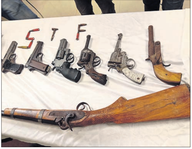
ଜବତ ହୋଇଥିବା ବନ୍ଧୁକ ଓ ଗୁଳି।