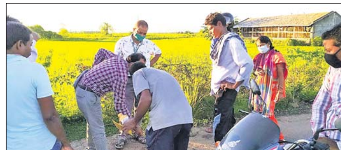
ଅଧିକାରୀମାନେ ଚିଲୋ ଗ୍ରାମର ଧାନ କ୍ଷେତ୍ର ବୁଲି ଦେଖୁଛନ୍ତି।