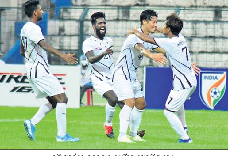
ଖୁସି ମୁହୂର୍ତ୍ତରେ ମହମ୍ମଦାନ ସ୍ୱୋଟିଂର ଖେଳାଳିମାନେ।