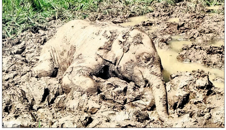
କାଦୁଅ ଦଳରେ ମରି ପଡ଼ିଥିବା ହାତୀ ଶାବକ।

କେନ୍ଦୁଝର ଜିଲ୍ଲା ଭୂୟାଁ ଛୁଆଁ ପାହାଡ଼ରେ ଖୁଣ୍ଟିକା ନଦୀର ଅଧୀନ ନଦୀପାଣି ଗ୍ରାମର କାଦୁଅ ଦଳରେ ଫସି ଏକ ହାତୀ ଶାବକର ମୃତ୍ୟୁ ଘଟିଛି। ଏହି ଦଳ ଦେଇ ହାତୀପଲ ଯାଉଥିବା ବେଳେ ଶାବକଟି କାଦୁଅରେ ଫସି ଯାଇଥିବା ସୂଚନା ମିଳିଛି। ଗୁରୁବାର ପାହାଡ଼ତଳ ଗାଁ ନଦୀପାଣିରେ ହାତୀପଲ ରହିଥିଲେ। ଏହି ଦଳରେ ୨ଟି ଦଣ୍ଡ, ୪ଟି ମାଙ୍କ ଓ ୩ଟି ଶାବକ ଥିଲେ। ବନବିଭାଗ ସ୍ୱାସ୍ଥ୍ୟ ମଧ୍ୟ ଏହି ହାତୀ ପଲ ଉପରେ ତାକ୍ଷଣିକ ନଜର ରଖୁଥିଲା। ତେବେ ଗୁରୁବାର ଭୋର ସମୟରେ ହାତୀ ପଲ କାଦୁଅ ଦଳ ଦେଇ ଯାଉଥିବାବେଳେ ୨ ବର୍ଷ ବୟସ୍କ ଶାବକଟି କାଦୁଅରେ ଫସି ଯାଇଥିଲା। ଅନ୍ୟ ହାତୀମାନେ ତାକୁ ଉଦ୍ଧାର କରିବାକୁ ଚେଷ୍ଟା କରି ବିଫଳ ହୋଇଥିଲେ। ସ୍ଥାନୀୟ ଲୋକେ ହାତୀ ଗର୍ଜନ ଶୁଣି ବନବିଭାଗକୁ ଖବର ଦେଇଥିଲେ। ବନ ବିଭାଗ କର୍ମଚାରୀ ଘଟଣାସ୍ଥଳରେ ସକାଳ ପ୍ରାୟ ୯ଟା ସମୟରେ ପହଞ୍ଚିବା ବେଳକୁ ହାତୀ ଶାବକଟିର ମୃତ୍ୟୁ ଘଟି ସାରିଥିଲା। କେନ୍ଦୁଝର