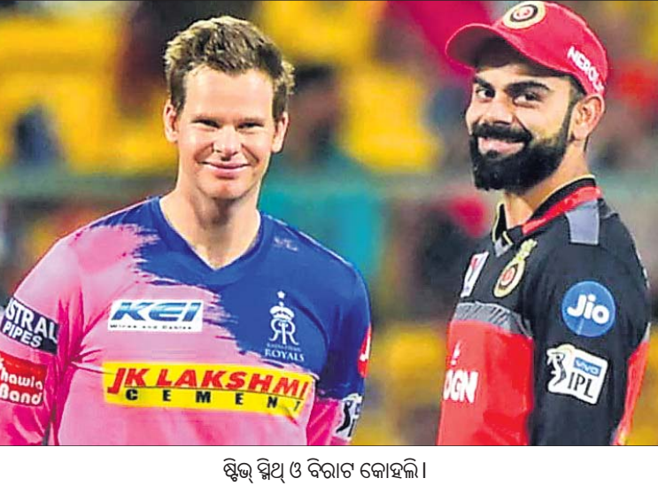
ଷ୍ଟିଲ୍ ସ୍ମିଥ୍ ଓ ବିରାଟ କୋହଲି।

ଭଣ୍ଡାଳ, ୧୬ ଅକ୍ଟୋବର (ପି.ଟି.): ଇଣ୍ଡିଆନ ପ୍ରିମିୟର ଲିଗ୍ (ଆଇପିଏଲ୍)ର ୩୩ତମ ମ୍ୟାଚ୍ରେ ଶନିବାର ରୟାଲ ଟ୍ୟାଲେଣ୍ଟସ୍ ବାଙ୍ଗାଲୋର ଓ ରାଜସ୍ଥାନ ରୟାଲ୍ସ ପରସ୍ପରକୁ ଭେଟିବେ। ଗତ କିଙ୍କୁ ଏକାଦଶ ପଞ୍ଚାବ ବିପକ୍ଷ ମ୍ୟାଚ୍ ପରାଜୟରେ ଦଳ ନେଇଥିବା କେତୋଟି ଅସାଧୁତ ନିଷ୍ପତ୍ତିକୁ ନେଇ ବାଙ୍ଗାଲୋର ଚର୍ଚ୍ଚନା କରିବ ଓ ନୂଆ ରଣନୀତି ସହ ପଞ୍ଚାଶ ଓଡ଼ିଆ ଓଡ଼ିଆ ପରେ ଦଳର ପ୍ରଦର୍ଶନରେ ସୁଧାର ଆସିବ ବାଙ୍ଗାଲୋର ଦଳ ଏପର୍ଯ୍ୟନ୍ତ ୮ଟି ମ୍ୟାଚ୍ ଖେଳି ୫ ବିଜୟ, ୩ ପରାଜୟ ସହ ୧୦ ପଏଣ୍ଟ ହାସଲ କରି ତାଲିକାର ତୃତୀୟ ସ୍ଥାନରେ ରହିଛି। ଅପରପକ୍ଷରେ ରାଜସ୍ଥାନ ଏକାଧିକ ସମସ୍ୟାର ପତି ଆଶାକୁ ପ୍ରଦର୍ଶନ କରିପାରି ନାହିଁ। ଦଳ ଏପର୍ଯ୍ୟନ୍ତ ୮ଟି ମ୍ୟାଚ୍ ଖେଳି ୩