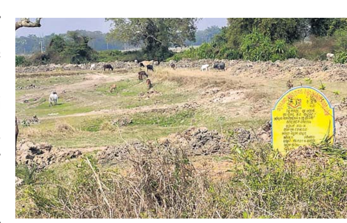
ଆମ ଗାଁ ଆମ ବିକାଶ ଯୋଜନାରେ ଖୋଳାଯାଇଥିବା ପୋଖରୀ।

ବାଲେଶ୍ୱର ଜିଲ୍ଲା ବାହାନଗା ବ୍ଲକ ଆରୁହାବାଡ଼ ପଞ୍ଚାୟତ ରୂପଖଣ୍ଡ ଗ୍ରାମର ଜଣକ ବ୍ୟକ୍ତିଗତ ଜମିରେ ଥିବା ପୋଖରୀକୁ ସରକାରୀ ଅର୍ଥ ଖର୍ଚ୍ଚ କରି ଖନନ କରାଯାଇଛି। ଏ ବାବଦରେ ଲକ୍ଷାଧିକ ଟଙ୍କା ହତପ କରାଯାଇଥିବା ଗ୍ରାମବାସୀ ଜିଲ୍ଲାପାଳ ଓ ପୁଞ୍ଜାମନ୍ତ୍ରୀଠାରେ ଅଭିଯୋଗ କରିଛନ୍ତି। ଗତ ତା ୨୩/୧୨/୨୦୨୦ରେ କେନ୍ଦ୍ର ଅଧିକାରୀଙ୍କୁ ଉପସ୍ଥିତ ଥିବା ଗ୍ରାମବାସୀ ବ୍ୟକ୍ତିଗତ ଜମିରେ ଖୋଳାଯାଇଥିବା ଜାଣିପାରି ନ ଥିଲେ। ଲୋକଙ୍କ ଆକାଶଗଡ଼ରେ ସରକାରୀ ଅର୍ଥ ବ୍ୟୟବରାଦ କରାଯାଇ ଖୋଳାଯାଉଥିବାରୁ ଗ୍ରାମବାସୀ ପ୍ରଥମେ ବିରୋଧ କରିଥିଲେ। ପରେ ତାହା 'ଆମ ଗାଁ ଆମ ବିକାଶ' ଯୋଜନାରେ