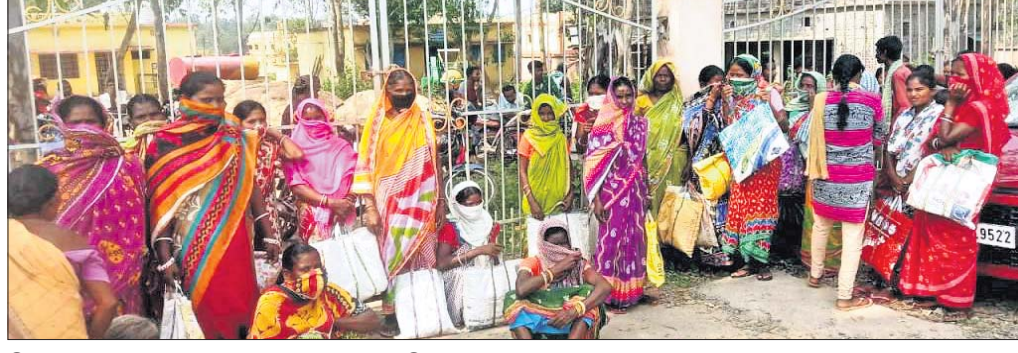
ହିତାଧିକାରୀମାନେ ଫାଟକରେ ତାଲା ପକାଇ ଦେଇଛନ୍ତି।