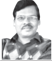
ଡ. ପବିତ୍ର ପ୍ରସ୍ତୁତି