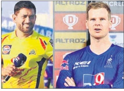
ମହେନ୍ଦ୍ର ସିଂ ଧୋନୀ ଓ ସ୍ଟିଭ୍ ସ୍ମିଥ୍।

ଚଳିତ ଇଣ୍ଡିଆନ୍ ପ୍ରିମିୟର ଲିଗ୍ (ଆଇପିଏଲ୍)ରେ ନିଜର ସ୍ଥିତି ବଜାୟ ରଖିବାକୁ ସଂଘର୍ଷ କରୁଥିବା ଦୁଇ ଦଳ ଚେନ୍ନାଇ ସୁପର କିଙ୍ଗ୍ସ ଓ ରାଜସ୍ଥାନ ରୟାଲ୍ସ ସୋମବାର ପୁଣିଥରେ ଘେରୁ- ଅର୍ଥୁ ଆଶା ବଜାୟ ରଖିବାକୁ ଉଦ୍ୟମ ଦଳ ବିଜୟୀ ହେବା ଜରୁରୀ ହୋଇ ପଡ଼ିଛି। ଫଳରେ ଏହି ମ୍ୟାଚ୍ ରେ ଗୁରୁତ୍ଵ ଦିଆଯାଇଛି। ପରାସ୍ତ ହେଲେ ଘେ- ଅର୍ଥୁରେ ସ୍ଥାନ ବଜାୟ ରଖିବା କଷ୍ଟକର ହେବ ବୋଲି ଉଭୟ ଦଳ ହୃଦୟଙ୍ଗମ କରିଥିବେ। ଏପର୍ଯ୍ୟନ୍ତ ଆଇପିଏଲ୍ରେ ଉଭୟ ଦଳ ଆଶାକୁ ପ୍ରଦର୍ଶନ କରିପାରିନାହାନ୍ତି। ଚେନ୍ନାଇ ଏପର୍ଯ୍ୟନ୍ତ ୯ଟି ମ୍ୟାଚ୍ ଖେଳି ୩ ବିଜୟ ଓ ୬ ପରାଜୟ ସହ ୬ ପଏଣ୍ଟ ହାସଲ କରି ଚାଲିକାର ଷଷ୍ଠ ସ୍ଥାନରେ ରହିଛି। ଅନ୍ୟପଟେ ରାଜସ୍ଥାନ ସମାନ ସଂଖ୍ୟକ ମ୍ୟାଚ୍ ଖେଳି ୩ ବିଜୟ ଓ ୬ ପରାଜୟ ସହ ସମାନ ୬ ପଏଣ୍ଟ ହାସଲ କରିଥିଲେ ମଧ୍ୟ ନେଟ୍ ରନ୍ ରେଟ୍ ଦୃଷ୍ଟିକୋଣରୁ ପଛରେ ରହି ସପ୍ତମ ସ୍ଥାନରେ ରହିଛି। ଉଭୟ ଦଳ ଏବେ ଆଉ ବାକିଥିବା ୫ଟି ମ୍ୟାଚ୍ ଖେଳିବେ। ଚେନ୍ନାଇ ଦଳ ପାଇଁ ଆଗକୁ କଷ୍ଟକର ପରସ୍ଥିତି ରହିଛି। ଚେନ୍ନାଇ ଦଳକୁ ପ୍ରାୟ ସବୁ ମ୍ୟାଚ୍ରେ ବିଜୟୀ ହେବା ଭଳି ପରସ୍ଥିତି ସୃଷ୍ଟି ହୋଇଛି।