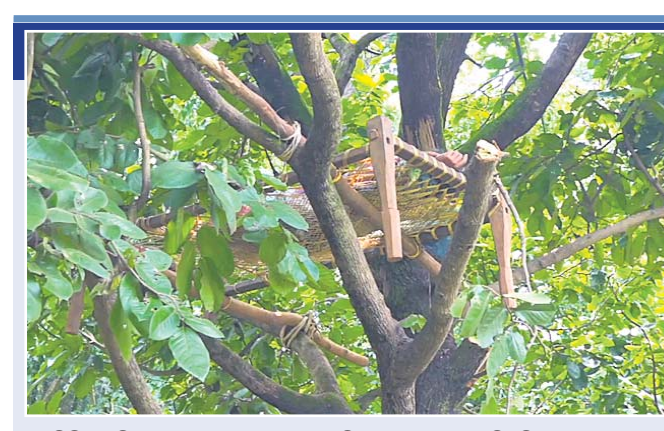
ବାଲିଗିରିପୋଷା ଅଞ୍ଚଳରେ ଗଛରେ ମଞ୍ଚା ବାନ୍ଧି ଲୋକେ ହାତୀ ଜରିଛନ୍ତି।

ବଡ଼ସାହି, ମୋରଡା, ଶୁଳିଆପଦା ଆଦି ବ୍ଲକ ଅଞ୍ଚଳରେ ହାତୀପଲଙ୍କ ଉପାତ ଆରମ୍ଭ ହୁଏ। ପାଚିଲା ଧାନ କ୍ଷେତକୁ ବଞ୍ଚାଇବା ପାଇଁ ଚାଷୀମାନେ ବଡ଼ ବଡ଼ ଗଛ ଉପରେ ମଞ୍ଚା ବାନ୍ଧି ରାତିରେ ହାତୀଙ୍କୁ ଜରି ରହୁଛନ୍ତି। ୧୦ବର୍ଷ ବର୍ଷ ହେଲା ଝାଡ଼ଖଣ୍ଡ ରାଜ୍ୟ ଦଳମା ନଷ୍ଟ ହେବା ସହ ଧନଜୀବନ ହାନି ଘଟୁଛି। ହାତୀ ଘଉଡ଼ାଇବା ପାଇଁ ନିୟମ ନ ଥିବାରୁ ନିରୁପାୟ ହୋଇ ଚାଷୀମାନେ ବିକଳ ଉପାୟ ଅବଲମ୍ବନ କରୁଛନ୍ତି। ଧାନକ୍ଷେତ ଓ ଗାଁ ଲୋକଙ୍କୁ ସୁରକ୍ଷା ଦେବା ଲାଗି ସେମାନେ ଗଛରେ ମଞ୍ଚା ବାନ୍ଧି ରାତି ଉକାଗର ରହୁଛନ୍ତି। ପାଲି କରି ଗ୍ରାମର ସମସ୍ତ ଲୋକ ଏଥିରେ ସାମିଲ ହେଉଛନ୍ତି। ଜିଲ୍ଲାର ୨୭ଟି ବ୍ଲକ ମଧ୍ୟରୁ ୧୫ଟି ବ୍ଲକରେ ହାତୀ ଆତଙ୍କ ଦେଖିବାକୁ ମିଳୁଛି। କ୍ଷେତରେ ଧାନ ପାଚିଲେ ରାଜରଙ୍ଗପୁର, ଯଶିପୁର, ବିଶୋଇ, ବାଲିଗିରିପୋଷା, ଉଦ୍ଧା, ବେତନଟା,