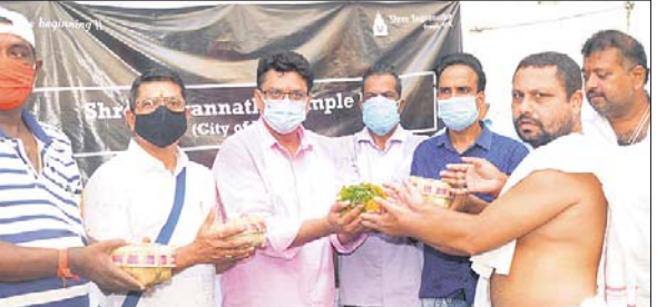
ମନ୍ଦିର କର୍ମକର୍ତ୍ତାଙ୍କୁ ସେବାୟତ ଛପ୍‌ସିତ ପ୍ରତିହାରୀ ମହାପ୍ରସାଦ ପ୍ରଦାନ କରୁଛନ୍ତି।

ମହାପ୍ରଭୁ ହେଉଛନ୍ତି ଜଗତର ଠାକୁର। ତାଙ୍କ ମାୟାରେ ବନ୍ଧା ସମଗ୍ର ବିଶ୍ୱ। ମହାପ୍ରଭୁଙ୍କ ପ୍ରତି ଗଭୀର ଆଶ୍ରା ଓ ବିଶ୍ୱାସ ରଖୁଥିବା ବହୁ ଜଗନ୍ନାଥପ୍ରେମୀ ବିଭିନ୍ନ ଦେଶରେ ରହିଛନ୍ତି। ଅନେକ ରାଷ୍ଟ୍ରରେ ପ୍ରତାପା ଓଡ଼ିଆ ଜଗନ୍ନାଥ ମନ୍ଦିର ଗଢ଼ି ପୂଜାର୍ଚ୍ଚନା କରୁଛନ୍ତି। କୋଟି କୋଟି ଓଡ଼ିଆଙ୍କ ଆରାଧ୍ୟ ଦେବତା ଶ୍ରୀଜଗନ୍ନାଥ ଏବେ ବ୍ରିଟେନ୍ (ୟୁକେ)ରେ ମଧ୍ୟ ପୂଜା ପାଇବେ। ଯୁକେଟ୍ ସିଟି ଅଫ୍ ବାଥରେ ମହାପ୍ରଭୁଙ୍କ ଭବ୍ୟ ମନ୍ଦିର ନିର୍ମାଣ ହେବ। ଏଥିପାଇଁ ସେଠାରେ ରହୁଥିବା କେତେଜଣ ଓଡ଼ିଆ-ଶ୍ରୀକ୍ଷେତ୍ର ଆସି ମହାପ୍ରଭୁଙ୍କ ବିଗ୍ରହ, ପୁଲ୍, ଚୁଲ୍ୟା ଓ ମହାପ୍ରସାଦ ନେଇଛନ୍ତି। ସିଟି ଅଫ୍ ବାଥରେ ରହୁଥିବା ଓଡ଼ିଆମାନେ ଏକାଠି ହୋଇ ଏହି ମନ୍ଦିର ନିର୍ମାଣ ପରିକଳ୍ପନା କରିଛନ୍ତି। ତେବେ ବିଭିନ୍ନ ବିଧି ବ୍ୟବସ୍ଥା ମଧ୍ୟରେ ଏହା ନିର୍ମାଣ କରାଯିବ ସେଥିଲାଗି ପରାମର୍ଶ ନେବାକୁ ମନ୍ଦିର କମିଟି କର୍ମକର୍ତ୍ତା