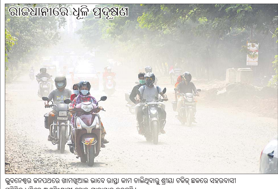
ରାଜଧାନୀରେ ଯୁକ୍ତି ପ୍ରଦର୍ଶଣ

ଫୁଲବାଣୀ ଅଫିସ/ବାଲିଗୁଡ଼ା (ଡି.ଏନ୍.ଏ), ୧୮.୧୦: କନ୍ଧମାଳ ଜିଲ୍ଲା ତୁମ୍ବୁଡ଼ିବନ୍ଧୁ ବ୍ଲକ୍ ବୁଦ୍ଧିପଦର ଘାଟିରୁ ରବିବାର ୨ ଯୁବକଙ୍କ ମୃତଦେହ ଉଦ୍ଧାର ହୋଇଛି।