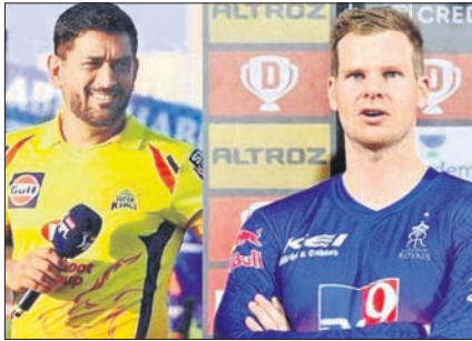
ମହେନ୍ଦ୍ର ସିଂ ଧୋନୀ ଓ ସ୍କ୍ୱିଜ୍ ସ୍ମିଥ୍।

ଆରୁଧ୍ୟାବି, ୧୮୧୦(ପି.ଟି.) ଚଳିତ ଇଣ୍ଡିଆନ୍ ପ୍ରିମିୟର ଲିଗ୍ (ଆଇପିଏଲ୍)ରେ ନିଜର ସ୍ଥିତି ବଜାୟ ରଖିବାକୁ ସଂଘର୍ଷ କରୁଥିବା ଦୁଇ ଦଳ ଚେନ୍ନାଇ ସୁପର କିଙ୍ଗ୍ସ ଓ ରାଜସ୍ଥାନ ରୟାଲ୍ସ ସୋମବାର ପୁଣିଫୁଲ୍ ହେବେ।