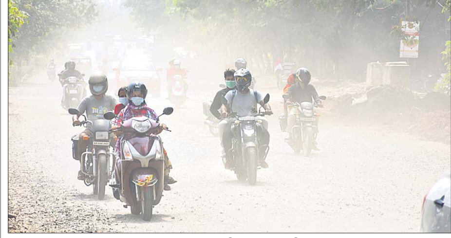
ଭୁବନେଶ୍ୱର ଜନପଥରେ ଖାମୋଶିଆଳି ଭାବେ ରାସ୍ତା କାମ ଚାଲିଥିବାରୁ ଶ୍ରୀଯା. ବିକଳ ଛକରେ ସହରବାସୀ ପ୍ରତିଦିନ ଧୂଳିରେ ଅଗଣିଷ୍ଠାସୀ ହୋଇ ଯାତାୟତ କରୁଛନ୍ତି।

ଇନୋଭେଶନ ଇନୋଭେଶନ ଇନୋଭେଶନ ପାଇଁ ରାଜ୍ୟର ବିଭିନ୍ନ ବିଶ୍ୱବିଦ୍ୟାଳୟ ତଥା ମହାବିଦ୍ୟାଳୟଗୁଡ଼ିକରେ ଗବେଷଣା ଚାଲିଛି।