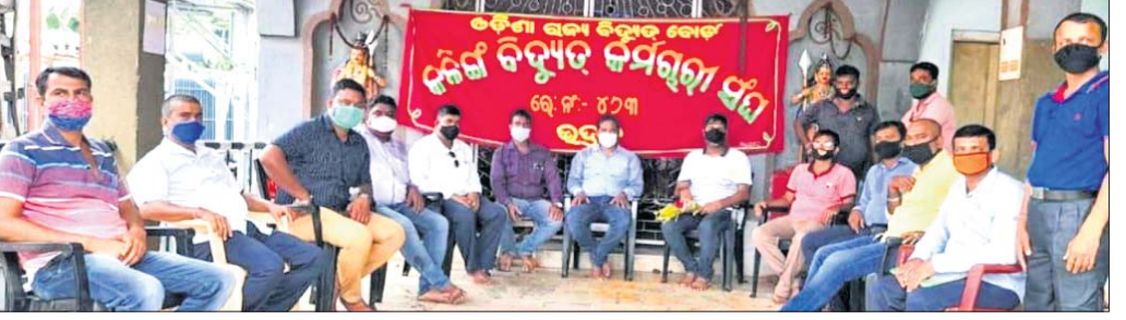
ବୈଠକରେ ଉପସ୍ଥିତ କର୍ମକର୍ତ୍ତା।