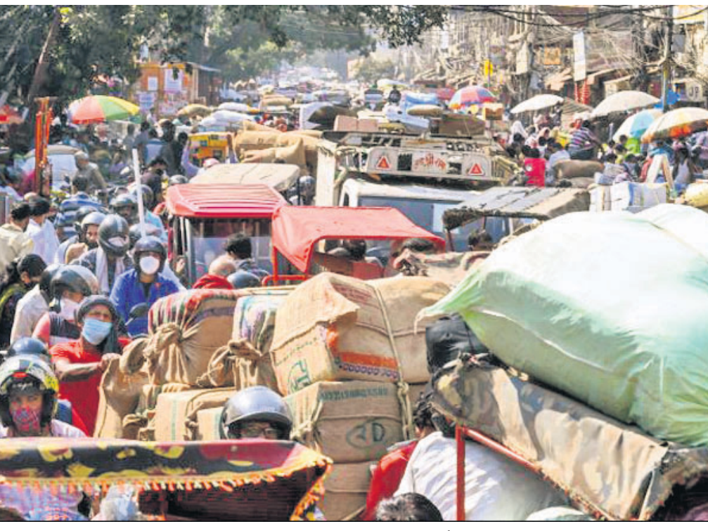
କରାଚୀରୁ: ନୂଆଦିଲ୍ଲୀର ଚାନ୍ଦିନୀ ଚୌକ ବଜାରରେ ପାର୍ବଣ ଲାଗି ଲୋକଙ୍କ ଭିଡ଼ ।

ଲିଭର ଉପାଧ୍ୟକ୍ଷା ମନ୍ତ୍ରୀମଣ୍ଡଳ ଶରିଫ ସଫରର ଲୁଚାଇ କରି ସୂଚନା ଦେଇଛନ୍ତି । ସେମାନେ ହୋଟେଲରେ ଥିବା ସମୟରେ ପୋଲିସ କର୍ମୀଙ୍କୁ ଚାଲି ଚାଲି କରାଯାଇଥିବା ସୂଚନା ପାଇଁ ସଫରକୁ ଚାଲି କରିଥିବା ମନ୍ତ୍ରୀମଣ୍ଡଳ କହିଛନ୍ତି । ପାଇଁ ସରକାରକୁ ହଟାଇବା ଲାଗି ଅଭିଯୋଗ କରାଯାଇଥିବାବେଳେ ଏହାକୁ ନେଇ ଇମ୍ରାନଙ୍କୁ ଚିନ୍ତା ବଢ଼ିବାରେ ଲାଗିଛି ।