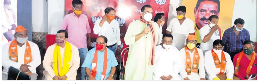
ମିଶ୍ରଙ୍କ ପର୍ବରେ ଉପସ୍ଥିତ ଭାଜପା କର୍ମକର୍ତ୍ତା।