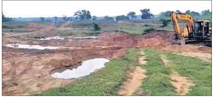
ବେଆଇନ ବାଲି ଉତ୍ତୋଳନ ପାଇଁ କେବିବିରେ କୁଳକୁ ସମତୁଲ୍ୟ କରାଯାଇଛି।

ଓଡ଼ିଶା, ପଶ୍ଚିମବଙ୍ଗ ଓ ଝାଡ଼ଖଣ୍ଡ ରାଜ୍ୟ ଦେଇ ପ୍ରବାହିତ ହେଉଛି ସୁବର୍ଣ୍ଣରେଖା ନଦୀ। ଏହି ନଦୀ ମୟୂରଭଞ୍ଜ ଜିଲ୍ଲାର ଭୁଇଁଚି ବ୍ଲକ୍ ମଧ୍ୟବେଳ ବନ୍ଦୀ ଯାଉଥିବା ବେଳେ କୁଳକ୍ଷୟ ଯୋଗୁ ଗାଁ ଗଣ୍ଡା ପ୍ରତି ବିପଦ ସାଜିଛି। ଫଳରେ ନଦୀକୂଳବାସୀ ଆତଙ୍କିତ ଅବସ୍ଥାରେ ଦିନ କାଟୁଥିବା ବେଳେ ବହୁ ଚାଷଜମି ବାଲିତର ହୋଇଯାଇଛି। ଆଡ଼ିବନ୍ଧ ନିର୍ମାଣ କରା ନ ଗଲେ ଆଗାମୀ କିଛି ବର୍ଷ ମଧ୍ୟରେ ଗୋଟିଏ କିମ୍ବା ଦୁଇଟି ଗ୍ରାମ ନଦୀଗର୍ଭରେ ଲୀନ ହେବ ବୋଲି ଗ୍ରାମବାସୀ ପ୍ରକାଶ କରିଛନ୍ତି।