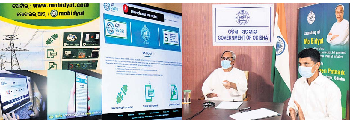
'ମୋ ବିଦ୍ୟୁତ୍' ପୋର୍ଟାଲ ଓ ମୋବାଇଲ ଆପ୍ କୁ ଶୁଭାରମ୍ଭ କରୁଛନ୍ତି ମୁଖ୍ୟମନ୍ତ୍ରୀ ନବୀନ ପଟ୍ଟନାୟକ । ନିକଟରେ ଅଛନ୍ତି ମୁଖ୍ୟମନ୍ତ୍ରୀଙ୍କ ସଚିବ (୫-ଟି) ଭି.କେ. ପାଞ୍ଚିଆନ ।