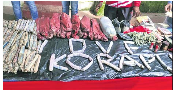
ଜବତ ହୋଇଥିବା ମାଓବାଦୀଙ୍କ ବିଚ୍ଛୋରକ ସାମଗ୍ରୀ।

୨,୪୯୭ଜଣ ଆକ୍ରାନ୍ତ ହୋଇଥିବାବେଳେ ସେପ୍ଟେମ୍ବର ୨୫ରେ ଦୈନିକ ସଂକ୍ରମଣ ୪୩୫୬ ଛୁଇଁଥିଲା। ଏହାପରଠାରୁ ସଂକ୍ରମଣ ଖସିବା ଆରମ୍ଭ କରିଥିଲା। ତେବେ ଶେଷ ୨୪ ଘଣ୍ଟାରେ ରାଜ୍ୟରେ ୧,୯୮୨ ନୂଆ ପଜିଟିଭ୍ ଚିହ୍ନଟ ହୋଇଥିବାବେଳେ ଖୋର୍ଦ୍ଧାକୁ ସର୍ବାଧିକ ୩୦୦, କଟକ ୧୪୫, ଅନୁଗୋଳ ୧୧୬ ଓ ମୟୂରଭଞ୍ଜ ୧୦୭ଜଣ ରହିଛନ୍ତି। ଅନ୍ୟସବୁ ଜିଲ୍ଲାରେ ଏହି ସଂଖ୍ୟା ଶହେ ତଳକୁ ରହିଛି ଓ ଗଜପତିରେ ସର୍ବନିମ୍ନ ୧୦ଜଣ ଚିହ୍ନଟ ହୋଇଛନ୍ତି। ଏହାକୁ ମିଶାଇ ଆକ୍ରାନ୍ତଙ୍କ ସଂଖ୍ୟା ୨,୭୦,୩୫୬ରେ ପହଞ୍ଚିଛି। ଅପରପକ୍ଷରେ ରାଜ୍ୟରେ ଆଉ ୧୭ଜଣ ଆକ୍ରାନ୍ତଙ୍କ ମରଣର ମୁହୂର୍ତ୍ତ ଘଟିଛି। ମୃତକଙ୍କ ମଧ୍ୟରେ ଭୁବନେଶ୍ୱର ଓ କଟକକୁ ୩ଜଣ ଲେଖାଏଁ ଥିବାବେଳେ ଖାରବୁଦ୍ଧା, ସୁବର୍ଣ୍ଣପୁରକୁ ୨ଜଣ ଲେଖାଏଁ, ବଲାଙ୍ଗୀର, ଜଗତସିଂହପୁର, ବଲାଙ୍ଗୀର, ନୂଆପଡ଼ା, ବୌଦ୍ଧ, ବରଗଡ଼ ଓ ମୟୂରଭଞ୍ଜକୁ ଜଣେ ଲେଖାଏଁ ରହିଛନ୍ତି। ଫଳରେ ରାଜ୍ୟରେ ମୋଟ କରୋନାଜନିତ ମୃତ୍ୟୁ ସଂଖ୍ୟା ୧,୧୫୨କୁ ବୃଦ୍ଧି ପାଇଛି। ସେହିଭଳି ରାଜ୍ୟରୁ ମୂଲ୍ୟ ୨୭୩୮୭୫ ଯୁଗ୍ମ ହୋଇଥିବା ଆରୋଗ୍ୟ ସଂଖ୍ୟା ୨,୪୯, ୫୭୫ ଛୁଇଁଛି।