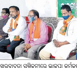
ଖବରଦାତା ସମ୍ମିଳନୀରେ ଭାଜପା କର୍ମକର୍ତ୍ତା।