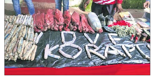
କବଚ ହୋଇଥିବା ମାଓବାଦୀଙ୍କ ବିସ୍ଫୋରକ ସାମଗ୍ରୀ।