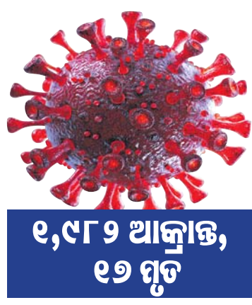
୧,୯୮୨ ଆକ୍ରାନ୍ତ, ୧୭ ମୃତ