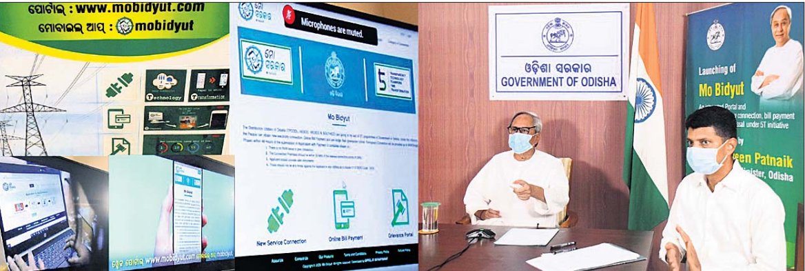
'ମୋ ବିଦ୍ୟୁତ୍' ପୋର୍ଟାଲ ଓ ମୋବାଇଲ ଆପ୍ କୁ ଶୁଭାରମ୍ଭ କରୁଛନ୍ତି ମୁଖ୍ୟମନ୍ତ୍ରୀ ନବୀନ ପଟ୍ଟନାୟକ । ନିକଟରେ ଅଛନ୍ତି ମୁଖ୍ୟମନ୍ତ୍ରୀଙ୍କ ସଚିବ (୫-ଟି) ଭି.କେ. ପାଞ୍ଜିଆନ ।