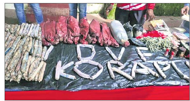
ଜବତ ହୋଇଥିବା ମାଓବାଦୀଙ୍କ ବିଚ୍ଛୋରକ ସାମଗ୍ରୀ