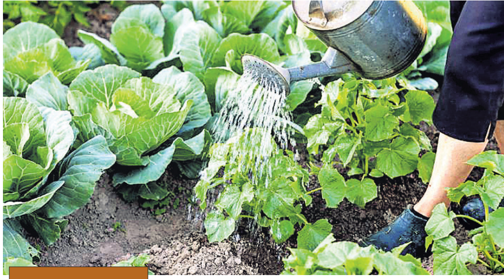
ପନିପରିବା ଚାଷର ତଳିଘରା ଓ ରୋପଣ ସମ୍ପର୍କରେ କେତୋଟି ଜାଣିବା କଥା...

ଛୋଟ ତଳିଘରାକୁ ସହଜରେ ପରିଚାଳନା କରାଯାଇପାରେ। ତଳିଘରା ପ୍ରସ୍ତୁତି ସମୟରେ କେତୋଟି ବିଷୟ ପ୍ରତି ଧ୍ୟାନ ଦେବା ଜରୁରୀ। ବିହନ ଠିକ୍ ଭାବରେ କ୍ରମ କରନ୍ତୁ। ତଳିଘରାରେ ମାଟି, ବାଲିଆ ବୋରସା ବା ବୋରସା ଓ ନିରପେକ୍ଷ ଅମ୍ଳତ୍ୱ ଥାଇ ମାଟିଗୁଣ୍ଡ ଉଚ୍ଚ ଓ ଜଳ ନିଷ୍କାସିତ ହେଉଥିବା ଆବଶ୍ୟକ। ତଳିଘରାକୁ ଛାମୁଡିଆ କରି ଘୋଡ଼ାଇ ରଖିଲେ ତାରା ଭଲ ବଢ଼ିଥାଏ। ତଳିଘରା ନିମନ୍ତେ ଜଳର ଉତ୍ସ ଥାଇ ତଳିଘରା ବାସସ୍ଥାନ ନିକଟରେ ରଖିଥିବା ଆବଶ୍ୟକ, ଯଦ୍ୱାରା ତଳି ଘରାର ତଦାରଖ ସହଜରେ କରାଯାଇପାରେ। ଦୁଇ-ତିନି ବର୍ଷ ପରେ ଜମି ବଦଳାନ୍ତୁ। ନ ହେଲେ ତଳିଘରାରେ ଚାରାଗୁଡିକ ପିମ୍ପି ଓ ସୁତ୍ରକୀଟଜନିତ ସଂକ୍ରମଣର ଆଶଙ୍କା ଅଧିକ ଥାଏ। ତଳିଘରାର ମାଟି ଖରା, ୨ ପ୍ରତିଶତ ଫର୍ମାଲିନ୍ ଦ୍ରବଣ ବା ଅନ୍ୟ ରାସାୟନିକ ପିମ୍ପିନାଶକ/କବକନାଶକ ଦ୍ୱାରା ମଞ୍ଜି ବୁଣିବାର ୧୦ଦିନ ପୂର୍ବରୁ ଉପଚାରିତ ହୋଇଥିଲେ ତାରା ଗଛ ସ୍ଥୂଳ ରହି ଭଲ ବଢ଼ିଥାଏ। ଫର୍ମାଲିନ୍ ଉପଚାର କରି