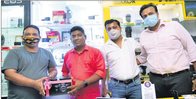
ଉଲ୍ଲେଖନୀୟ ପ୍ରଦର୍ଶନ କରିବା

ସୋନି ଇଣ୍ଡିଆ ପସରୁ ଆଲଫା ୭ ଏସ୍ ମିରରଲେସ୍ କ୍ୟାମେରାକୁ ଉନ୍ନତ କରି