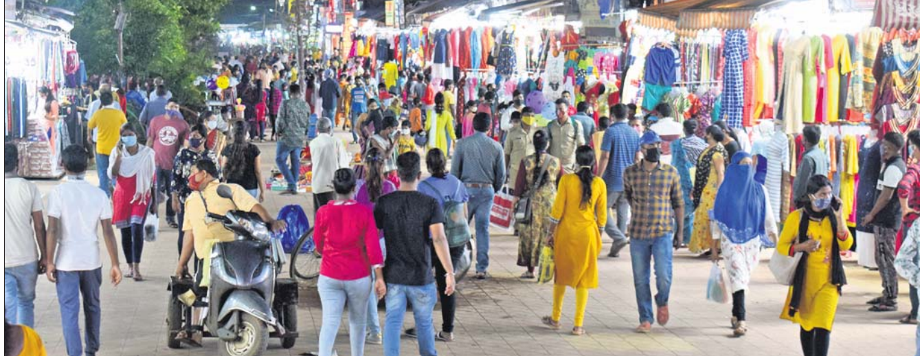
ପାର୍ବଣରେ ସଂକ୍ରମଣ ନିୟନ୍ତ୍ରଣ ପାଇଁ ପୋଲିସ୍ ଓ ପ୍ରଶାସନ ପକ୍ଷରୁ ସ୍ଵେଚ୍ଛାଳ ଡ୍ରାଇଭ୍ ସବ୍ସିଡି ଉପରେ ଧ୍ୟାନ ଦେଇ ଉପସ୍ଥିତ ରୁରୁବାର ହୋଇଥିବା ପ୍ରବଳ ଭିଡ଼।