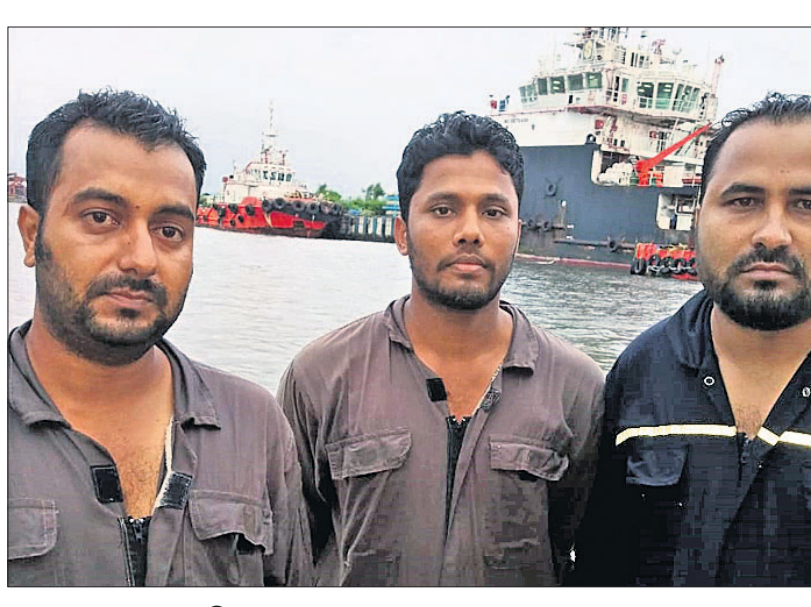
ଉଦ୍ଧାର ହୋଇଥିବା ୩ ନାବିକ।