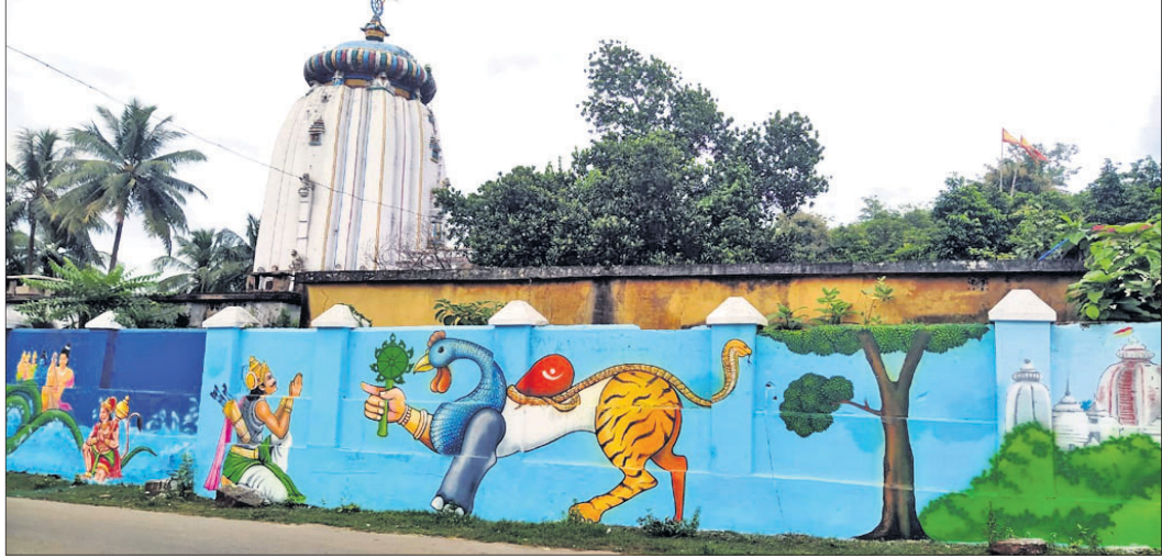
ଭଙ୍ଗାକାନ୍ଥରେ ଅଙ୍କାଯାଇଥିବା ଫଟୋଗ୍ରାଫି।

ନିଜ ପୋଖରୀକୁ ମାନସ ମାତକାମା ମାଛ ଧରୁଛନ୍ତି। ଚାରିପଟେ ବିଭିନ୍ନ ଫଳ ଗଛ ଲଗାଇଛନ୍ତି। ସେ। ହଂସ ଓ କୁକୁଡ଼ା ମଧ୍ୟ ପାଳିଛନ୍ତି। ରାଜକାମି ମୋର ପେଟା ଗୁଡ଼େଇଁ, ଚାଷ ମୋ କୁଳ ବେଉସା ବୋଲି ମାତକାମା କହିଛନ୍ତି।