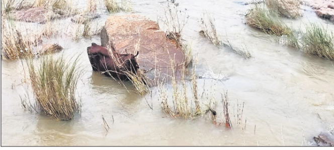
ନଦୀରେ ଅଟକି ରହିଥିବା ଗାଈ।