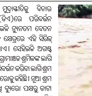
ଅଖାରେ ଲାଭରୁଣ୍ୟ ବାଣି ୨ ଅଞ୍ଚଳଘାଟିକର୍ମୀ ନଦୀ ପାର ହେବା ଦୃଶ୍ୟ।

ଗ୍ରହଣ କରିଥାଏ। ମୁମ୍ବାଇରୁ ବିଚାର କରି ମହଙ୍ଗା ଭଙ୍ଗା(ଡିଏ)ରେ ପରିବର୍ତ୍ତନ କରାଯାଇଥାଏ। ସେହିଭଳି ନ୍ୟୁନତମ ବେତନ ଧାର୍ଯ୍ୟ ଏବଂ ପରିବର୍ତ୍ତନ କ୍ଷେତ୍ରରେ ଏହି ସିରିଜ୍ ତାଗକୁ ବିଚାର କରାଯାଏ। ସେହିଭଳି ଅଗଷ୍ଟ ୨୦୨୧ ରୁଜ୍ଜା କୃଷି ଏବଂ ଗ୍ରାମାଞ୍ଚଳ ଶ୍ରମିକଙ୍କ ଲାଭି ସିପିଆଇ ମୂଳ ବର୍ଷକୁ ପରିବର୍ତ୍ତନ କରିବା ଲାଗି ଶ୍ରମ ମନ୍ତ୍ରାଳୟ ଲେବର ଟ୍ୟୁରୋକୁ କହିଛନ୍ତି। ନୂଆ ଶ୍ରମ କୋଡ୍ ନିଜର ଉତ୍ତର ଗୁରୁତ୍ୱରେ ପକ୍ଷରୁ ତାଗ ସଂଗ୍ରହ କରାଯିବ ବୋଲି ସେ ସୂଚନା ଦେଇଛନ୍ତି।