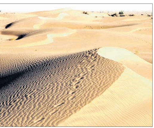
କୋଲକାତା ଆଇଆଇଏସ୍‌ସିଆର ବିଶେଷଜ୍ଞ ଦଳ ମିଳିତ ଭାବେ ଏହା ଉପରେ ଅଧିକ ଅନୁସନ୍ଧାନ କରି ରଖିଛନ୍ତି।

ନଦୀକୁଳରୁ ବିକାଶ ଆଡ଼କୁ ପାଦ କାଢ଼ିଥିଲା ମନୁଷ୍ୟ। ଚିରସ୍ରୋତା ନଦୀର ଧାରା ସଭ୍ୟତାର ବିକାଶରେ ଗ୍ରହଣ କରିଥିଲା ପ୍ରମୁଖ ଭୂମିକା। ମଣିଷ ପାଇଁ ଖାଦ୍ୟ, ବସ୍ତ୍ର, ବାସଗୃହ ହେଉ କି ପୋଷାପ୍ରାଣୀଙ୍କ ପାଇଁ ଖାଦ୍ୟ ସବୁକିଛି ମିଳୁଥିଲା ନଦୀକୁଳିଆ ଅଞ୍ଚଳରେ। ତେଣୁ ପୃଥିବୀର ପ୍ରାଚୀନ ସଭ୍ୟତା ମୁଣ୍ଡ ଟେକିଥିଲା ନଦୀ ତଟବର୍ତ୍ତୀ ଅଞ୍ଚଳରେ, ଯାହା ପରବର୍ତ୍ତୀ ସମୟରେ ଯୋଡ଼ି ହୋଇଥିଲା ଇତିହାସ ପର୍ଚ୍ଚରେ। ନିକଟରେ ରାଜସ୍ଥାନର ଥର୍ ମରୁଭୂମିରେ ୧ଲକ୍ଷ ୭୨ ହଜାର ବର୍ଷ ପୁରାତନ ଏକ ବିଲୁପ୍ତ ନଦୀର ଅବଶେଷ ଠାବ କରିଛନ୍ତି ବିଶେଷଜ୍ଞ। ପ୍ରାଗ୍-ସାହିତ୍ୟିକ ସମୟର ଏହି ନଦୀ ଉପରେ ଅଧିକ ଗବେଷଣା ହେଲେ ଅନେକ ତଥ୍ୟ ଲୋକଲୋଚନକୁ ଆସିପାରିବ ବୋଲି ବୈଜ୍ଞାନିକମାନେ ଆଶାବାଦୀ ଅଛନ୍ତି।