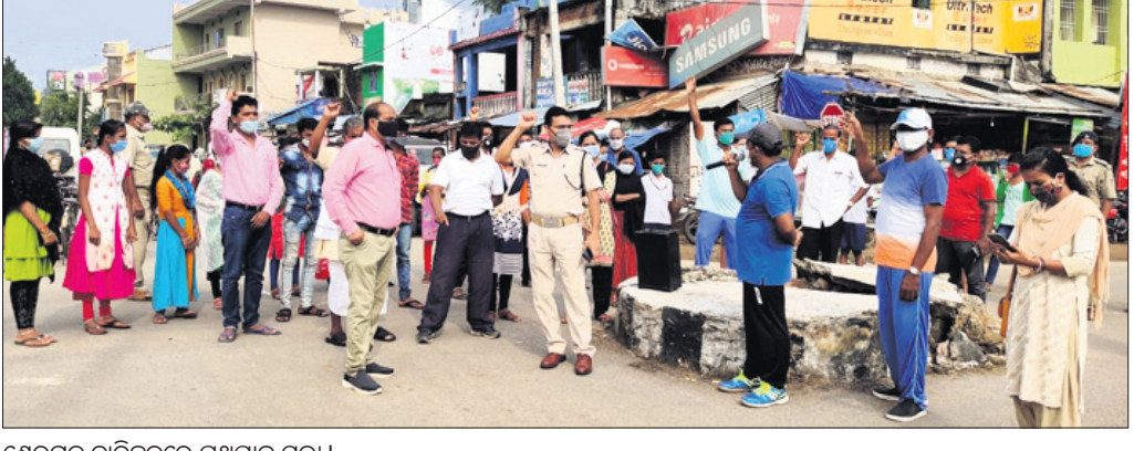
ଶେରଗଡ଼ ଚାରିକକରେ ପଥପ୍ରାନ୍ତ ସଭା।