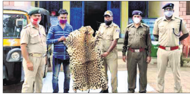
ଜବତ ବାଉଛାଇ ସହ ରିଟପ ଅଭିଯୁକ୍ତ।