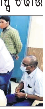
ସିଏସ୍‌ଓ ଅଫିସରେ ଭିଜିଲାନ୍ସ ଚଢ଼ାଉ କରୁଛି।