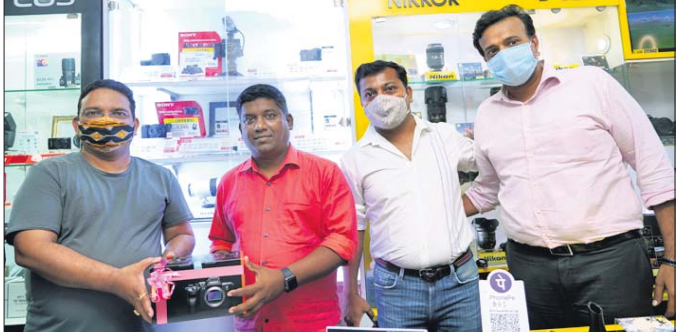
ଉଲ୍ଲେଖନୀୟ ପ୍ରଦର୍ଶନ କରିବା ଏଥିରେ ଏକ ଘଣ୍ଟାରୁ ଅଧିକ ସମୟ ପର୍ଯ୍ୟନ୍ତ ସିନେମା ଶୁଟି କରିହେବ। ଆଲ୍‌ଫା ୭ଏସ୍

ସୋନି ଇଣ୍ଡିଆ ପକ୍ଷରୁ ଆଲ୍‌ଫା ୭ଏସ୍ ମିଡ୍‌ରଏଞ୍ଜ୍ କ୍ୟାମେରାକୁ ଉନ୍ନତ କରି କରାଯାଇଛି। ଦେଶର ବିଭିନ୍ନ ପ୍ରାନ୍ତରେ ଏହି କ୍ୟାମେରା ଉପଲବ୍ଧ ହୋଇପାରିଥିବା ବେଳେ ଖୁବ୍‌ଶୀଘ୍ର ଓଡ଼ିଶା ବଜାରର ଗ୍ରାହକମାନେ ଏହାକୁ ଜିଣିବାର ସୁଯୋଗ ପାଇବେ ବୋଲି ସୋନି ପକ୍ଷରୁ ସୂଚନା ଦିଆଯାଇଛି। ଏହି ମଡେଲରେ ବିଭିନ୍ନ ପ୍ରକାର ଅତ୍ୟାଧୁନିକ ସୁବିଧା ରହିଛି। ସେହିଭଳି ପେସାଦାର ବ୍ୟବହାରକାରୀଙ୍କ ପାଇଁ ଏହି କ୍ୟାମେରା ବେଶ୍‌ ଉପଯୁକ୍ତ ଓ