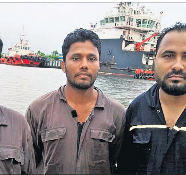
ଉଦ୍ଧାର ହୋଇଥିବା ୩ ନାବିକ।