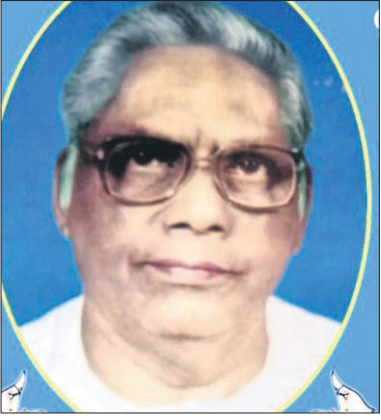
ଜନ୍ମ ୨୩.୧୦.୧୯୨୦ ମୃତ୍ୟୁ ୧୫.୦୩.୧୯୯୩