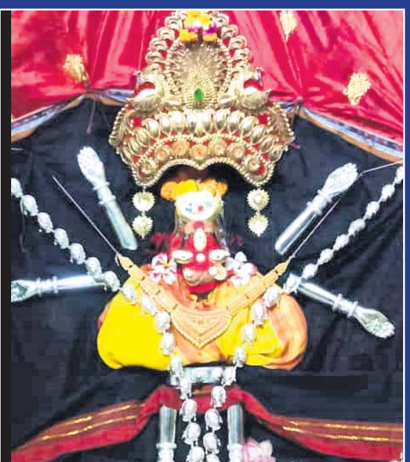
ବାଙ୍କୀ: ମା' ଚର୍ଚ୍ଚିକାଙ୍କ ମହିଷମର୍ଦ୍ଦିନୀ ବେଶ।