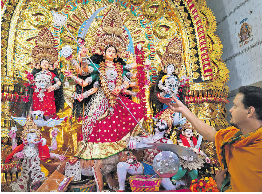
ଶୁକ୍ରବାର କଟକ ମଙ୍ଗଳାବାର ପୂଜାମଣ୍ଡପରେ ମା' ଦୁର୍ଗାଙ୍କ ମହାସପ୍ତମୀ ପୂଜା।