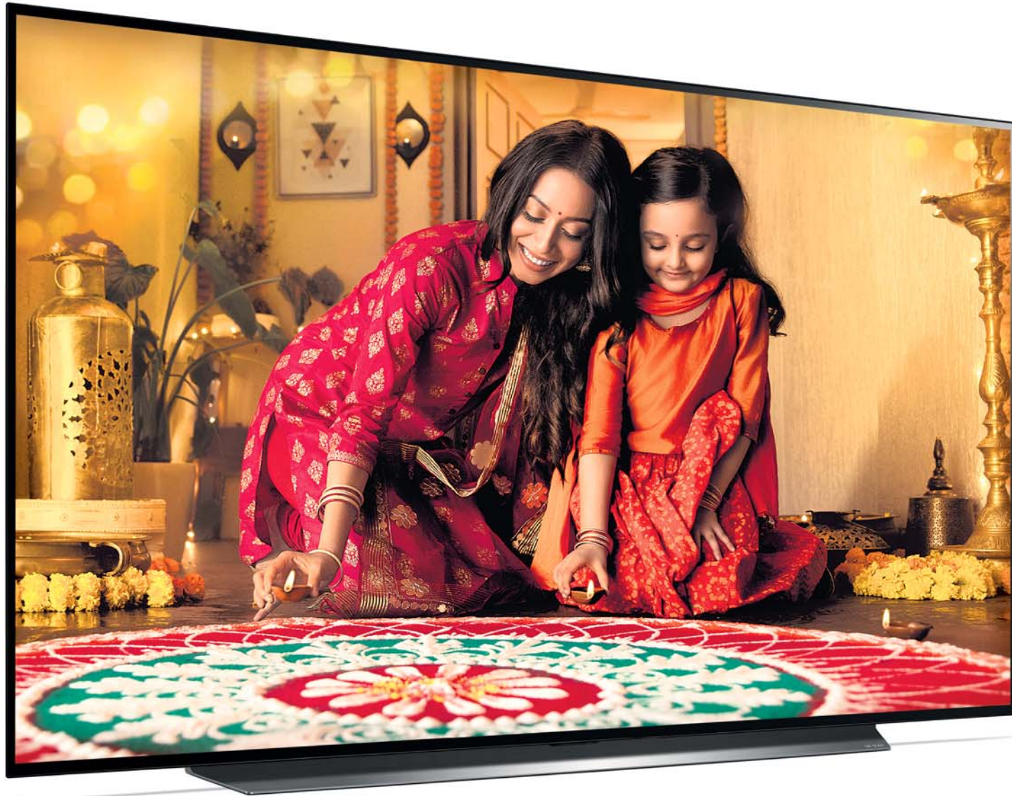
CX Series: 195cm (77) / 164cm (65) / 139cm (55)

Experience the best of Cinema, Sports & Gaming with the Power of SELF-LIT PIXELS