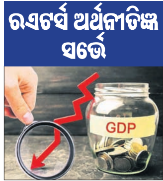
ରବର୍ଷ ଅର୍ଥନୀତିକ୍ଷ ସର୍ତ୍ତେ

କରୋନା ପାଇଁ ଘରୋଇ ବଜାରର ସ୍ଥିତି ଦେହାଳି ହୋଇ ରହିଛି। ଚଳିତ ଅର୍ଥନୀତିକ୍ଷ ବର୍ଷରେ ଭାରତୀୟ ଅର୍ଥ ବ୍ୟବସ୍ଥାର ମୋଟ ଘରୋଇ ଉତ୍ପାଦ (ଜିଡିପି) ରେକର୍ଡ ପ୍ରଭାବରେ ହ୍ରାସ ହେବ ବୋଲି ଆକଳନ କରାଯାଇଛି। ୨୦୨୦-୨୧ ଅର୍ଥନୀତିକ୍ଷ ବର୍ଷ ପ୍ରଥମ ଟ୍ରେମାସରେ ଜିଡିପିକୁ ୨୩.୯% ଝଟକା ଲାଗିଛି।