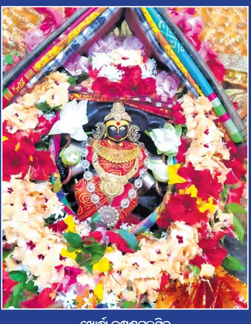
ଖୋର୍ଦ୍ଧା କୃଷଣପୁରସ୍ଥିତ ମା' ଉଗ୍ରତାରାଙ୍କ ଚାରା ବେଶ।