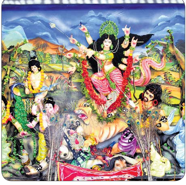
ଭୁବନେଶ୍ୱର ବଡ଼ଜବାଳ ଛକ ପୂଜାମଣ୍ଡପ।