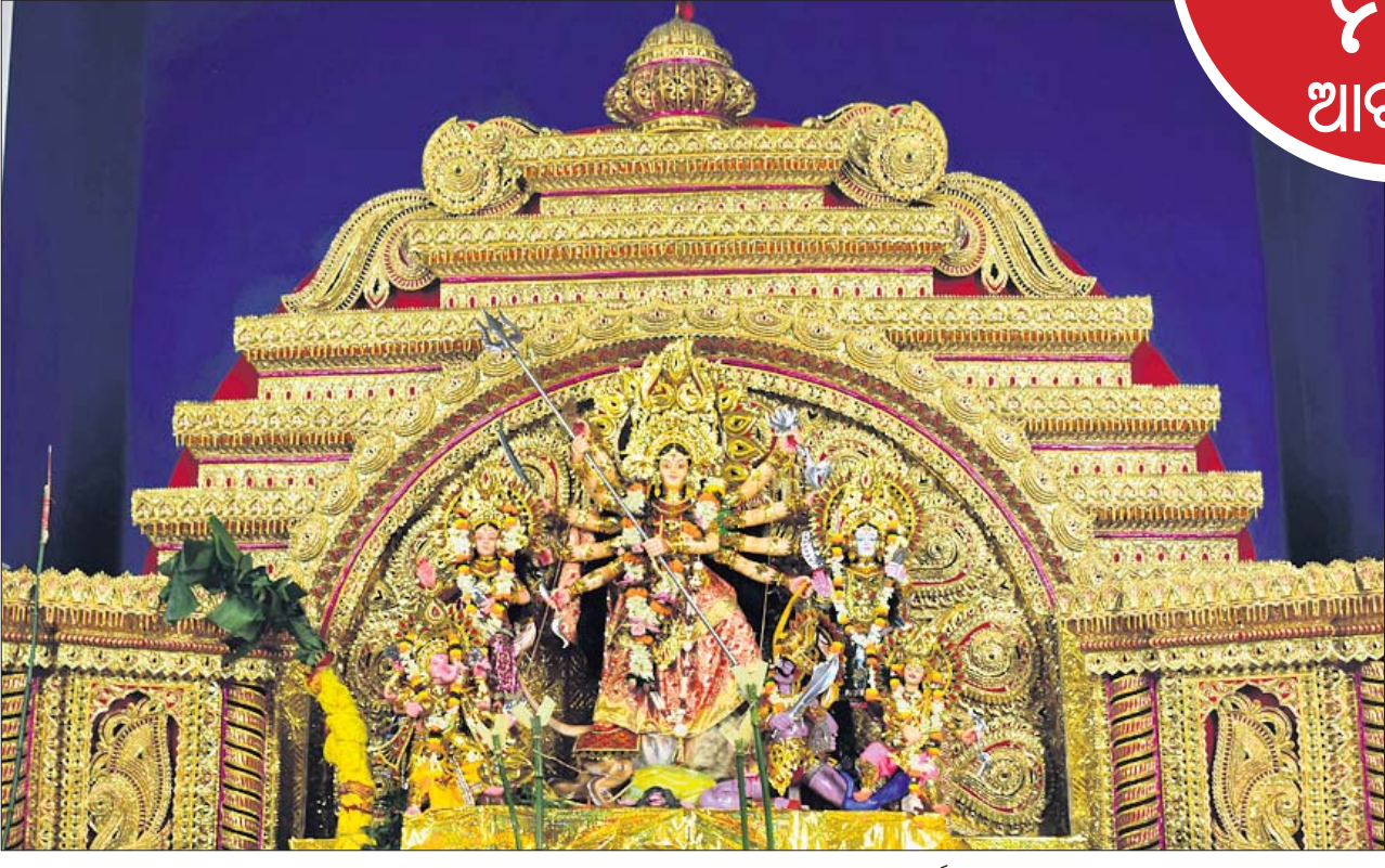
ଭୁବନେଶ୍ୱର ରସୁଲଗଡ଼ ମଣ୍ଡପରେ ପୂଜା ପାଉଥିବା ମା' ଦୁର୍ଗା।