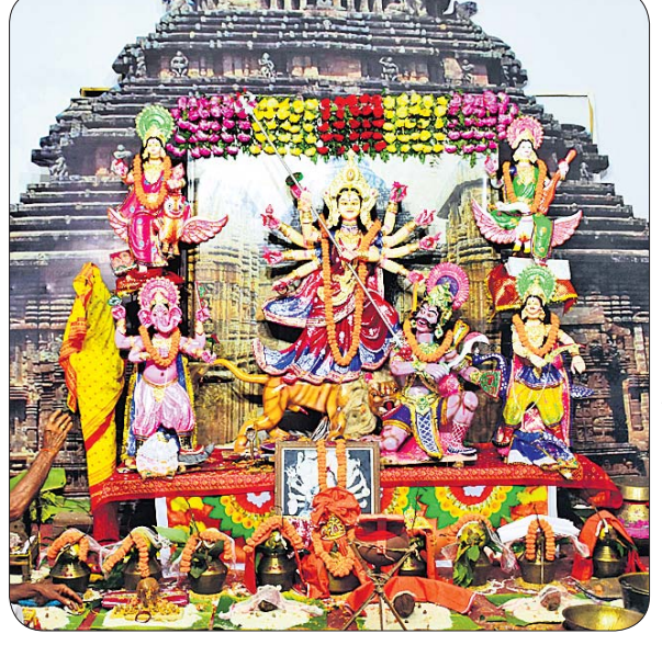
ଭୁବନେଶ୍ୱର ଭିଏସ୍‌ସ୍‌ଏ ନଗର ପୂଜାମଣ୍ଡପ।