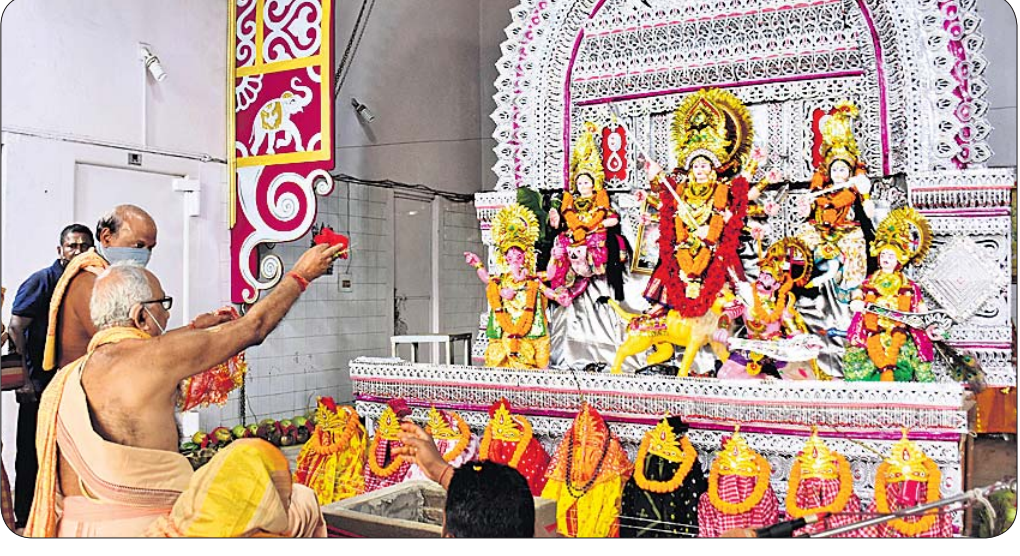
ଶହୀଦନଗର ମଣ୍ଡପରେ ମା'ଦୁର୍ଗାଙ୍କ ମହାସପ୍ତମୀ ପୂଜା।