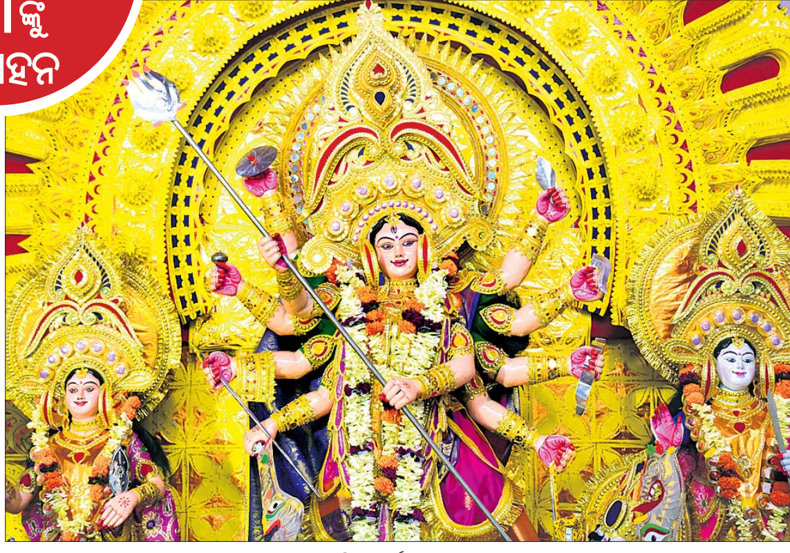
ବମିଖାଲ ଦୁର୍ଗା ମଣ୍ଡପ।