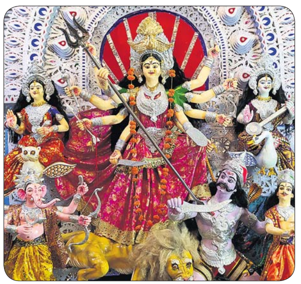
ହରିପୁର ବୋଳପୁଣ୍ଡାଲ ପୂଜାମଣ୍ଡପ।