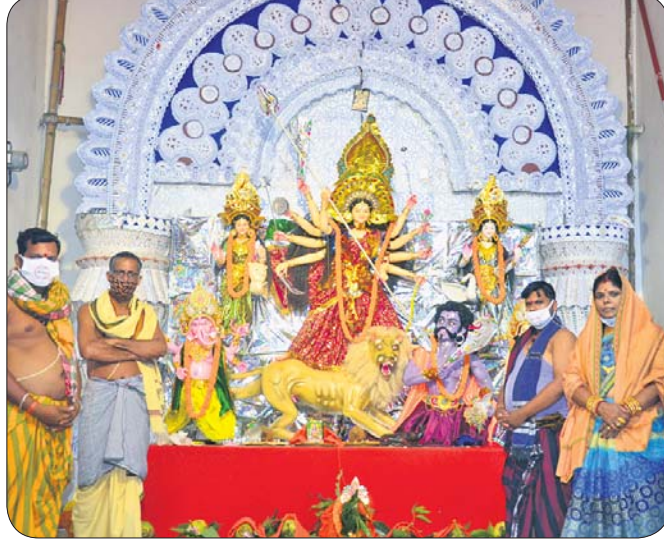
ଚନ୍ଦ୍ରଶେଖରପୁର ଡିଷ୍ଟ୍ରିକ୍ଟ ସେକ୍ଟର ଓ୍ବନର୍ସ ଆସୋସିଏଶନ ପକ୍ଷରୁ ଦୁର୍ଗାପୂଜା।