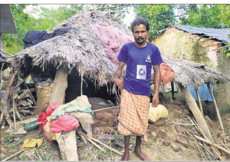
ସରକାରୀ ସହାୟତା ଅପେକ୍ଷାରେ ବରୀ ବୁକ୍ ବାଲିବିଲ ଗ୍ରାମର ବନ୍ୟାବିପଦ ମାଧ୍ୟମ ମିଳିକ।