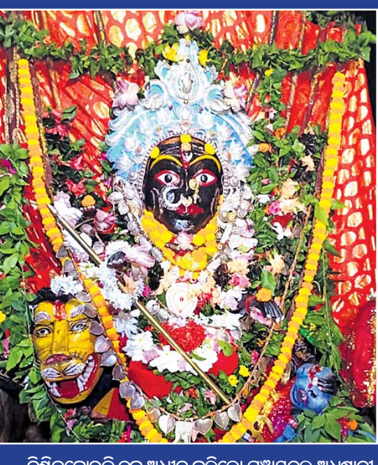
ନିଶ୍ଚିନ୍ତକୋଇଲି ବୁକ ଅଧୀନ କରିଲେ ପଞ୍ଚାୟତର ଅଧିଷ୍ଠାତ୍ରୀ ଦେବୀ ମା' ହରଚଣ୍ଡୀଙ୍କ ମହିଷମର୍ଦ୍ଦିନୀ ବେଶ।