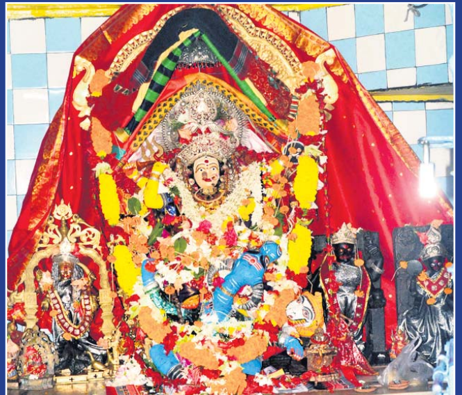
ପୁରୀ: ମା' ଶ୍ୟାମାକାଳୀଙ୍କ ସିଂହବାହିନୀ ବେଶ।