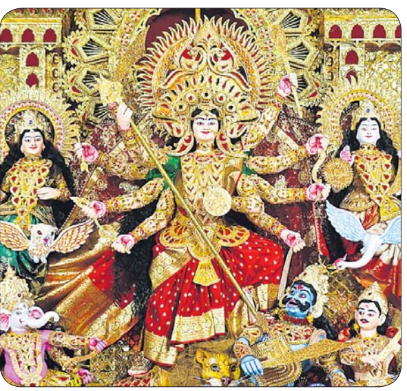
କଟକ କଲେଜ ଛକ ପୂଜାମଣ୍ଡପ।