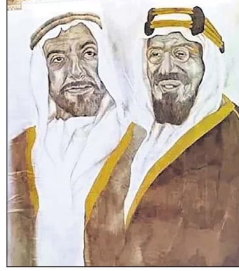
ନେଇ ତୁଳ ଜଣ ପ୍ରତ୍ୟକ୍ଷଦର୍ଶୀଙ୍କର ପ୍ରମାଣ ରଖିଛନ୍ତି । ଏହା ସହିତ ସେ ପେଣ୍ଟିଂ କରିବା ସମୟର ଏକ ରେକର୍ଡ଼ ବି ରଖିଛନ୍ତି । ତାଙ୍କର ଏହି ପେଣ୍ଟିଂର ନାଁ ରହିଛି 'ନାଶିକ୍ ୧' ଏବଂ ଏଥିପାଇଁ ଖର୍ଚ୍ଚ ହୋଇଛି ସାତେ ୪ କିଗ୍ରା କର୍ପି ।