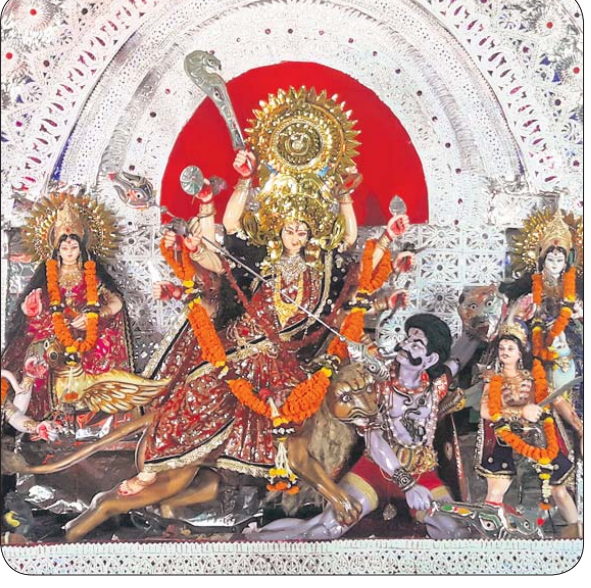
ଖୋର୍ଦ୍ଧା କୁବ ଓ ନିରାକାରପୁର କଲେଜ ଛକ ନିକଟରେ ପୂଜା ପାଉଥିବା ମା'ଙ୍କ ମୂର୍ତ୍ତୀ।