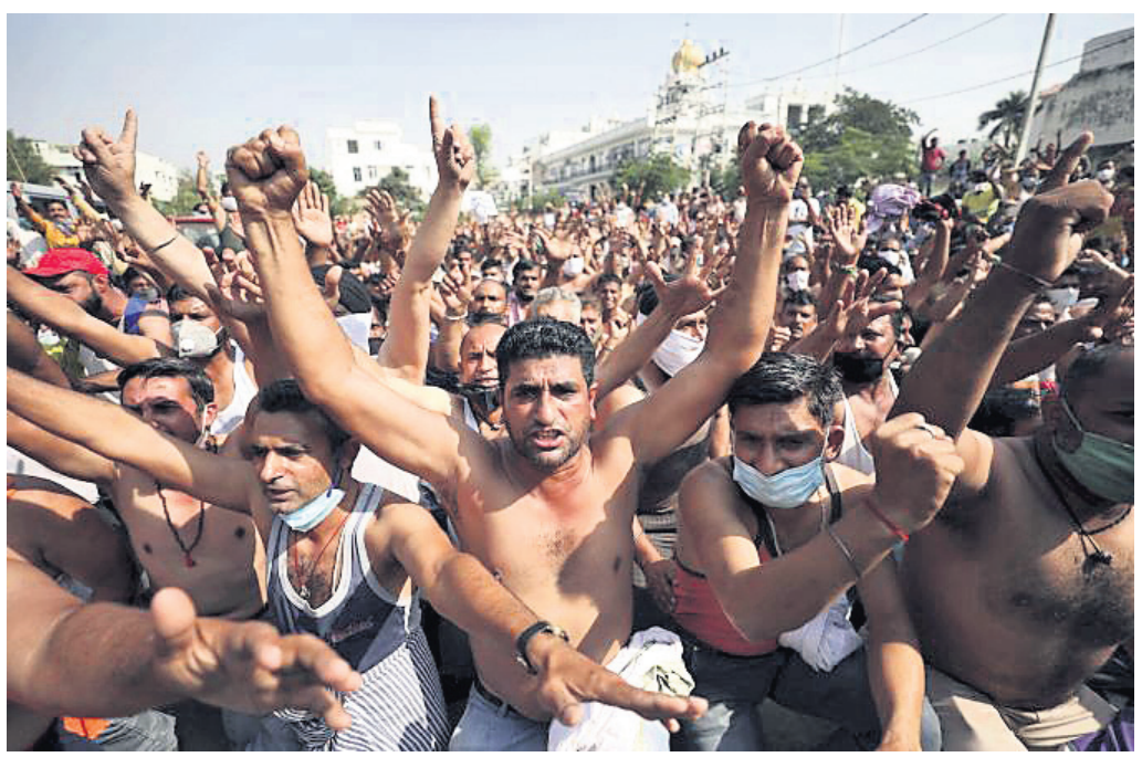
ଆମର ଦାବି ପୂରଣ କର: ପାଞ୍ଚାଠି ଡେଲେକ୍ସପେଣ୍ଡ ଡିପାର୍ଟମେଣ୍ଟର ଶ୍ରମିକମାନେ ବିଭିନ୍ନ ଦାବି ନେଇ ଜମ୍ମୁସ୍ଥିତ ଭାଜପା କାର୍ଯ୍ୟାଳୟ ଆଗରେ ବିଶୋଭ କରୁଛନ୍ତି।