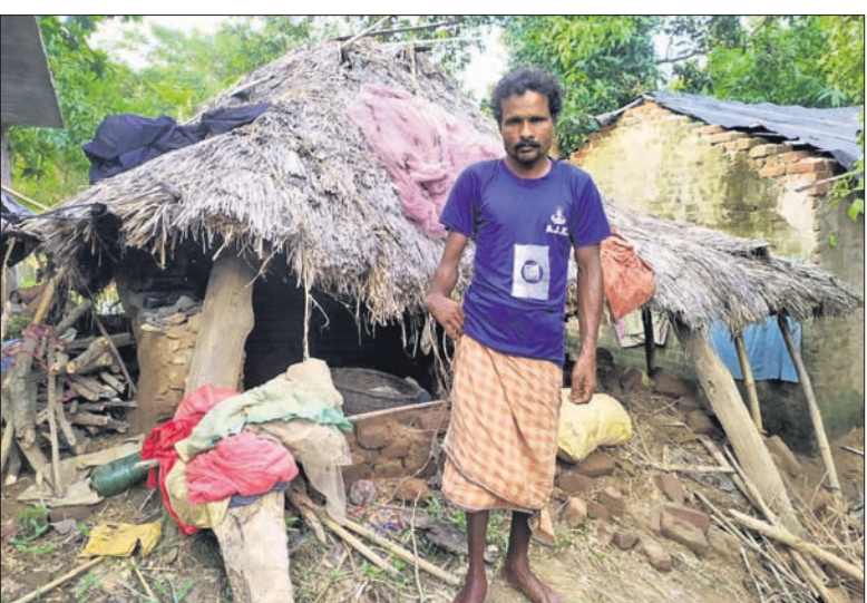
ସରକାରୀ ସହାୟତା ଅପେକ୍ଷାରେ ବରୀ ବୁକ୍ ବାଲିବିଲ ଗ୍ରାମର ବନ୍ୟାବିପଦ ମାଧ୍ୟମ ମିଳିକ।