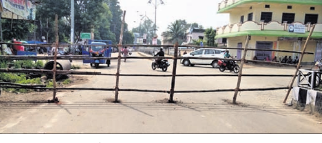
ଛତରଯାତ୍ରା ପାଇଁ ଭବାନୀପାଟଣା ସହରର ରାସ୍ତା ସିଲ୍ କରାଯାଇଛି।

ଏଥିପାଇଁ ଭବାନୀପାଟଣା ସହରରେ ୨୩ ତାରିଖ ରାତି ୧୨ ଟାକୁ ୨୫ ତାରିଖ ପର୍ଯ୍ୟନ୍ତ ୧୪୪ ଧାରା ଜାରି କରାଯାଇଛି। କେବଳ ମେଡିକାଲକୁ ଯିବା ପାଇଁ ବାହାରିଥିବା ଲୋକଙ୍କୁ ସହରକୁ ପ୍ରବେଶ ରହିଛି। ଛତର ସହିତ ପୂଜାର୍ଚ୍ଚନା ଓ ରାତିନାତି ପାଇଁ ମିଳିତ ପକ୍ଷରୁ ୨୦ ଜଣ, ଗୋଟିଏ ଗୁମ୍ଫା ଦଳ ଏବଂ ମିଳିତର ବାଜା ସମେତ ସମୁଦାୟ ୩୨ ଜଣ ଛତର ଯାତ୍ରାରେ ସାମିଲ ହେବେ। ପ୍ରତିବର୍ଷ ମା'ଙ୍କ ଛତରକୁ ଦର୍ଶନ କରିବା ପାଇଁ ରାଜ୍ୟ ତଥା ରାଜ୍ୟ ବାହାରୁ ଲକ୍ଷାଧିକ ଭକ୍ତଙ୍କ ସମାଗମ ହୋଇଥାଏ। ଶହ ଶହ ପଶୁ ପକ୍ଷୀ ବିକି ଡିଆଯାଇଥାଏ। ହେଲେ ଚଳିତ ବର୍ଷ ଦିନା ଭକ୍ତରେ ଛତରଯାତ୍ରା ହେବ। କେହି ବଳି ଦେଇ ପାରିବେ ନାହିଁ ବୋଲି ପ୍ରଶାସନ ପକ୍ଷରୁ କଟକଣା ଜାରି କରାଯାଇଛି।