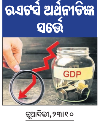
ରବର୍ଷ ଅର୍ଥନୀତିକ୍ଷ ସର୍ତ୍ତେ

କରୋନା ପାଇଁ ଘରୋଇ ବଜାରର ସ୍ଥିତି ଦେହାଳି ହୋଇ ରହିଛି। ଚଳିତ ଅର୍ଥନୀତି ବର୍ଷରେ ଭାରତୀୟ ଅର୍ଥ ବ୍ୟବସ୍ଥାର ମୋଟ ଘରୋଇ ଉତ୍ପାଦ (ଜିଡିପି) ରେକର୍ଡ ପ୍ରଭରେ ହ୍ରାସ ହେବ ବୋଲି ଆକଳନ କରାଯାଇଛି। ୨୦୨୦-୨୧ ଅର୍ଥନୀତି ବର୍ଷ ପ୍ରଥମ ଟ୍ରେମାସରେ ଜିଡିପିକୁ ୨୩.୯% ଝଟକା ଲାଗିଛି। ସେହିଭଳି ଦ୍ୱିତୀୟ ଏବଂ ତୃତୀୟ ଟ୍ରେମାସରେ ଜିଡିପି ଯଥାକ୍ରମେ ୧୦.୪% ଏବଂ ୫.୦% ହ୍ରାସ ହେବା ନେଇ ଆକଳନ ହୋଇଛି। ଜିଡିପି ୯.୫% ଖସିବ ବୋଲି ରିଜର୍ଭ ବ୍ୟାଙ୍କ ରିପୋର୍ଟରେ ପ୍ରକାଶ କରିଛି। ସେହିଭଳି ଜିଡିପି ହ୍ରାସ ୯.୮% ରହିବ ବୋଲି ଅନୁମାନ କରାଯାଇଛି। ଏହାକୁ ସମ୍ବେଦିତ ରିପୋର୍ଟରେ କହିଛନ୍ତି। ଏହାକୁ ସ୍ଥିତିରେ ଜିଡିପି ୧୦%ରୁ ଅଧିକ ଖସିବ ବୋଲି ରବର୍ଷ ଅର୍ଥନୀତିକ୍ଷ ମତ ପ୍ରକାଶ କରିଛନ୍ତି। ଭାରତୀୟ ଅର୍ଥ ବ୍ୟବସ୍ଥାକୁ ଏହା ସବୁଠାରୁ ବଡ଼ ଧରଣର ଝଟକା ବୋଲି ଏହି ରିପୋର୍ଟରେ କୁହାଯାଇଛି। ୨୦୧୯-୨୦୨୦ରେ ଜିଡିପି ୯% ଏବଂ ୨୦୨୨-୨୩ରେ ୫.୭% ରହିବା ନେଇ ଆକଳନ କରାଯାଇଛି। ସେହିଭଳି ଜିଡିପି କୋଭିଡ୍ ପୂର୍ବସ୍ଥରୁ