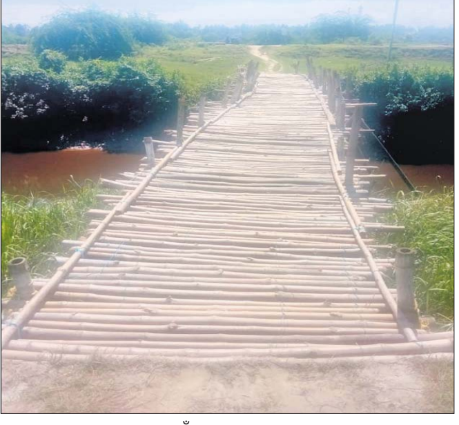
ରୁଡ଼ାବଳଙ୍କ ନଦୀ ଉପରେ ଥିବା ବାଉଁଶ ଯୋଲ।

ବାଲେଶ୍ୱର ଜିଲ୍ଲା ସଦର ବ୍ଲକ ପରିସୀମା ପ୍ରାୟତଃ ୯୯'। ଷାଠି ନନ୍ଦଈ (ଜଙ୍ଗଲଦେବି) ଓ ୬୯'। ଷାଠି କନ୍ୟାକଦଳା (ବଉଳଦେବୀ) ଗ୍ରାମର ଦୁଇଟି ପରିସ୍ଥିତି ସାଧାରଣତଃ ୭୨ବର୍ଷ ପରେ ମଧ୍ୟ ସୁଧୁରି ନାହିଁ। ଗ୍ରାମକୁ ରାସ୍ତା ନ ଥିବାବେଳେ ନଦୀ ପାରି ହେବା ପାଇଁ ଗ୍ରାମ ଲୋକଙ୍କ ଦ୍ୱାରା ପ୍ରସ୍ତୁତ ହୋଇଥିବା ଏକମାତ୍ର ବାଉଁଶ ଯୋଲ ହିଁ ଭରସା। ସାମାନ୍ୟ ବନ୍ୟା ଆସିଲେ ସମସ୍ତ ଜୁଆର ଗ୍ରାମରେ ଲହରି ଖେଳେ। ଜଳବନ୍ୟାରେ ବୁଝନ୍ତି ଗ୍ରାମବାସୀ। କୌଣସି ପ୍ରଶାସନିକ ଅଧିକାରୀ ଓ ରାଜନେତା ସେମାନଙ୍କ ସୁହାରି ଶୁଣନ୍ତି ନାହିଁ। ଏଥିରେ ଅତିଷ୍ଟ ହୋଇ ଉଚ୍ଚ ଦୁଇ ଖର୍ଚ୍ଚଦାୟୀ ଆସନ୍ତା ବାଲେଶ୍ୱର ବିଧାନସଭା ନିର୍ବାଚନମଣ୍ଡଳୀର ଉପନିର୍ବାଚନରେ ଭୋଟ ବର୍ଜନ ଲାଗି ନିଷ୍ପତ୍ତି ନେଇଛନ୍ତି। ଜଙ୍ଗଲଦେବି ସାହିର ଲୋକେ ଦୀର୍ଘଦିନ ଧରି ରୁଡ଼ାବଳଙ୍କ ନଦୀ ଉପରେ ଆସୁଛନ୍ତି ଓ ଅଗ୍ନିଶମ ସେବା ପହଞ୍ଚି ପାରୁନା। ଗ୍ରାମର ରାସ୍ତା ପ୍ରତ୍ୟେକ ବର୍ଷ ବନ୍ୟାରେ ନଷ୍ଟ ହୋଇଥାଏ। ବାରମ୍ବାର ରୁଡ଼ାବଳଙ୍କ ନଦୀ ପାରି ହେବାକୁ ସେମାନେ ଅଗ୍ନିଶମ ସେବା ପହଞ୍ଚି ପାରୁନା। ଗ୍ରାମର ରାସ୍ତା ପ୍ରତ୍ୟେକ ବର୍ଷ ବନ୍ୟାରେ ନଷ୍ଟ ହୋଇଥାଏ। ବାରମ୍ବାର ରୁଡ଼ାବଳଙ୍କ ନଦୀ ପାରି ହେବାକୁ