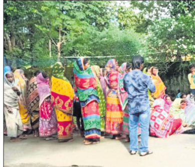
ଫରେଷ୍ଟ କାର୍ଯ୍ୟାଳୟ ସମ୍ମୁଖରେ ଲୋକେ ପ୍ରତିବାଦ କରୁଛନ୍ତି।

ଶିକାରୀ ଭାବି ବନ ବିଭାଗ କର୍ମଚାରୀମାନେ ଜଣେ ମୁରକଙ୍କୁ ମାଡ଼ ମାରି ହତ୍ୟା କରିଥିବା ଅଭିଯୋଗ ହୋଇଛି। ଏହାର ପ୍ରତିବାଦରେ ମୟୂରଭଞ୍ଜ ଜିଲ୍ଲା କମିଶ୍ନରୀ ରେଞ୍ଜ ଅଧୀନ ପୋଡ଼ାଡ଼ିଆ ଫରେଷ୍ଟ କାର୍ଯ୍ୟାଳୟ ସମ୍ମୁଖରେ ମୃତଦେହ ରଖି ଗୁମାସ୍ତା ମନ୍ଦିରକୁ ଗ୍ରାମବାସୀ ଓ ମୃତକଙ୍କ ପରିବାର ଲୋକେ ଧାରଣା ଦେଇଥିଲେ।