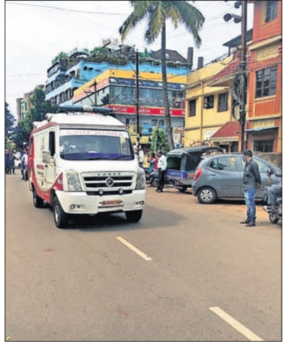
ରୋଗୀକୁ ନେଇ ଯାଉଥିବା ଆୟୁଲାଗୁ