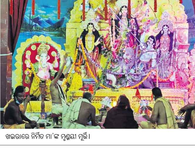
ଖଇରାରେ ନିର୍ମିତ ମା'ଙ୍କ ମୂର୍ତ୍ତୀ ପୂଜା।

ମହାମାରୀ କରୋନା ଲାଗି ଚଳିତବର୍ଷ ରାବଣପୋଡ଼ି ମହୋତ୍ସବକୁ ସ୍ମୃତିଚ ରଖାଯାଇଛି। ଶୁକ୍ରବାର ରାବଣପୋଡ଼ି ମହୋତ୍ସବ କର୍ମି ପକ୍ଷରୁ ଏକ ବୈଠକ କରାଯାଇ ଏହି ନିଷ୍ପତ୍ତି ନିଆଯାଇଥିଲା। ଏଥିରେ କାର୍ଯ୍ୟକାରୀ ସଭାପତି ଲକ୍ଷ୍ମୀନାରାୟଣ ମହାନ୍ତିଙ୍କ ଅଧିକାରୀ ଦ୍ୱାରା ବିଷୟ