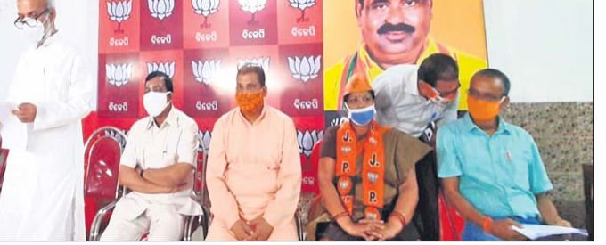
ମିଶ୍ରଙ୍କ ପର୍ବରେ କେନ୍ଦ୍ର ମନ୍ତ୍ରୀ ପ୍ରତାପ ମିଶ୍ରଙ୍କ ଓ ଅନ୍ୟମାନେ।