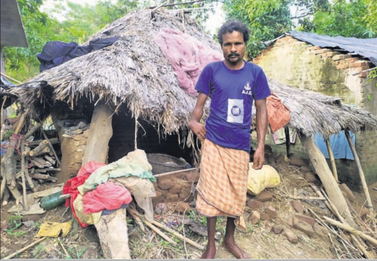
ସରକାରୀ ସହାୟତା ଅପେକ୍ଷାରେ ବରୀ ବୁକ୍ ବାଲିବିଲ ଗ୍ରାମର ବନ୍ୟାବିପଦ ମାଧ୍ୟମ ମିଳିକ।