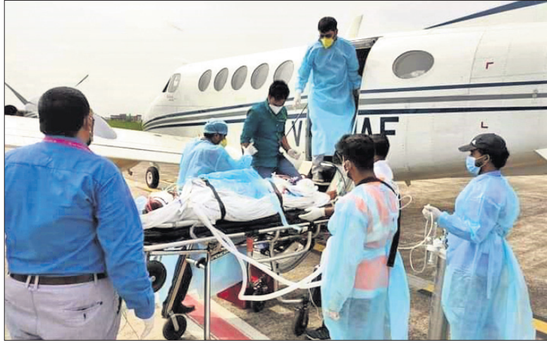
ବିମାନବନ୍ଦରରେ ଏୟାର ଆୟୁଲାଗୁକୁ ରୋଗୀକୁ ନିଆଯାଉଛି।