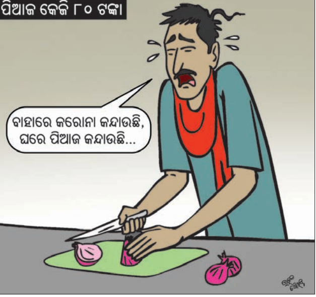
ବାହାରେ କରୋନା କନ୍ଦାଉଛି, ଘରେ ପିଆଜ କନ୍ଦାଉଛି...