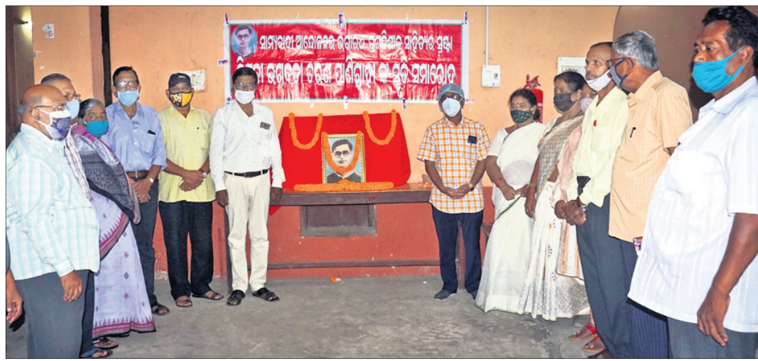
ଭଗବତୀ ଚରଣ ପାଣିଗ୍ରାହୀଙ୍କ ଫଟୋଚିତ୍ର ନିକଟରେ ଶ୍ରଦ୍ଧାଞ୍ଜଳି ଅର୍ପଣ କରିଥିବା ବ୍ୟକ୍ତିଗଣ ।