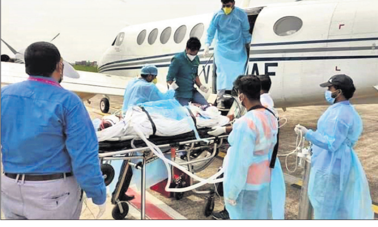
ବିମାନବନ୍ଦରରେ ଏୟାର ଆୟୁଲ୍ଲାଦୁକୁ ରୋଗୀଙ୍କୁ ନିଆଯାଇଛି।