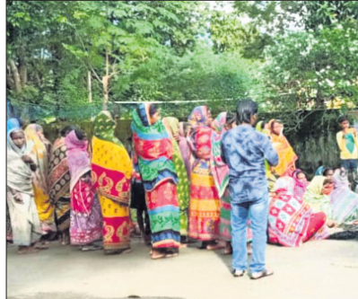
ଫରେଷ୍ଟ କାର୍ଯ୍ୟାଳୟ ସମ୍ମୁଖରେ ଲୋକେ ପ୍ରତିବାଦ କରୁଛନ୍ତି।

ଶିକାରୀ ଭାବି ବନ ବିଭାଗ କର୍ମଚାରୀମାନେ ଜଣେ ଯୁବକଙ୍କୁ ମାଡ଼ ମାରି ହତ୍ୟା କରିଥିବା ଅଭିଯୋଗ ହୋଇଛି। ଏହାର ପ୍ରତିବାଦରେ ମୟୂରଭଞ୍ଜ ଜିଲ୍ଲା କମିସନର ରେଞ୍ଜି ଅଧୀନ ପୋଡ଼ାଡ଼ିହା ଫରେଷ୍ଟ କାର୍ଯ୍ୟାଳୟ ସମ୍ମୁଖରେ ମୃତଦେହ ରଖି ଗ୍ଲାନାୟ ନିକ୍ଷୁବ ଗ୍ରାମବାସୀ ଓ ମୃତକଙ୍କ ପରିବାର ଲୋକେ ଧାରଣା ଦେଇଥିଲେ।