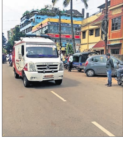
ରୋଗୀଙ୍କୁ ନେଇ ଯାଉଥିବା ଆୟୁଲ୍ଲାଦୁ