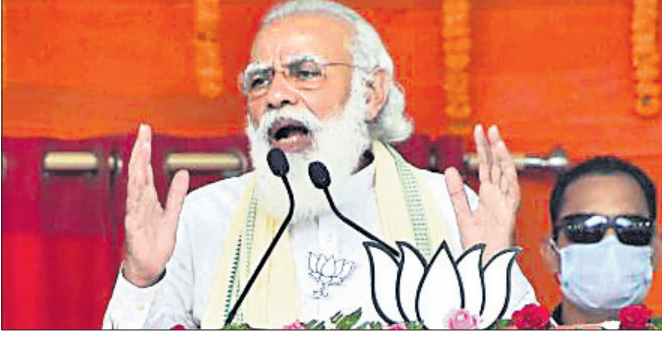
■ ବିହାରରେ ପ୍ରଧାନମନ୍ତ୍ରୀଙ୍କ ନିର୍ବାଚନ ପ୍ରଚାର ■ କଂଗ୍ରେସ-ଆରଜେଡି ଉପରେ ବର୍ଷିଲେ

ପ୍ରଧାନମନ୍ତ୍ରୀ ନରେନ୍ଦ୍ର ମୋଦି ଶୁକ୍ରବାର ବିହାରର ୩୮ଟି ସ୍ଥାନରେ ନିର୍ବାଚନ ରାଲି କରି ଭୋଟରଙ୍କୁ ମନାଇବା ଲାଗି ପ୍ରୟାସ କରିଛନ୍ତି। ବିହାରର ସାଧାରଣ, ଗୟା ଓ ଭାଗଲପୁରରେ ସେ ବିରୋଧୀ କଂଗ୍ରେସ ଓ ଆରଜେଡି ଉପରେ ବର୍ଷିଛନ୍ତି।