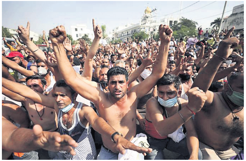
ଆମର ଦାବି ପୂରଣ କର: ପାଞ୍ଚାଉଁ ତେଲେଲପମେଷ୍ଟ ଡିପାର୍ଟମେଣ୍ଟର ଶ୍ରମିକମାନେ ବିଭିନ୍ନ ଦାବି ନେଇ ଜମ୍ମୁସ୍ଥିତ ଭାଜପା କାର୍ଯ୍ୟାଳୟ ଆଗରେ ବିଶୋଭ କରୁଛନ୍ତି।