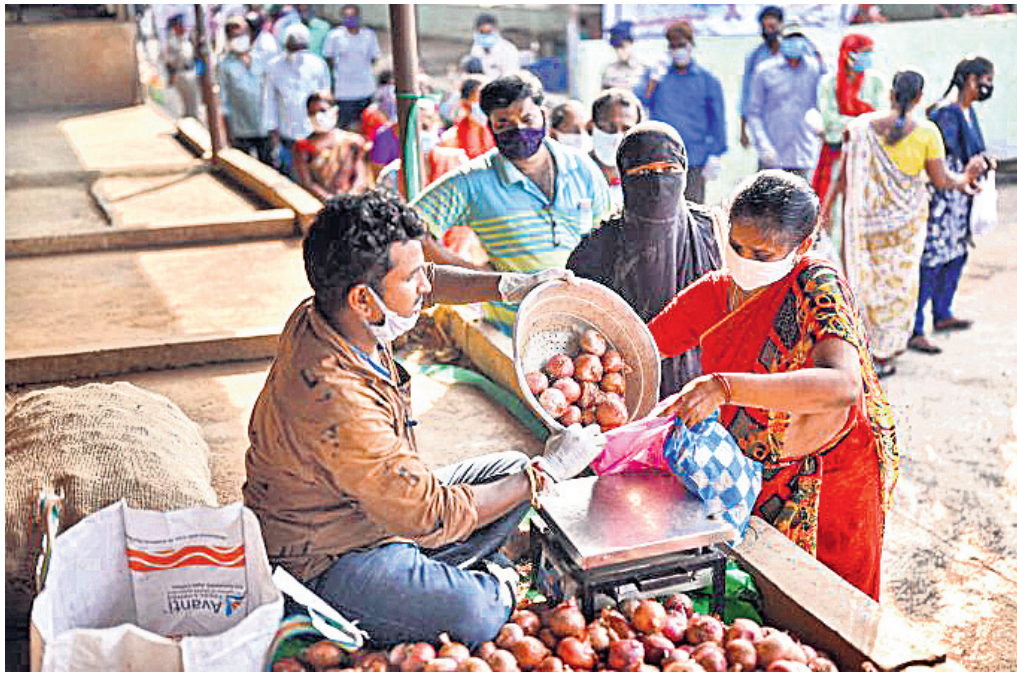
ପିଆଳ ଦର ଆକାଶକୁଆଁ: ସାରା ଦେଶରେ ପିଆଳ ଦର କିଲୋ ପିଛା ୮୦ରୁ ୧୦୦ ଟଙ୍କାରେ ପହଞ୍ଚିଥିବାବେଳେ ବିକୟଖିଡ଼ାର ଏକ ବଜାରରେ ରିହାତି ମୂଲ୍ୟ ୪୦ ଟଙ୍କାରେ ଦିଆଯାଉଛି।

ପାଟଣା, ୨୩।୧୦: ଗୋଷାଠ୍ୟ ଦୁର୍ଗତି ମାମଲାରେ ଫସିଥିବା ଆରଜେଡି ସୁପ୍ରିମୋ ଲାଲୁପ୍ରସାଦ ଯାଦବ ନଭେମ୍ବର ୯ରେ ଜାମିନ ପାଇ କେଲଗୁ ମୁକ୍ତିକିବେ। ଏବେ ଲାଲୁପ୍ରସାଦ ରାଜି କେଲେ ଅଛନ୍ତି।