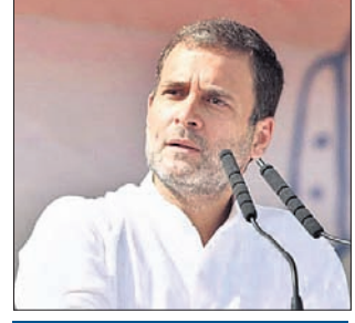
ପ୍ରଧାନମନ୍ତ୍ରୀଙ୍କୁ ରାହୁଲଙ୍କ ପ୍ରଶ୍ନ

ବିହାରରେ ପ୍ରଚାର ମଇଦାନକୁ ଓହ୍ଲାଇଥିବା କଂଗ୍ରେସ ନେତା ରାହୁଲ ଗାନ୍ଧୀ ପ୍ରଧାନମନ୍ତ୍ରୀ ନରେନ୍ଦ୍ର ମୋଦିଙ୍କୁ ସିଧା ଗାଁରେ କରିଛନ୍ତି। ଲଦାଖରେ ଚାଇନା କୋରକ୍ସରଦସ୍ତ ଭାରତର ଜାଗାକୁ ମାଡ଼ିବିହିଛି।