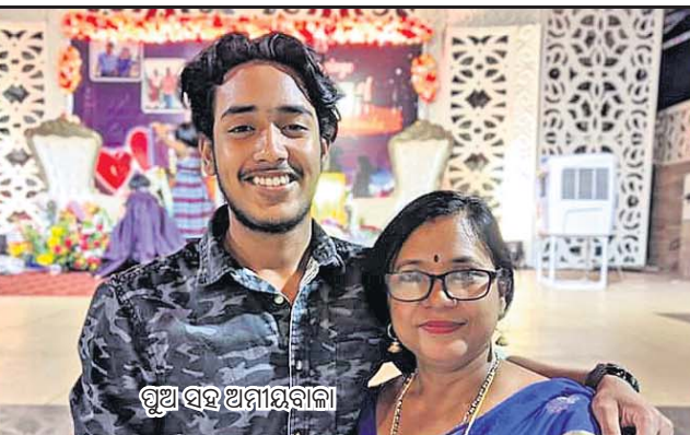
ପୁଅ ସହ ଅମାୟବାଳା