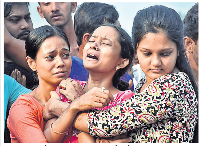
ପଶ୍ଚିମବଙ୍ଗର ମୁର୍ଦ୍ଦିବାବାଦୀମାନଙ୍କୁ ବେଲଗାଙ୍ଗରେ ଦୁର୍ଗା ମୂର୍ତ୍ତି ଉଦ୍‌ଘାଟନ ବେଳେ ୫ ଜଣ ବ୍ୟକ୍ତି ଭାସିଯାଇଛନ୍ତି। ଜଣେ ମୃତକଙ୍କ ପରିବାର ଦୁଃଖରେ ଭାଙ୍ଗିପଡ଼ିଛି।

ଗତବର୍ଷ ଅଗଷ୍ଟରେ ଅନୁଚ୍ଛେଦ ୩୭୦ ଏବଂ ୩୫୪ ଉଲ୍ଲେଖ ପୂର୍ବକ ଅପ୍ରାପ୍ୟ କଳ୍ପ-କଣ୍ଠୀର ଗୁରୁତ୍ୱ ଘାତର ସମ୍ପର୍କ କିଣିପାରୁ ନ ଥିଲେ। ବର୍ତ୍ତମାନର ଏହି ସଂଶୋଧନ ବଳରେ ସେମାନଙ୍କୁ ଉକ୍ତ କେନ୍ଦ୍ରଶାସିତ ଅଞ୍ଚଳରେ ଜମି କିଣିବାର ସୁଯୋଗ ମିଳିବ। ତେବେ କୃଷିଜମିକୁ ଅଣକୃଷି ଜମିରେ ପରିବର୍ତ୍ତନ କରିବାକୁ ଅନୁମତି ଦିଆଯାଇନାହିଁ ବୋଲି ଉପରାଜ୍ୟପାଳ ମନୋଜ ସିଂହା କହିଛନ୍ତି।