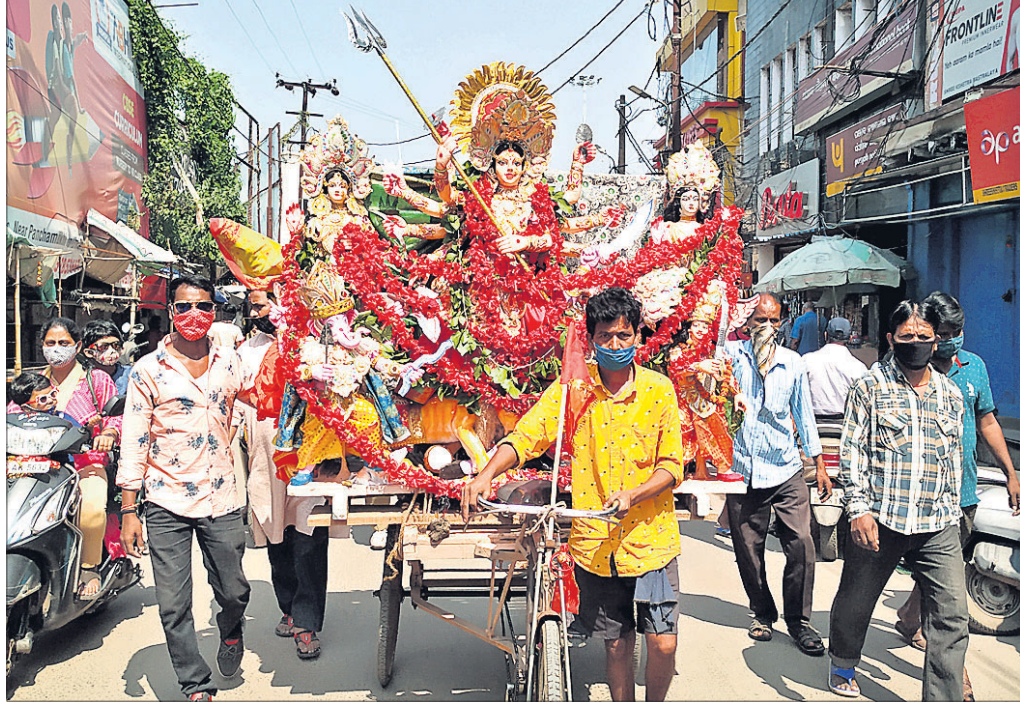
କୋଭିଡ୍ କଟକଣାକୁ ଦୃଷ୍ଟିରେ ରଖି ମଙ୍ଗଳବାର ନିରାଡ଼ମ୍ବର ଭାବେ ମା'ଙ୍କୁ ଭସାଣି ନିମନ୍ତେ କଟକ ପୁରୀଘାଟ ଦେବୀଗଡ଼ା ଘାଟକୁ ନିଆଯାଇଛି।