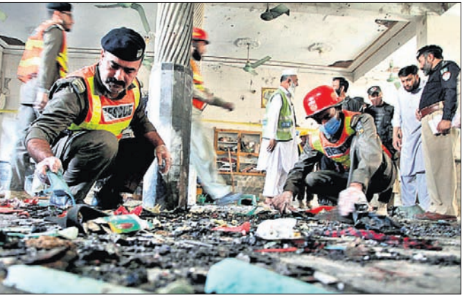
ବୟସ ୭ରୁ ୧୧ ବର୍ଷ ମଧ୍ୟରେ। ପାକ୍ ଦୃଢ଼ ନିନ୍ଦା କରିବା ସହ ଆହତମାନଙ୍କ ପ୍ରଧାନମନ୍ତ୍ରୀ ଇମ୍ରାନ୍ ଖାନ୍ ଘଟଣାର ଅଶୁ ଆରୋଗ୍ୟ କାମନା କରିଛନ୍ତି।