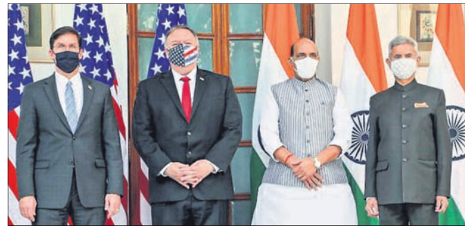
ଆମେରିକା ପ୍ରତିରକ୍ଷା ସଚିବ ମାର୍କ ଟି. ଏସ୍ପର ଏବଂ ପରରାଷ୍ଟ୍ର ସଚିବ ମାଲକ୍ ପମ୍ପିଓଙ୍କ ସହ ପ୍ରତିରକ୍ଷା ମନ୍ତ୍ରୀ ରାଜନାଥ ସିଂ ଓ ବହିର୍ବ୍ୟାପାର ମନ୍ତ୍ରୀ ଏସ୍. ଜୟଶଙ୍କର।

ଭାରତ-ଆମେରିକା ମଧ୍ୟରେ ମଙ୍ଗଳବାର ଐତିହାସିକ ପ୍ରତିରକ୍ଷା ବୃତ୍ତି ବେସିକ୍ ଏକ୍ସଚେଞ୍ଜ ଆଣ୍ଡ କୋ-ଅପରେଶନ ଏଗ୍ରିମେଣ୍ଟ (ବିଜିଏସ୍) ସ୍ୱାକ୍ଷର ହୋଇଛି। ଏହି ବୃତ୍ତି ବଳରେ ଉଭୟ ଦେଶର ସୈନ୍ୟବାହିନୀ ପରସ୍ପର ମଧ୍ୟରେ ଅତ୍ୟାଧୁନିକ ପ୍ରତିରକ୍ଷା ପ୍ରଯୁକ୍ତି, ଜିପ୍‌ହାଟ୍‌ଆଇ (ଭୂସ୍ଥାନିକ) ମ୍ୟାପ୍ ଏବଂ ଗୋପନୀୟ ସାଟେଲାଇଟ୍ ତାଗା ଆଦାନପ୍ରଦାନ କରିପାରିବେ। ଭାରତ-ପ୍ରଶାନ୍ତ ମହାସାଗରୀୟ ଅଞ୍ଚଳରେ ଗାଜନୀର ଅର୍ଥନୈତିକ ଓ ସାମରିକ ସାମର୍ଥ୍ୟ ବୃଦ୍ଧି ପାଇଥିବାରୁ ଏହାକୁ ଦୃଷ୍ଟିରେ ରଖି ମଙ୍ଗଳବାର ଭାରତ-