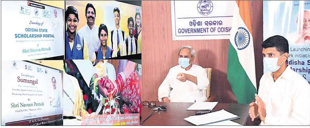
ପୋର୍ଟାଲ ଉନ୍ମୋଚନ ଅବସରରେ ମୁଖ୍ୟମନ୍ତ୍ରୀ ନବୀନ ପଟ୍ଟନାୟକ ଏବଂ ୫-ଟି ସଭ୍ୟ ଉ.କେ. ପାଠିଆନ।

ଭୁବନେଶ୍ୱର, ୨୭।୧୦(ବୁଧବାର): ବରିଷ୍ଠ କବି ଗତିବାଣୀ ମହାପାତ୍ରଙ୍କ କବିତା ସଂକଳନ 'ଭବଅର୍ଥ୍ୟ'ର ଉର୍ଦ୍ଧ୍ୱାଳ ପାଠକାର୍ପଣ କରାଯାଇଛି।