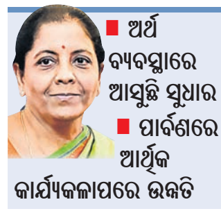
■ ଅର୍ଥ ବ୍ୟବସ୍ଥାରେ ଆସୁଛି ସୁଧାର ■ ପାର୍ବଣରେ ଆର୍ଥିକ କାର୍ଯ୍ୟକ୍ରମରେ ଉଦ୍‌ଗତ

ଚଳିତ ଆର୍ଥିକ ବର୍ଷରେ ଭାରତର ମୋଟ ଘରୋଇ ଉତ୍ପାଦ(ଜିଡିପି)ନିକାରାଗୁଆ କିମ୍ବା ଶୂନ୍ୟ ସ୍ତରରେ ରହିବା ଆଶଙ୍କା ରହିଛି। କରୋନା ଯୋଗୁ ଏକଲି ଛୁଟି ସାମ୍ନା କରିବାକୁ ପଡ଼ିଛି ବୋଲି ଅର୍ଥମନ୍ତ୍ରୀ ନିର୍ମଳା ସୀତାରାମନ ମଙ୍ଗଳବାର କହିଛନ୍ତି। ଏକ କାର୍ଯ୍ୟକ୍ରମରେ ସେ କହିଛନ୍ତି ଯେ, ଘରୋଇ ବଜାର ଅଭିବୃଦ୍ଧିରେ ସୁଧାର ପରିଲକ୍ଷିତ ହେଉଛି। ଆସନ୍ତା ବର୍ଷ ସୁଦ୍ଧା ଭାରତ ବୃଦ୍ଧି