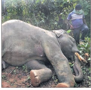
ମରି ପଡ଼ିଥିବା ଦନ୍ତା ହାତୀ।