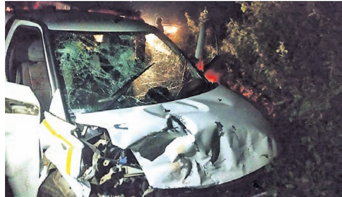
କି. ଉଦୟଗିରିରେ ଘଟିଥିବା ଦୁର୍ଘଟଣାଗ୍ରସ୍ତ କାର୍।

ଗଞ୍ଜାମ, ଗଜପତି ଓ କନ୍ଧମାଳ ଜିଲ୍ଲାରେ ରବିବାର ଓ ବୋମ୍ବାର ସଡ଼କ ଦୁର୍ଘଟଣାରେ ୮ ଜଣଙ୍କ ମୃତ୍ୟୁ ଘଟିଛି।