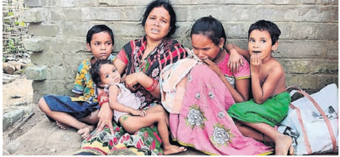
ମୃତ ଶଶିକାନ୍ତଙ୍କ ପରିବାର।