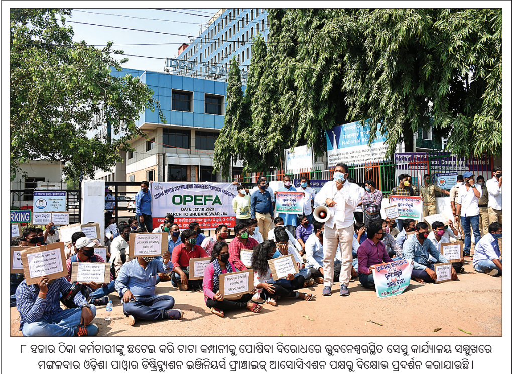
୮ ହଜାର ଠିକା କର୍ମଚାରୀଙ୍କୁ ଛତେଇ କରି ଚାନ୍ଦି କମ୍ପାନୀକୁ ପୋଷିବା ବିରୋଧରେ ଭୁବନେଶ୍ୱରସ୍ଥିତ ସେସୁ କାର୍ଯ୍ୟାଳୟ ସମ୍ମୁଖରେ ମଙ୍ଗଳବାର ଓଡ଼ିଶା ପାଠ୍ୟ ପାଠ୍ୟ ଚିକିତ୍ସାଳୟ ଉପରେ ପ୍ରତିରୋଧ ପ୍ରଦର୍ଶନ କରାଯାଇଛି।

ଚିତ୍ରକୋଣ୍ଡା, ୨୭।୧୦(ଡି.ଏନ.ଏ.): ଚିତ୍ରକୋଣ୍ଡା ପଞ୍ଚାୟତ ସମିତି ଅନ୍ତର୍ଗତ ଗାନ୍ଧୀନୀମୁଖି ପଞ୍ଚାୟତର ଗାନ୍ଧୀନୀମୁଖି ଗ୍ରାମର ଜଣେ ମହିଳା ବନ୍ଦୀ ଗାଧୋଇବାକୁ ଯାଇ ବୁଡ଼ିଯାଇଛନ୍ତି।