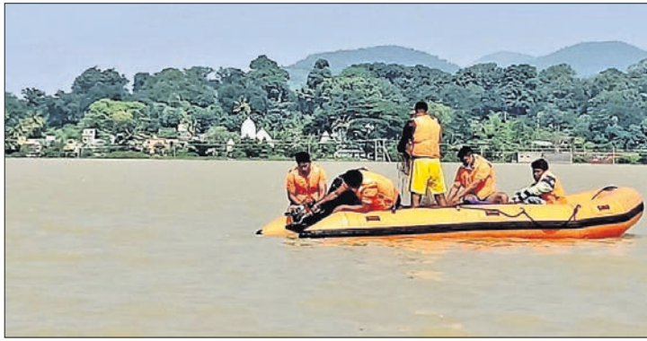
ଜଳାପୁଟ ଜଳଭଣ୍ଡାରରେ ନିଖୋଜ ଯୁବକଙ୍କୁ ଉଦ୍ଧାର ପାଇଁ ନିୟୋଜିତ ଓଡ୍ରାୟ ଟିମ୍।

କୋରାପୁଟ ଜିଲ୍ଲା ପାହୁଆ ଥାନା ଅନ୍ତର୍ଗତ ଜଳାପୁଟ ଜଳଭଣ୍ଡାରରେ ରବିବାର ଏକ ଦେଶୀ ତଳା ବୁଡ଼ି ୩ ଜଣ ଯୁବକ ନିଖୋଜ ହୋଇଯାଇଥିଲେ।