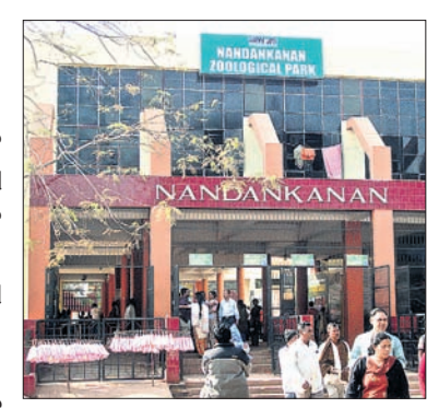
ପ୍ରାଣୀ ଉଦ୍ୟାନ ନନ୍ଦନକାନନ ପର୍ଯ୍ୟଟକ ପାଇଁ ଆଣିଛି ଖୁସି ଖବର।

ପ୍ରାଣୀ ଉଦ୍ୟାନ ନନ୍ଦନକାନନ ପର୍ଯ୍ୟଟକ ପାଇଁ ଆଣିଛି ଖୁସି ଖବର। ଯେଉଁ ପର୍ଯ୍ୟଟକମାନେ ନନ୍ଦନକାନନ ଆସିପାରୁ ନାହାନ୍ତି, ସେମାନେ ଏଣିକି ଘରେ ବସି ସମସ୍ତ ଜୀବଜନ୍ତୁଙ୍କୁ ଦେଖିପାରିବେ। ଏଥିପାଇଁ ନନ୍ଦନକାନନ କର୍ତ୍ତୃପକ୍ଷ ପର୍ଯ୍ୟଟକ ପାଇଁ ଆରମ୍ଭ କରିଛନ୍ତି ଭର୍ଚୁଆଲ୍ ଟୁର ବ୍ୟବସ୍ଥା। ମହାମାରୀ କରୋନା ପାଇଁ ନନ୍ଦନକାନନ ବୁଲିବାକୁ ବଞ୍ଚିତ ପର୍ଯ୍ୟଟକ, ବିଶେଷକରି ବୃଦ୍ଧ ଓ ଶିଶୁଙ୍କୁ ନନ୍ଦନକାନନରୁ ବଞ୍ଚିତ ବ୍ୟବସ୍ଥା କରାଯାଇଛି। ଜଙ୍ଗଲୀ ଜୀବଜନ୍ତୁଙ୍କ ବିଚରଣକୁ ନିକଟରୁ ଦେଖିବାକୁ ଲାଗିଯିବା ବ୍ୟବସ୍ଥା ହୋଇଛି। ୩୬୦ ଡିଗ୍ରୀ ଭର୍ଚୁଆଲ୍ ଟୁର ମାଧ୍ୟମରେ ଜଣେ ପର୍ଯ୍ୟଟକ ନନ୍ଦନକାନନ ଭିତରକୁ ପ୍ରବେଶ କରିବା ସହ ପ୍ରାଣୀ କରୀବାର ସମସ୍ତ ସୁଯୋଗ ରହିଛି। ଏଥିପାଇଁ ନନ୍ଦନକାନନ ସମସ୍ତ ଜୀବଜନ୍ତୁଙ୍କ ଭିଡ଼ିଓ ଡେଭିଲପ୍ମେଣ୍ଟରେ ଅର୍ଥଲୋଭ କରାଯାଇଛି। ଏଥିରେ ମଲ୍ଟିମିଡ଼ିଆ ସାହାଯ୍ୟରେ ଉତ୍ତମ ଶ୍ରେଣୀର ଭିଡ଼ିଓଗ୍ରାଫିର ଉପଯୋଗ କରାଯାଇଛି।