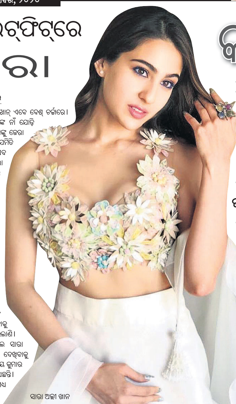
ସାରା ଅଲ୍ଲା ଖାନ

ବଲିଉଡ ଅଭିନେତ୍ରୀ ସାରା ଅଲ୍ଲା ଖାନ ଏବେ ବେଶ୍ ଚର୍ଚ୍ଚାରେ। କିଛିଦିନ ପୂର୍ବରୁ ଡ୍ରଗ୍ସ ଲିଙ୍କରେ ତାଙ୍କ ନାଁ ଯୋଡ଼ି ହୋଇଥିବାରୁ ଏନଏସ୍ ଡିଭିଜନ୍ ତାଙ୍କୁ ଜେରା କରାଯାଇଥିଲା। ଏହାପରେ ସାରା ଯେମିତି ସୋସିଆଲ୍ ସାଇଟ୍ରେ ପୁରା ଗାଏବ ହୋଇଯାଇଥିଲେ। ନିକଟରେ ସାରା ତାଙ୍କର ଇନ୍ଷ୍ଟାଗ୍ରାମ ଆକାଉଣ୍ଟରେ କିଛି ଫଟୋ ଶେୟାର କରିଥିଲେ। ଏହି ଫଟୋରେ ସେ ଅଭିନେତା ବରୁଣ ଧାଞ୍ଜନଙ୍କ ସହ ନଜର ଆସିଛନ୍ତି। ଦୁଇ ଜଣଙ୍କ ଫଟୋ ଜବରଦସ୍ତ ହୋଇଛି। ଏଥିରେ ସାରା ପିଙ୍କ କଲର୍ ଆଉଟଫିଟ୍ ପିନ୍ଧିଥିବାବେଳେ ବରୁଣଙ୍କୁ ସ୍ଲାଇ କଲର୍ରେ ଦେଖିବାକୁ ମିଳିଛି। ସାରା ଏହି ଫଟୋ ଶେୟାର କରି କ୍ୟାପସନ୍ରେ ଲେଖିଛନ୍ତି 'ଥୁକ୍ ପିଙ୍କ'। ସାରାଙ୍କ ଫଟୋକୁ ଫ୍ୟାନ୍ସମାନେ ବେଶ୍ ପସନ୍ଦ କରିଛନ୍ତି। ପିଙ୍କ କଲର୍ ଡ୍ରେସରେ ସାରାଙ୍କ ଅନ୍ୟାନ୍ୟ ଫ୍ୟାନ୍ସମାନଙ୍କ ହୋଇ ଉଠାଇଛି। ଏପର୍ଯ୍ୟନ୍ତ ଏହାକୁ ୧୨ଲକ୍ଷରୁ ଅଧିକ ଲାଇକ୍ ମିଳିସାରିଲାଣି। ଖୁବ୍ ଫୁଲ୍ କଥା କହିବାକୁ ଗଲେ ସାରା ଅପକମିଂ ଫିଲ୍ମ 'ଅତରଙ୍ଗ'ରେ ଦେଖିବାକୁ ମିଳିବେ। ଏଥିରେ ତାଙ୍କ ସହିତ ଅକ୍ଷୟ କୁମାର ଏବଂ ଧନୁଜ୍ ମୁଖ୍ୟ ଭୂମିକାରେ ଅଛନ୍ତି। ଏହାସହିତ ସାରାଙ୍କ କୁଲି ନଂ ୧ ମଧ୍ୟ ଖୁବ୍ ଖାସ୍ତା ଚଳିଛି ହେବ।