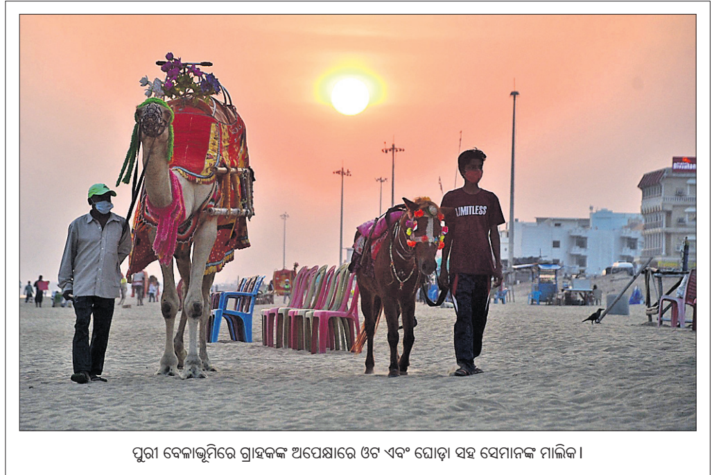
ପୁରୀ ବେଳାଭୂମିରେ ଗ୍ରାହକଙ୍କ ଅପେକ୍ଷାରେ ଓଟ ଏବଂ ଘୋଡ଼ା ସହ ସେମାନଙ୍କ ମାଲିକ।

ସରିପୁ, କର୍ତ୍ତୃମାନଙ୍କର ଗତିବିଧିକୁ ଲକ୍ଷ୍ୟ କରିବା ସହ ଏହାର ମତା ନେଇହେବ। ନନ୍ଦନକାନନ ପ୍ରତିଷ୍ଠା ଦିବସ ପୂର୍ବରୁ ଏହା ସମ୍ପୂର୍ଣ୍ଣ ଭାବେ କାର୍ଯ୍ୟକ୍ରମ ହେବ। ତେବେ ଚୁରୁବାରୋଠାକୁ ଭର୍ଚୁଆଲ୍ ଟୁରର ଶୁଭାରମ୍ଭ ହୋଇଥିବା ନେଇ ଚୁରୁ ଯୋଗେ ସୂଚନା ଦେଇଛନ୍ତି ନନ୍ଦନକାନନ କର୍ତ୍ତୃପକ୍ଷ। ଏହାସହ ନନ୍ଦନକାନନ ପ୍ରତିଷ୍ଠା ଦିବସ ତଥା ଡିସେମ୍ବର ୨୯ରୁ ବନ୍ଦ ପଡ଼ିଥିବା ଚନ୍ଦ୍ରଚୋଡ଼ ପ୍ରକଳ୍ପ ମଧ୍ୟ ନୂଆ କରି କାର୍ଯ୍ୟକ୍ରମ ହେବାନେଇ ସୂଚନା ମିଳିଛି। ମହାମାରୀ କରୋନା ପାଇଁ ଦୀର୍ଘ ୭ମାସ ଧରି ଏହି ପ୍ରାଣୀ ଉଦ୍ୟାନକୁ ସର୍ବସାଧାରଣଙ୍କ ପାଇଁ ବନ୍ଦ କରାଯାଇଥିଲା। ଗତ ୪ ତାରିଖରେ ଖୋଲିବା ପରେ ପର୍ଯ୍ୟଟକମାନେ ଏବେ ଅର୍ଥଲୋଭନ ଓ ଅର୍ଥଲୋଭନରେ ଚିକେଟ୍ କରି ନନ୍ଦନକାନନ ବୁଲିବାର ସୁଯୋଗ ପାଇଛନ୍ତି।