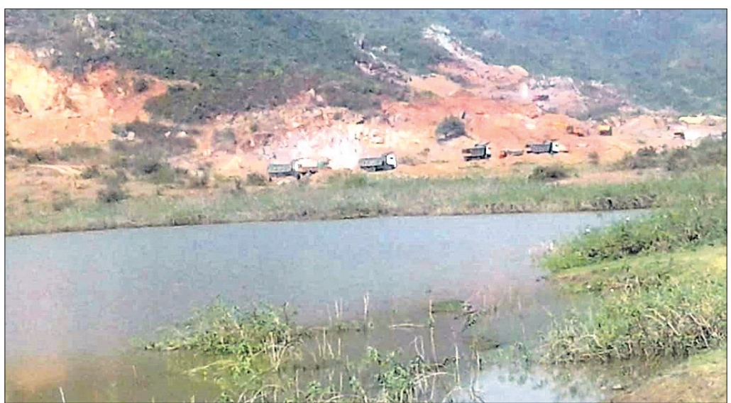
ରାଣାବନ୍ଧ ନିକଟରେ ହୋଇଥିବା ବେଆଇନ ଖନନ।

ସର୍ବୋତ୍ତମ ବେହୁରା ହାଇକୋର୍ଟରେ ଏକ ଜନସ୍ୱାର୍ଥ ମାମଲା(୩୦୬୫/୧୮) ରୁଜୁ କରିଥିଲେ। ଏହା ପୂର୍ବରୁ ଅଞ୍ଚଳବାସୀ ଜିଲ୍ଲା ପ୍ରଶାସନର ଦ୍ୱାରସ୍ଥ ହୋଇଥିଲେ। ଅନୁମତି ନ ନେଇ ଏବଂ ପରିବେଶ ଆଇନ ଉଲ୍ଲଙ୍ଘନ କରି ସେଠାରେ ୧୨ରୁ ଉର୍ଦ୍ଧ୍ୱ ପଥର ଖାଦାନ ଚାଲିଛି। ତେଣୁ ଏକ ଯୁକ୍ତ ତଦନ୍ତ କରି ଆବଶ୍ୟକ ପଦକ୍ଷେପ ନେବାକୁ ଅଞ୍ଚଳବାସୀ ଜିଲ୍ଲାପାଳଙ୍କୁ ସ୍ମାରକପତ୍ର ପ୍ରଦାନ କରିଥିଲେ। ଏହାପରେ ପ୍ରଶାସନ ପକ୍ଷରୁ ସେଠାରେ ୧୪୪ ନିଷ୍ପତ୍ତି ହେବା ଆଶଙ୍କା ସୃଷ୍ଟି କରିଛି। ରାଣାବନ୍ଧ ଅଞ୍ଚଳରେ ଜଳସେଚନ ସମ୍ପଦ ସୂକ୍ଷ୍ମା ସେଠାକାର ଗୋଷ୍ଠୀ ବିକଳ ସମୟରେ ମରୁଡ଼ିର ସମ୍ମୁଖୀନ ହୋଇଆସୁଛି। ଏଭଳି ଅନେକ ସମସ୍ୟା ଉପରେ ଗ୍ରାମବାସୀ ସ୍ମାରକପତ୍ରରେ ଯୋଗୁ ପ୍ରଭାବିତ ହେଉଥିବା ଅଭିଯୋଗ ହୋଇଥିଲା। ଏନେଇ ୨୦୧୮ ଫେବୃଆରୀରେ ସାମାଜିକ କର୍ମୀ