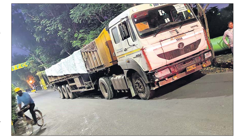
ପ୍ରକ୍ ଯୋଗେ ଇସ୍ପାତ୍ ପରିବହନ ହେଉଛି।