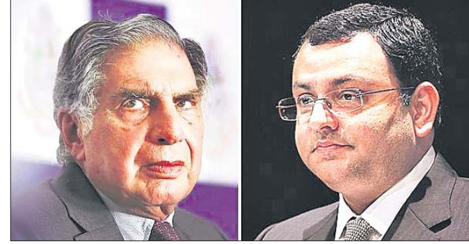
ରତନ ଟାଟା, ଆନନ୍ଦ ମାହିନ୍ଦ୍ରା

ଗାଟା ଗୁପ୍ତ ଛାଡ଼ିବାକୁ ସାପୋରଜା ପାଇଲେ (ଏସପି ) ଗୁପ୍ତ ଯୋଜନା ରଖିଛି। ଏଥିଲାଗି ବୃତ୍ତାନ୍ତ ପୂର୍ଣ୍ଣ ପ୍ରତିକୋର୍ଟକୁ ପ୍ରଦାନ କରିଥିବା ଗୁପ୍ତ