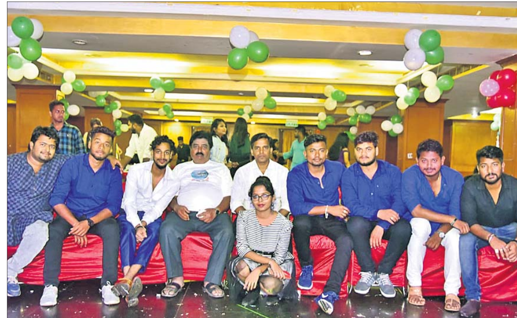
ଅସମ ବ୍ରଦର୍ଷୀ ଗୁପ୍ତର ସଦସ୍ୟମାନେ ।