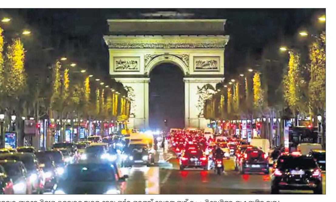
ଶୁକ୍ରବାର ପ୍ରାଣ୍ଟରେ ବିପ୍ଳବ ଲକ୍ଷ୍ମୀର ଆରମ୍ଭ ହେବା ପୂର୍ବରୁ ଘରମୁହାଁ ଲୋକଙ୍କ ପାଇଁ ୭୦୦ କିଲୋମିଟର ଯାଏ ଗ୍ରାମିକ କାମ।