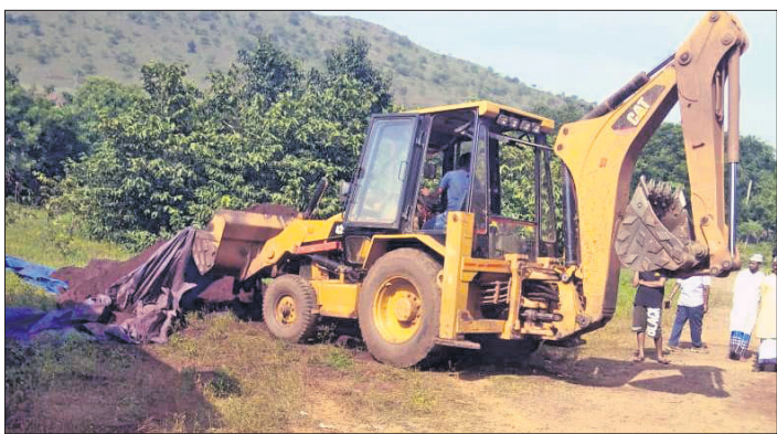
ନେତ୍ରକପୁର ପାହାଡ଼ ନିକଟରେ ଗଦା ହୋଇଥିବା ଲୁହାପଥରକୁ କେସିବି ବାବା ଭଞ୍ଜାଯାଇଛି।

ଯାକପୁର ଜିଲ୍ଲା ଧର୍ମଶାଳା ଥାନା ଅନ୍ତର୍ଗତ ନେତ୍ରକପୁର, ହରଦେଇପୁର ପ୍ରଭୃତି ଅଞ୍ଚଳରେ ଶନିବାର ବିପ୍ଳବ ପରିମାଣର ଚୋରା ଲୁହାପଥର ଜବତ ହୋଇଛି।