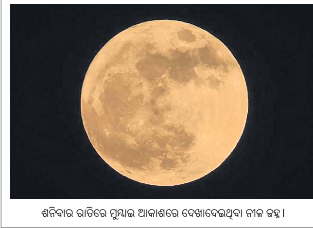
ଶନିବାର ରାତିରେ ପୂର୍ଣ୍ଣିମା ଆକାଶରେ ଦେଖାଦେଇଥିବା ନୀଳ ଚନ୍ଦ୍ର।