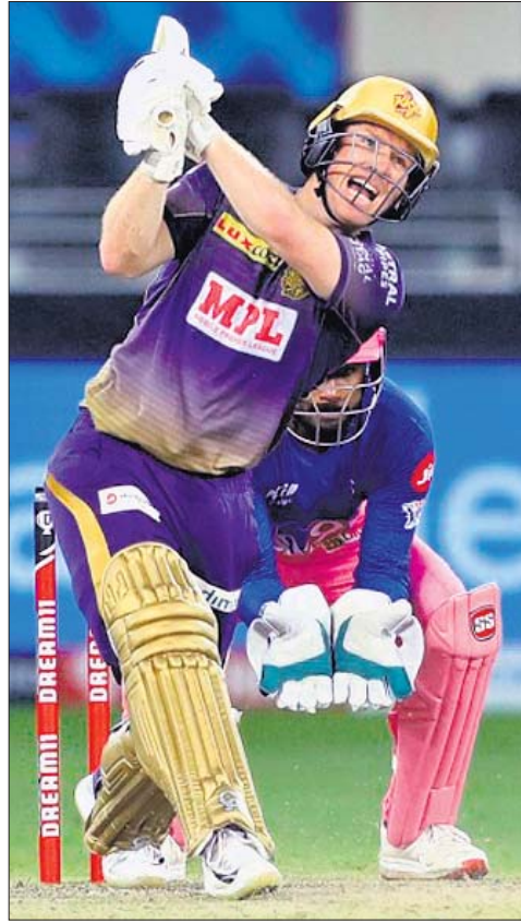
ଦ୍ରୁତ ଇନିଂସ୍ ଅବସରରେ ଅଧିନାୟକ ଇଅନ ମୋର୍ଗାନ।

ଇଅନ ମୋର୍ଗାନଙ୍କ ଅଧିନାୟକ ଇନିଂସ୍ ସହାୟତାରେ କୋଲକାତା ନାଇଟ ରାଇଡର୍ସ ଇଣ୍ଡିଆନ ପ୍ରିମିୟର ଲିଗ୍ (ଆଇପିଏଲ)ର ରବିବାର ଅନୁଷ୍ଠିତ ମ୍ୟାଚରେ ଚ୍ୟାଲେଞ୍ଜିଂ ସ୍କୋର କରିଛି। ରାଜସ୍ଥାନ ରୟାଲ୍ସ କୋଲକାତା ନେ ଆରମ୍ଭରେ ପ୍ରଭାବୀ ବୋଲିଂ କରିଥିଲେ ହେଁ ମୋର୍ଗାନ ଦ୍ରୁତ ଇନିଂସ୍ ଖେଳି ୨୦ ଓଭରରେ କୋଲକାତା ସ୍କୋରକୁ ୧୯୧/୭ରେ ପହଞ୍ଚାଇଛନ୍ତି। ଏହି ମ୍ୟାଚରେ ଯେଉଁ ଦଳ ବିଜୟୀ ହେବ ତା'ର ଯୁବ-ଅପ୍ ପ୍ରବେଶ ଆଶା ଉଜ୍ଜୀବିତ ରହିବ। ପରାଜିତ ଦଳକୁ ବିଦାୟ ନେବାକୁ ପଡ଼ିବ। ଶନିବାର ଅନୁଷ୍ଠିତ ଦ୍ୱିତୀୟ ମ୍ୟାଚରେ କିଙ୍ଗ୍ସ ଇଲେଭେନ ପଞ୍ଜାବ ନିକଟରୁ ପରାଜିତ ହେବାରୁ ରୟାଲ ଚ୍ୟାଲେଞ୍ଜିଂ ବାଙ୍ଗାଲୋରର ଯୁବ-ଅପ୍ ପ୍ରବେଶ ମଧ୍ୟ ନିଶ୍ଚିତ ହୋଇନାହିଁ। ତେଣୁ ଲିଗ୍‌ର ଶେଷ ମ୍ୟାଚ ପର୍ଯ୍ୟନ୍ତ ଯୁବ-ଅପ୍ ପାଇଁ ଉତ୍ସାହ ଜାରି ରହିବ।