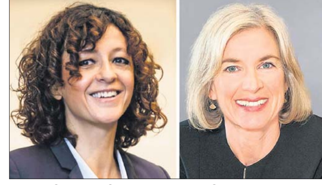
ମ୍ୟାରିକ୍ ଚାଉପେଟ୍‌ଅର୍ ଜେନିଫର୍ ଆନେ ଡାଉଡ୍‌ନା

“ଚଳିତବର୍ଷର ନୋବେଲ ପୁରସ୍କାର ବିଜୟିନୀତ୍ରୟ- ବର୍ଲିନସ୍ଥିତ 'ମାକ୍ସପ୍ଲଙ୍କ ଯୁନିଟ୍ ଫର ସାଇନ୍ସ ଅଫ ପାଥୋଜେନ୍'ର ଇମ୍ମାନ୍ୟୁଏଲ୍ ମ୍ୟାରିକ୍ ଚାଉପେଟ୍‌ଅର୍ ଏବଂ 'ୟୁନିଭର୍ସିଟି ଅଫ କାଲିଫର୍ଣ୍ଣିଆ'ର ଜେନିଫର୍ ଆନେ ଡାଉଡ୍‌ନା କୃତ୍ରିମ ଭାବରେ ଜୀବାଣୁଟିର ଜିନୀୟ କଡୁରି ତିଆରି କରିବାରେ ସଫଳତା ଅର୍ଜନ କରିବା ସହିତ ତାହାର ବିଭିନ୍ନ କ୍ଷେତ୍ରରେ ବ୍ୟବହାର ପଦ୍ଧତିକୁ ସରଳ କରିଛନ୍ତି। ଏହାର ବ୍ୟବହାର ଜୀବ ବିଜ୍ଞାନର ବିଭିନ୍ନ ଦିଗକୁ ପରିବର୍ତ୍ତିତ ଏବଂ ବିକଶିତ ହେବାରେ ସହାୟକ ହୋଇପାରିଛି।”