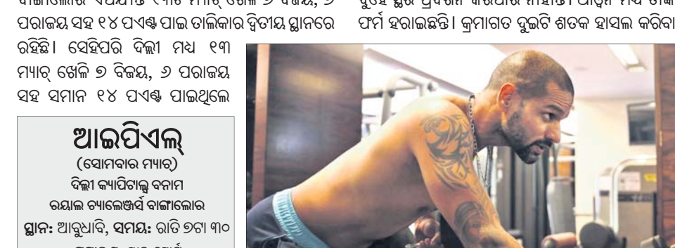
ଘାନ୍‌ରେ ଶିଖର ଧାଠୁନ ।

ଆରୁଧି, ୧୧୧ (ପି.ଟି.) ଇଣ୍ଡିଆନ ପ୍ରିମିୟର ଲିଗ୍ (ଆଇପିଏଲ)ରେ ସୋମବାର ଏକ ଗୁରୁଦ୍ୱୟର୍ଷ୍ଣ ମ୍ୟାଚ୍‌ରେ ରୟାଲ ଚ୍ୟାଲେଞ୍ଜର୍ସ ବାଙ୍ଗାଲୋର (ଆରସିବି) ଓ ଦିଲ୍ଲୀ କ୍ୟାପିଟାଲ୍ସ ମୁହାଁମୁହିଁ ହେବେ । ଏହି ମ୍ୟାଚ୍ ଜିତି ଉଭୟ ଦଳ ପଏଣ୍ଟ ଟାଲିକାର ଶ୍ରେଷ୍ଠ ବୁଲଟି ଘାନ୍‌ରେ ରହିବା ପାଇଁ ପ୍ରୟାସ କରିବେ । ବାଙ୍ଗାଲୋର ଏପର୍ଯ୍ୟନ୍ତ ୧୩ଟି ମ୍ୟାଚ୍ ଖେଳି ୭ ବିଜୟ, ୬ ପରାକ୍ରମ ସହ ୧୪ ପଏଣ୍ଟ ପାଇଛି । ଦିଲ୍ଲୀ ୧୬ଟି ମ୍ୟାଚ୍ ଖେଳି ୯ ବିଜୟ, ୬ ପରାକ୍ରମ ସହ ୧୪ ପଏଣ୍ଟ ପାଇଥିଲେ ।