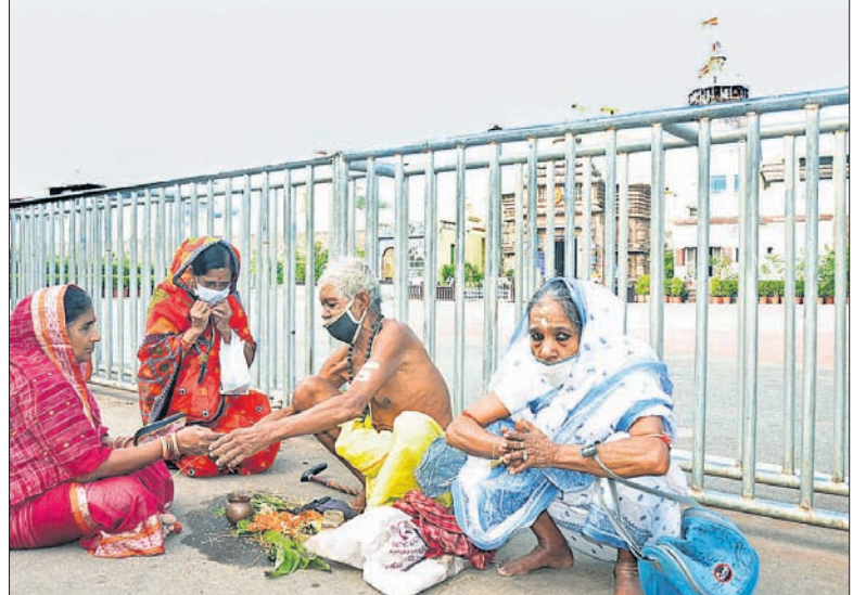
କରୋନା କଟକଣା ଯୋଗୁଁ ସିଂହଦ୍ୱାର ସମ୍ମୁଖରେ ହବିଷିଆଳିମାନେ କାର୍ତ୍ତିକ ବ୍ରତ ପାଇଁ ସଂକଳ୍ପ କରୁଛନ୍ତି।

ପୁରୀ ଅଫିସ୍, ୧୧୧୧. ରବିବାରଠାରୁ ପବିତ୍ର କାର୍ତ୍ତିକ ମାସ ଆରମ୍ଭ ହୋଇଛି। ଏହି ପୂଣ୍ୟ ଓ ଧର୍ମ ମାସରେ ହବିଷିଆଳିମାନେ କାର୍ତ୍ତିକ ବ୍ରତ ଆରମ୍ଭ କରିଛନ୍ତି। ମହୋଦଧି ସମେତ ବିଭିନ୍ନ ଚାନ୍ଦି ପୂର୍ଣ୍ଣିମାରେ ପ୍ରତ୍ୟୁଷରୁ ସ୍ନାନ ସାରିବା ପରେ ସଂକଳ୍ପ କରି ବ୍ରତ ଧରିଛନ୍ତି।