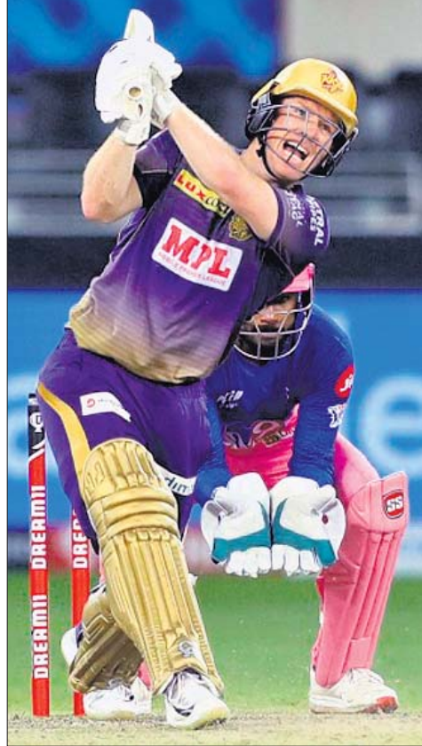
ଦ୍ରୁତ ଇନ୍ଦିୟା ଅବସରରେ ଅଧିନାୟକ ଇଅନ ମୋର୍ଗାନ।

ଇଅନ ମୋର୍ଗାନଙ୍କ ଅଧିନାୟକତ୍ୱରେ ଇନ୍ଦିୟା ପରେ ପ୍ୟାର୍ କୁମ୍ଭିରୁକ୍ତ ଘାଟକ ବୋଲି ବକ୍ତାରେ କୋଲକାତା ନାଲଟ ରାଜତ୍ୱ ଲକ୍ଷ୍ମୀୟ ପ୍ରମିୟର ଲିଗ୍ (ଆଇପିଏଲ୍)ର ଉଦ୍ଦେଶ୍ୟ ଅନୁଷ୍ଠିତ ମ୍ୟାଚରେ ରାଜସ୍ଥାନ ରୟାଲ୍ସକୁ ୬୦ ରନରେ ପରାସ୍ତ କରିଛି। ପ୍ରଥମେ ବ୍ୟାଟିଂ କରିଥିବା କୋଲକାତା ୨୦ ଓଭରରେ ୬ ରଜକେଟ ହରାଇ ୧୯୧ ରନ କରିଥିଲା। ୧୯୨ ରନ ବିଜୟ ଲକ୍ଷ୍ୟରେ ରାଜସ୍ଥାନ ୨୦ ଓଭରରେ ୯ ରଜକେଟ ହରାଇ ୧୩୧ ରନ କରିବାକୁ ସକ୍ଷମ ହୋଇଥିଲା। ଏଠାରେ ବିଜୟ ଫଳରେ କୋଲକାତାର ପ୍ରେ-ଅପ୍ ପ୍ରବେଶ ଆଶା ଉଜ୍ଜ୍ୱଳ ରହିଛି। ଏହାପରେ ୧୪ ମ୍ୟାଚରୁ ୧୪ ପଏଣ୍ଟ୍ ସହିତ ଟେବୁଲ୍ ଉପରେ ଉପସ୍ଥାନ ହୋଇଛି। ଅନ୍ୟପକ୍ଷରେ ରୟାଲ୍ସ ୧୪ ମ୍ୟାଚରୁ ୧୨ ପଏଣ୍ଟ୍ରେ ରହି ବିଦାୟ ନେଇଛି।