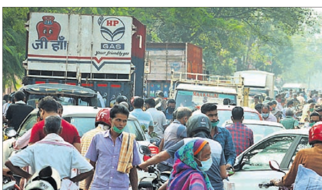
ଅନୁଗୋଳ-କଟକ ରାସ୍ତାର କଲେଜ ଛକରେ କାମ୍ ହୋଇଛି।

ଭିଡ଼ ହେଲେ ସଂକ୍ରମଣ ବଢ଼ିବ। ସେଥିପାଇଁ ନିୟନ୍ତ୍ରଣ ବଜାର କମିଟି (ଆରଏମ୍‌ସି) ଭିତରେ ହେଉଥିବା ହାଟକୁ ପ୍ରଶାସନ ବନ୍ଦ କରି ଅନୁଗୋଳ-କଟକ ରାସ୍ତାର କଲେଜ ଛକକୁ ସ୍ଥାନାନ୍ତର କଲା।