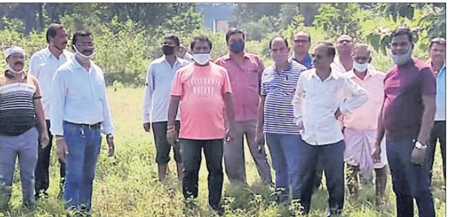
ଜମି ଚିହ୍ନଟବେଳେ ଉପସ୍ଥିତ ଗ୍ରାମବାସୀ।

କିଶୋରନଗର ବ୍ଲକ୍ ବଜାରଠାରେ ଥିବା ରାଧାକୃଷ୍ଣ ମନ୍ଦିର ୫୫ ନମ୍ବର ଜାଗାରେ ରାଜପଥ ସମ୍ମୁଖରେ ଉପସ୍ଥିତ ହୋଇଛି।