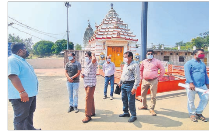
ଜିଲ୍ଲାପାଳ ଓ ଅଧିକାରୀମାନେ ଉନ୍ନତଚକ୍ର କାର୍ଯ୍ୟ ତଦାରଖ କରୁଛନ୍ତି।

ଅନୁଗୋଳ ଅଫିସ, ୧୧୧୧ - ଅନୁଗୋଳ ସହରର ହେବ ସୌନ୍ଦର୍ଯ୍ୟକରଣ। ଆସନ୍ତା ୧୫ ଦିନ ମଧ୍ୟରେ ଏହି କାର୍ଯ୍ୟ ଆରମ୍ଭ ହେବ।