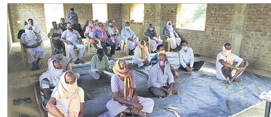
ଜୀବନ ଜୀବିକା ଓ ଜମି ସୁରକ୍ଷା କମିଟି ପକ୍ଷରୁ ବୈଠକ।

କିଶୋରନଗର ବ୍ଲକ୍ ଜବାହରଠାରେ ଶିଳ୍ପ ପାର୍କ ପ୍ରତିଷ୍ଠା ପ୍ରସ୍ତାବକୁ ଜୀବନ ଜୀବିକା ଓ ଜମି ସୁରକ୍ଷା କମିଟି ପକ୍ଷରୁ ବିରୋଧ କରାଯାଇଛି।