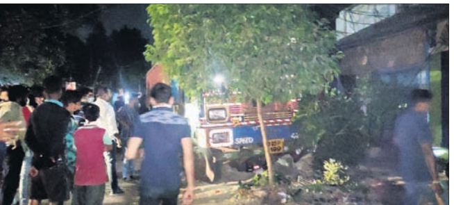
ଅମଳାପଡ଼ାସ୍ଥିତ ଏକ ଦୋକାନ ଭିତରକୁ ଟ୍ରକ୍ ପଶିଯାଇଛି।