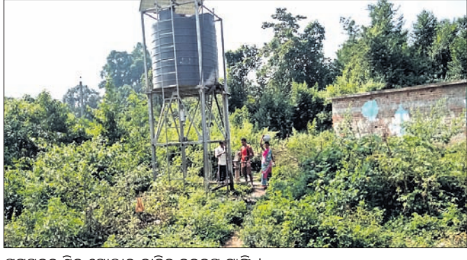
ଗୁରୁପଦର ଛିଡ଼ ଯୋଲାଉ ଟାଙ୍କିର ନଳକୂପ ଟାଙ୍କି ।

ରାୟଗଡ଼ା ଜିଲ୍ଲା ଚନ୍ଦ୍ରପୁର ବ୍ଲକ୍ ପିନ୍ଧାପଞ୍ଜା ପଞ୍ଚାୟତ ଅଧୀନ ଗୁରୁପଦର ଗ୍ରାମରେ ଯୋଲାଉ ଟାଙ୍କିର ନଳକୂପର ଟାଙ୍କି ଫାଟି ଜଳ ନଷ୍ଟ ହେଉଥିବା ଦେଖିବାକୁ ମିଳିଛି ।