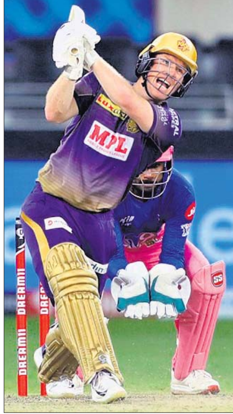
ଦ୍ରୁତ ଇନ୍ଦିୟା ଅବସରରେ ଅଧିନାୟକ ଇଅନ ମୋର୍ଗାନ।

ଇଅନ ମୋର୍ଗାନଙ୍କ ଅଧିନାୟକତ୍ୱରେ ଇନ୍ଦିୟା ପରେ ପ୍ୟାର୍ କ୍ଲବ୍‌ରୁ ଫ୍ଲୋରାଟ୍ ବୋଲିଂ ବଳରେ କୋଲକାତା ନାଲଟ ରାଇଡର୍ସ ଲକ୍ଷ୍ୟାତ୍ମକ ପ୍ରତିଯୋଗିତା (ଆଇପିଏଲ୍)ର ଉଦ୍ଦେଶ୍ୟ ଅନୁଯାୟୀ ମ୍ୟାଚ୍‌ରେ ରାଜସ୍ଥାନ ରୟାଲ୍‌ସ୍‌କୁ ୬୦ ରନରେ ପରାସ୍ତ କରିଛି। ପ୍ରଥମେ ବ୍ୟାଟିଂ କରିଥିବା କୋଲକାତା ୨୦ ଓଭରରେ ୬ ରଜକେଟ୍ ହରାଇ ୧୧୧ ରନ କରିଥିଲା। ୧୯୨ ରନ ବିଜୟ ଲକ୍ଷ୍ୟରେ ରାଜସ୍ଥାନ ୨୦ ଓଭରରେ ୯ ରଜକେଟ୍ ହରାଇ ୧୩୧ ରନ କରିବାକୁ ସକ୍ଷମ ହୋଇଥିଲା। ଏଠାରେ ବିଜୟ ଫଳରେ କୋଲକାତାର ପ୍ରେ-ଅପ୍ ପ୍ରବେଶ ଆଶା ଉଜ୍ଜ୍ୱଳ ରହିଛି। ଏହିଦିନ ୧୪ ମ୍ୟାଚ୍‌ରୁ ୧୪ ପଏଣ୍ଟ୍ ସହିତ ଟେବୁଲ୍‌ରେ ୪ର୍ଥ ସ୍ଥାନକୁ ଉନ୍ନତ ହୋଇଛି। ଅନ୍ୟପକ୍ଷରେ ରୟାଲ୍ ୧୪ ମ୍ୟାଚ୍‌ରୁ ୧୨ ପଏଣ୍ଟ୍‌ରେ ରହି ବିଦା ନେଇଛି।