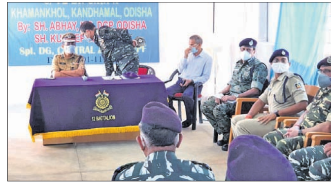
ଡିଜିପିଙ୍କ ସହ ଅନ୍ୟ ବରିଷ୍ଠ ଅଧିକାରୀ।

ଅଞ୍ଚଳବାସୀଙ୍କୁ ପୁରୁଣା ଦେବା ଲାଗି ଗୋରାସେତୁରେ ବିଏସ୍‌ଏସ୍ କ୍ୟାମ୍ପ ପ୍ରତିଷ୍ଠା ନେଇ ପଦକ୍ଷେପ ଆରମ୍ଭ ହୋଇଛି। କ୍ୟାମ୍ପର ସାମାନ୍ୟ ଚିତ୍ତ କରାଯାଇଛି। ଏହାର ଚାରିପଟକୁ ତାର ଲାଲ୍ ଘେରାଯାଇଛି। ଶନିବାର ମାଓବାଦୀଙ୍କ ଶହାଦସ୍ତ୍ରମ୍ ଏବଂ ଗଡ଼ଗୁହକୁ ଅଭିଆର କରାଯାଇଛି। ଏଥିପୂର୍ବରୁ ହରାକଗୁଡ଼ା, ଜରୁରାଇ, ଦାରଲାବେଡ଼ାରେ ବିଏସ୍‌ଏସ୍ କ୍ୟାମ୍ପ ପ୍ରତିଷ୍ଠା ହୋଇଥିଲା। ପରବର୍ତ୍ତୀ ସମୟରେ ଯୋଡ଼ାସରେ ଥାନା ପ୍ରତିଷ୍ଠା ହେଲା। କ୍ୟାମ୍ପ ପ୍ରତିଷ୍ଠା ହେବା ପରେ ଲୋକଙ୍କ ପୁରୁଣା ସହ ରାତ୍ରା ଘାଟ ନିର୍ମାଣ, ପାନୀୟ ଜଳ, ସ୍ୱାସ୍ଥ୍ୟ, ଶିକ୍ଷା ବ୍ୟବସ୍ଥାରେ ଉନ୍ନତ ସାଜକୁ ମାଓବାଦୀଙ୍କୁ ଦମନ କରିବା ଅଧିକ ସହଜ ହେବ।