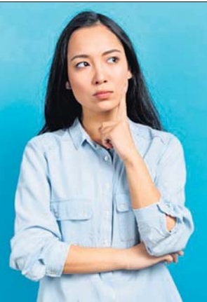
ପରୀକ୍ଷା କରି ଏପରି ତଥ୍ୟ ପ୍ରକାଶ କରିଛନ୍ତି। ତେବେ ଏପରି ସମସ୍ୟାଠାରୁ ନିଜକୁ ଦୂରରେ ରଖିବା ପାଇଁ ନିଜ ଜୀବନଶୈଳୀ ପ୍ରତି ଦୃଷ୍ଟି ଦେବାକୁ ସେମାନେ ପରାମର୍ଶ ଦେଇଛନ୍ତି।

ଆଜିକାଲିର ବ୍ୟସ୍ତ ଜୀବନରେ ଆମେ ନିଜର ଜୀବନଶୈଳୀ ପ୍ରତି ସତର୍କ ହେବା ନିହାତି କରୁନା। ଖାଦ୍ୟପେୟ ପ୍ରତି ଯତ୍ନ ନହେବା ସହ ନିଜେ କିପରି ସ୍ୱସ୍ଥ ରହିବା ସେ ନେଇ ସ୍ୱତନ୍ତ୍ର ଦୃଷ୍ଟି ଦେବା ଆବଶ୍ୟକ। କେତେକ ବ୍ୟକ୍ତି ନିଜର ଜୀବନଶୈଳୀକୁ ଆବଶ୍ୟକ ପୁରାବଳ ରୁହେଇ ଦେଇ ନ ଥାନ୍ତି। ଫଳତଃ ସେମାନେ ବିଭିନ୍ନ ପ୍ରକାର ସ୍ୱାସ୍ଥ୍ୟ ସମସ୍ୟାର ସମ୍ମୁଖୀନ ହୋଇଥାଆନ୍ତି। ନିକଟରେ ଲଣ୍ଡନ ବିଶ୍ୱବିଦ୍ୟାଳୟର ବିଶେଷଜ୍ଞଙ୍କ ଦ୍ୱାରା ହୋଇଥିବା ଏକ ଗବେଷଣାରୁ ଜଣାପଡ଼ିଛି ଯେ, ଅଧିକାଂଶ ସମୟ ଅବସାଦଗ୍ରସ୍ତ ରହିବା ପଛରେ ଅସନ୍ତୁଳିତ ଜୀବନଶୈଳୀର ଭୂମିକା ରହିଛି। ଏପରି ସିଦ୍ଧାନ୍ତରେ ପହଞ୍ଚିବା ପୂର୍ବରୁ ସେମାନେ ଅଧିକାଂଶ ସମୟ ଅବସାଦଗ୍ରସ୍ତ ରହୁଥିବା କେତେକ ବ୍ୟକ୍ତିଙ୍କର ଜୀବନଶୈଳୀକୁ ପରୀକ୍ଷା କରି ଏପରି ତଥ୍ୟ ପ୍ରକାଶ କରିଛନ୍ତି। ତେବେ ଏପରି ସମସ୍ୟାଠାରୁ ନିଜକୁ ଦୂରରେ ରଖିବା ପାଇଁ ନିଜ ଜୀବନଶୈଳୀ ପ୍ରତି ଦୃଷ୍ଟି ଦେବାକୁ ସେମାନେ ପରାମର୍ଶ ଦେଇଛନ୍ତି।