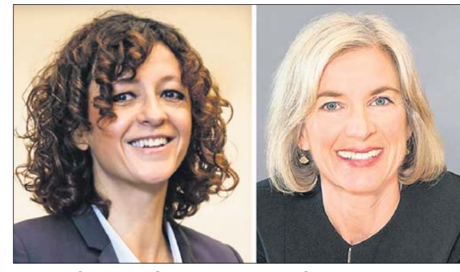
ମ୍ୟାରିକ୍ ଚାରପେଟ୍ଟିଅର୍ ଜେନିଫର୍ ଆନେ ଡାଉଡ୍‌ଜନ

“ଚଳିତବର୍ଷର ନୋବେଲ ପୁରସ୍କାର ବିଜୟିନୀବନ୍ଧୁ- ବର୍ଲିନସ୍ଥିତ 'ମାକ୍ସପ୍ଲାଙ୍କ ଯୁନିଟ୍ ଫର ସାଇନ୍ସ ଅଫ ପାଥୋଜେନିକ୍'ର ଇମ୍ପାନ୍ନୁଏଲ୍ ମ୍ୟାରିକ୍ ଚାରପେଟ୍ଟିଅର୍ ଏବଂ 'ୟୁନିଭର୍ସିଟି ଅଫ କାଲିଫର୍ଣ୍ଣିଆ'ର ଜେନିଫର୍ ଆନେ ଡାଉଡ୍‌ଜନ କୃତ୍ରିମ ଉପାୟରେ ଜୀବାଣୁଟିର ଜିନୀୟ କଡୁରି ତିଆରି କରିବାରେ ସଫଳତା ଅର୍ଜନ କରିବା ସହିତ ତାହାର ବିଭିନ୍ନ କ୍ଷେତ୍ରରେ ବ୍ୟବହାର ପଦ୍ଧତିକୁ ସରଳ କରିଛନ୍ତି। ଏହାର ବ୍ୟବହାର ଜୀବ ବିଜ୍ଞାନର ବିଭିନ୍ନ ଦିଗକୁ ପରିବର୍ତ୍ତିତ ଏବଂ ବିକଶିତ ହେବାରେ ସହାୟକ ହୋଇପାରିଛି।”