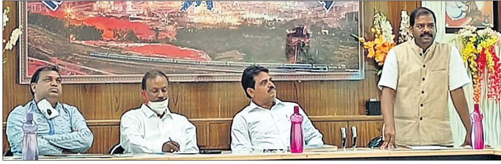
କାର୍ଯ୍ୟକ୍ରମରେ ମଞ୍ଚାସୀନ ଅତିଥିମାନେ ।

କୋରାପୁଟ/ଦାମନଯୋଡି, ୧୧୧୧ (ସ.ପ୍ର./ଡି.ଏନ୍.ଏ.)