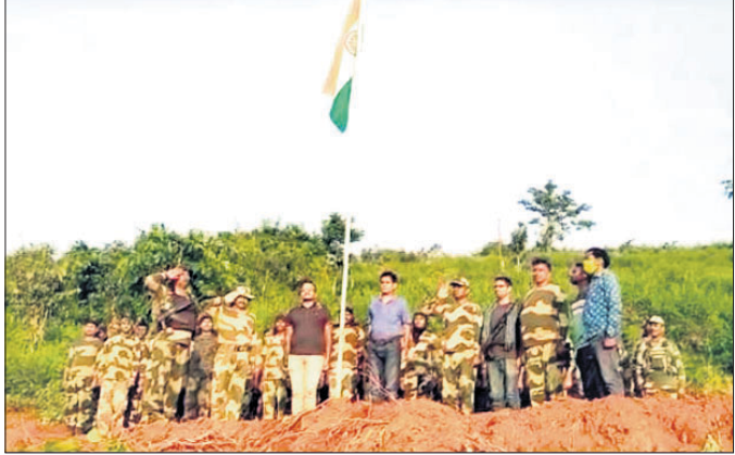
ଗୋରାସେତୁରେ ଯବାନମାନେ ଉଡ଼ାଉଥିବା ତ୍ରିରଙ୍ଗା ପତାକା।