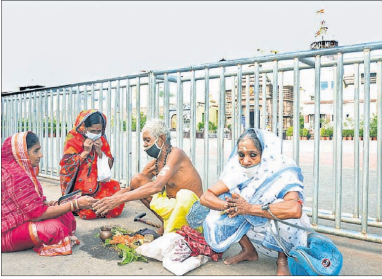
କରୋନା କଟକଣା ଯୋଗୁ ସିଂହଦ୍ୱାର ସମ୍ମୁଖରେ ହବିଷିଆଳିମାନେ କାର୍ତ୍ତିକ ବ୍ରତ ପାଇଁ ସଂକଳ୍ପ କରୁଛନ୍ତି।

ରବିବାରଠାରୁ ପବିତ୍ର କାର୍ତ୍ତିକ ମାସ ଆରମ୍ଭ ହୋଇଛି। ଏହି ପୂଣ୍ୟ ଓ ଧର୍ମ ମାସରେ ହବିଷିଆଳିମାନେ କାର୍ତ୍ତିକ ବ୍ରତ ଆରମ୍ଭ କରିଛନ୍ତି। ମହୋଦଧି ସମେତ ବିଭିନ୍ନ ଚାନ୍ଦି ପୂର୍ଣ୍ଣିମାରେ ପ୍ରତ୍ୟୁଷରୁ ସ୍ନାନ ସାରିବା ପରେ ସଂକଳ୍ପ କରି ବ୍ରତ ଧରିଛନ୍ତି। ଭୁବନୀ ଚଉରା ମୂଳେ ରାଜଦାମୋଦରଙ୍କ ପୂଜା ମଧ୍ୟ କରିଛନ୍ତି। କିନ୍ତୁ ମହାପ୍ରଭୁଙ୍କ ଦର୍ଶନକୁ ହବିଷିଆଳି ଓ ଭକ୍ତ ବଞ୍ଚେ ହୋଇଛନ୍ତି। କୋଭିଡ୍ କଟକଣା ଯୋଗୁ ଶ୍ରୀମନ୍ଦିରକୁ ଭକ୍ତଙ୍କ ପ୍ରବେଶ ବନ୍ଦ ରହିଥିବାରୁ ସିଂହଦ୍ୱାର ସମ୍ମୁଖରେ ପଡିତପାବନଙ୍କୁ ଦର୍ଶନ କରି ହବିଷିଆଳି ଯେଉଁଠି ଅନ୍ୟପକ୍ଷରେ କାର୍ତ୍ତିକ ମାସ ଆରମ୍ଭରୁ ଶ୍ରୀମନ୍ଦିରରେ ନୀତି ବିଲମ୍ବ ହୋଇଛି। ନିର୍ଦ୍ଦିଷ୍ଟ ସମୟର ୨ଘଣ୍ଟା ବିଳମ୍ବରେ ସ୍ନାନ ଖୋଲିଛି।