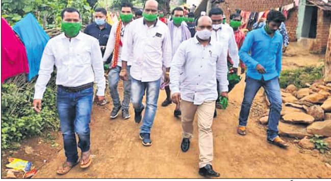
ପୂର୍ବଦେଘା ପଞ୍ଚାୟତରେ ଲକ୍ଷ୍ମୀପୁର ବିଧାୟକ ପ୍ରଭୁ କାନାଜୀ ଜନ ସଚେତନତା କାର୍ଯ୍ୟକ୍ରମ ।

ଜନ ସଚେତନତା କାର୍ଯ୍ୟକ୍ରମ କରିଛନ୍ତି । ଗଣାଧର ଖୋସଲାଇଁ ଚଢ଼ାବଧାନରେ ଏହା ହୋଇଥିଲା ।