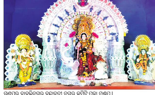
ଗୁଣପୁର ବାବୁଲିନଗର ବୃନ୍ଦାବତୀ ନଗର କମିଟି ପୂଜା ମଞ୍ଚପ ।

ରାୟଗଡ଼ା ଜିଲ୍ଲା ଗୁଣପୁର ଏବଂ ଚିକିରି ସହରରେ କରୋନା ନିୟମ ଅନୁଯାୟୀ ମା' ଗଜଲକ୍ଷ୍ମୀଙ୍କ ପୂଜାର୍ଚ୍ଚନା ଚାଲିଛି ।