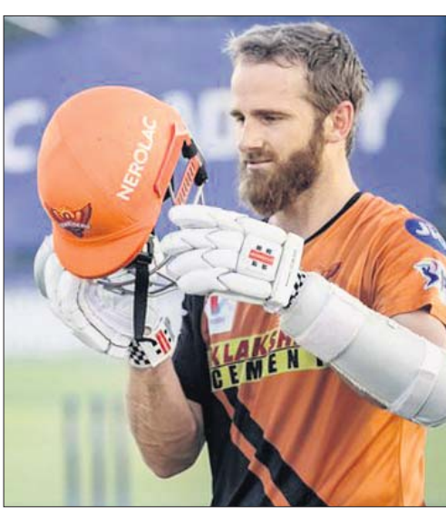
ଅଭ୍ୟାସ ଅବସରରେ କେନ୍ଦ୍ର ଖେଳାଳିମାନଙ୍କୁ।

ନୂଆଦିଲ୍ଲୀ, ୨୧୧୧ (ପି.ଟି.): ମହେନ୍ଦ୍ର ସିଂ ଧୋନୀ ମ୍ୟାଚ୍ ପ୍ରାୟୋଜକ ଦ୍ଵାରା ଦେବ କେବଳ ଆଇପିଏଲ୍ ଖେଳିବାକୁ ଚାହୁଁଥାନ୍ତି।