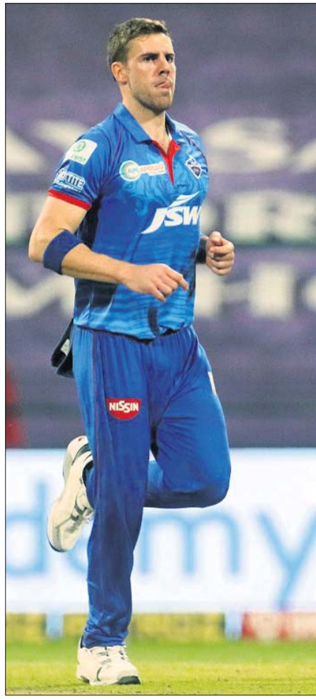
ମ୍ୟାଚ୍ ଅପ୍ ଦି ମ୍ୟାଚ୍ ଏନର୍ଜି ନର୍ଜି।

ଇଣ୍ଡିଆନ୍ ପ୍ରିମିୟର ଲିଗ୍ (ଆଇପିଏଲ୍)ର ସୋମବାର ଅନୁଷ୍ଠିତ ଫ୍ଲୋ-ଅପ୍ରେ ଲିଗ୍ ମ୍ୟାଚରେ ରୟାଲ ଚ୍ୟାଲେଞ୍ଜର୍ସ ବାଙ୍ଗାଲୋର (ଆରସିବି)କୁ ପରାସ୍ତ କରି ଦିଲ୍ଲୀ କ୍ୟାପିଟାଲ୍ସ ତେବେ ୨ଟି ଯାକ ଦଳ ଫ୍ଲୋ-ଅପ୍ରେ ପ୍ରବେଶ କରିଛନ୍ତି।