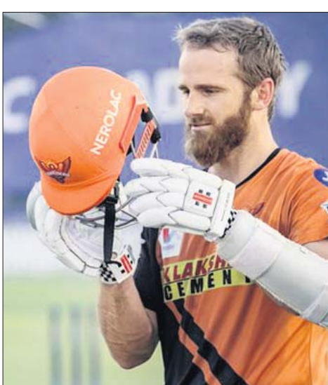
ଅଭ୍ୟାସ ଅବସରରେ କେନ୍ଦ୍ର ଫିଲ୍ଡିଂ ପ୍ରଶସ୍ତ।

ଚଳିତ ଇଣ୍ଡିଆନ୍ ପ୍ରିମିୟର ଲିଗ୍ (ଆଇପିଏଲ୍)ର ଅନ୍ତିମ ଲିଗ୍ ମ୍ୟାଚ ମଙ୍ଗଳବାର ଅନୁଷ୍ଠିତ ହେବ। ଏଥର ଆଇପିଏଲ୍ ଡ୍ରା ପ୍ରତିଦ୍ଵନ୍ଦ୍ଵିତାପୂର୍ଣ୍ଣ ହୋଇଥିବାରୁ ଶେଷ ମ୍ୟାଚ୍ ନ ସରିବା ପର୍ଯ୍ୟନ୍ତ ଫ୍ଲୋ-ଅପ୍ରେ ଲାଇଭ୍ ଅପ୍ରେ ଚାଲୁ ନାହିଁ।