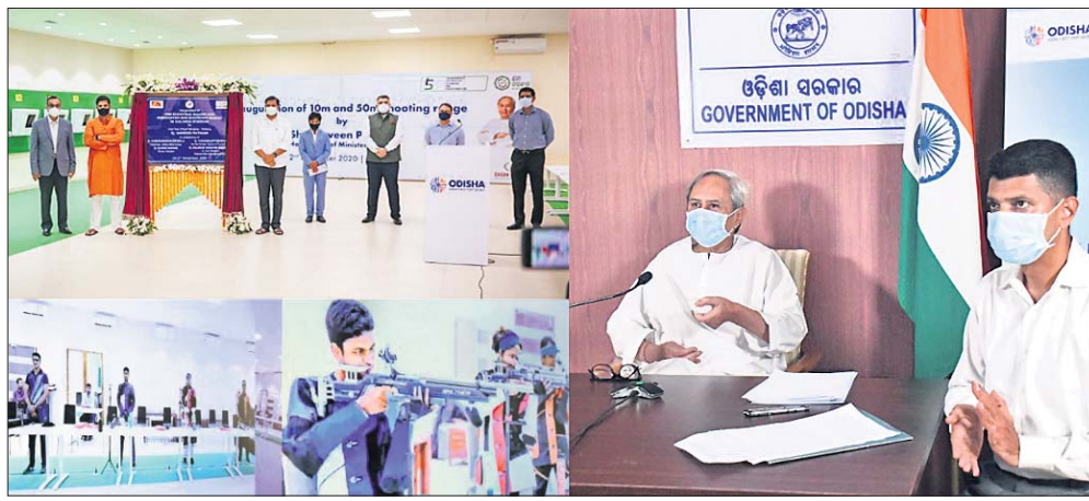
ଭିତ୍ତିଭୂମି କର୍ମସମ୍ପନ୍ନ କରିଥିବା ମୁଖ୍ୟମନ୍ତ୍ରୀ ନବୀନ ପଟ୍ଟନାୟକ କ୍ରୀଡ଼ା ଭିତ୍ତିଭୂମିର ଉଦ୍ଘାଟନ କରୁଛନ୍ତି।

ରାଜ୍ୟକୁ କ୍ରୀଡ଼ା ହବ୍ରେ ପରିଣତ କରିବାକୁ ସରକାର ଉଦ୍ୟମ କରି ରଖିଛନ୍ତି। ଏହିକ୍ରମରେ ମୁଖ୍ୟମନ୍ତ୍ରୀ ନବୀନ ପଟ୍ଟନାୟକ ସୋମବାର ଭିତ୍ତିଭୂମି କର୍ମସମ୍ପନ୍ନ କରିଥିବା ୩ଟି କ୍ରୀଡ଼ା ଭିତ୍ତିଭୂମିର ଉଦ୍ଘାଟନ କରିଛନ୍ତି। ଗଞ୍ଜାମ ଜିଲ୍ଲାର ହିଞ୍ଜିଳିକାଟୁରେ ଲନ୍ଡ଼ୋନର ଷ୍ଟାଡ଼ିୟମ୍, ଛତ୍ରପୁରରେ ୩ଟି ବ୍ୟାଡମିଣ୍ଟନ କୋର୍ଟ ସହିତ ୩ଟି ଲନ୍ଡ଼ୋନର ଷ୍ଟାଡ଼ିୟମ୍ ଏବଂ ଭୁବନେଶ୍ୱର କଲିଙ୍ଗ ଷ୍ଟାଡ଼ିୟମରେ ୧୦ ମିଟର ଏବଂ ୫୦ ମିଟର ଶୁଟିଂ ରେଞ୍ଜକୁ ଲୋକାର୍ପିତ କରିଛନ୍ତି। ସେହିପରି ହକ୍ କ୍ରୀଡ଼ାକୁ ପ୍ରୋତ୍ସାହନ ଦେବା ଲାଗି ଛତ୍ରପୁରଠାରେ ଏକ ସିଲଭର ଟ୍ରଫି ହକ୍ ଚାଲିଯା କେନ୍ଦ୍ର ସ୍ଥାପନ କରାଯିବ ବୋଲି ମୁଖ୍ୟମନ୍ତ୍ରୀ ଘୋଷଣା କରିଛନ୍ତି। ଶୁଟିଂ ରେଞ୍ଜ ଆଦିତ୍ୟ ବିଲା ଗ୍ରୁପ ଦ୍ୱାରା ବିକଶିତ କରାଯାଇଛି। ଏହି ଅବସରରେ ମୁଖ୍ୟମନ୍ତ୍ରୀ କହିଛନ୍ତି ଯେ, ୫ଟି ଅଭିନବ ପ୍ରୟାସ ଭଳି ଆଗାମୀ ଦିନରେ କ୍ରୀଡ଼ାର ବିକାଶ ପାଇଁ ଏକ ବୈପ୍ଳବିକ ପରିବର୍ତ୍ତନ କରାଯିବ। ଉନ୍ନତମାନର ପ୍ରଶିକ୍ଷଣ ଏବଂ ଭିତ୍ତିଭୂମି ଆମ ରାଜ୍ୟର କ୍ରୀଡ଼ାବିତମାନଙ୍କୁ ରାଜ୍ୟ ତଥା ଦେଶର ଚୋରବ ବଢ଼ାଇବାରେ ସହାୟତା କରିବ। ଆସନ୍ତା ଦଶନ୍ଧିକୁଳରେ ରାଜ୍ୟରୁ ନୂଆ ପିଢ଼ିର ବିଶ୍ୱପ୍ରଥମ କ୍ରୀଡ଼ାବିତ୍ ସୃଷ୍ଟି ହେବେ। ହିଞ୍ଜିଳିକାଟୁ ରାଜ୍ୟର ଏକ